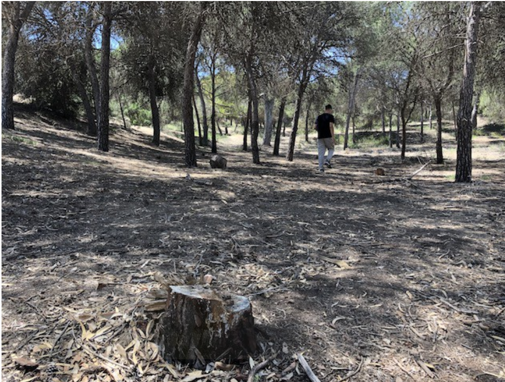
IMAGEN 12. El clareo consiste en eliminar árboles vivos en zonas superpobladas para evitar que compitan por la poca agua. De esta manera, se sacrifican unos pocos para la supervivencia del resto. ARNAU JOVER.

El ecologista también afirma que el espigón no tiene nada que ver con la regresión de la playa, explicando que si no hay arena es porque no hay aportes constantes del Segura. Por lo tanto, afirma que el pino se está secando por falta de agua y evotranspiración, no por la cercanía al mar. Arroyo también alerta de que “tenemos que ser conscientes de que van a haber muchos cambios, los cuales se dirigen hacia el aumento de las temperaturas y la escasez de agua”.