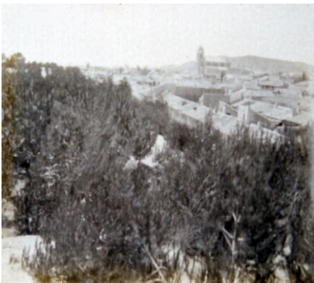
IMAGEN 4. Parte norte del pueblo a los doce años de repoblación. 1913. FRANCISCO MIRA.

Tras neutralizar el avance de las arenas, comenzaron las primeras siembras de pino piñonero, carrasco y marítimo. Pero el temor a que aves y roedores se comieran las semillas antes de que germinasen, conllevó que se habilitara un vivero defendido por cañizos perimetrales. En él, se excavaron pozos de dos metros de profundidad, que con bombas de agua servían para regar las plantaciones. Además, se introdujeron dos especies de eucalipto y palmeras de bajo porte. Los guardamarencos también tuvieron que enfrentarse a dos plagas consecutivas de langostas en 1903 y 1904, que consiguieron erradicar sin haber sufrido la plantación daños irreparables.