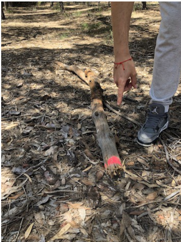
IMAGEN 9. Se marcó a los pinos que se iban a talar con pintura rosa. ARNAU JOVER.

El colegio profesional de ingenieros destaca que el dato más importante hace referencia a que la madera seca no se cotiza igual que la verde, y observan que gran cantidad de madera verde procedía de pinos, los cuales aún tenían algunas décadas más de vida.