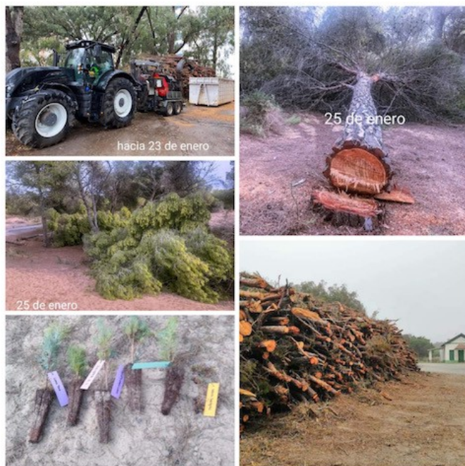
IMAGEN 7. Se han talado un total de 10.000 pinos, incluidos tanto pinos centenarios vivos, como pinos jóvenes de tan solo dos años de vida, y pinos muertos. ASOCIACIÓN VECINOS GUARDAMAR.

Zaragoza explica que, desde que la Pinada pasó de estar bajo las manos del Ministerio a estar en las de la Generalitat, ésta dejó de mantenerse. Aún así, el candidato por el PP, también hace autocrítica, admitiendo que en la anterior etapa de su partido en el poder, tampoco se hizo suficiente. “Tenemos que entonar el mea culpa también”, asume el político. En la misma línea, añade que, “en general, ha habido una dejadez sistemática y que, después de tantos años, se haga una actuación y se ejecute mal. Es todavía más frustrante”.