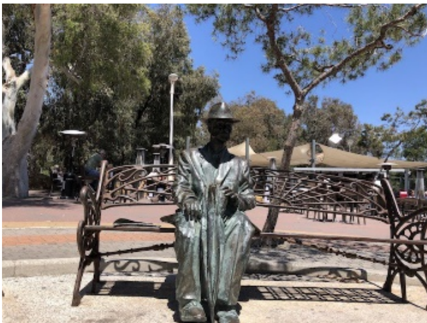
IMAGEN 5. Mira es una leyenda para el pueblo. Le han dedicado dos estatuas y una casa-museo en Guardamar. ARNAU JOVER.

Ante esta problemática que indica el proyecto, se expone como solución la tala de los pinos muertos y en severo declive (aproximadamente 11.000 ejemplares de esta especie), triturando sus restos e incorporándolos a la propia zona; la extracción de la totalidad de la flora exótica, con el mismo proceso posterior de trituración e incorporación al medio; la instalación de bardisas para proteger y recuperar el primer cordón dunar; la plantación de flora autóctona y especies arbustivas dunares, así como acciones de refuerzo del pinar en las zonas de mayor uso público y cercanía al pueblo, donde se prevé que planten aproximadamente 4.000 pinos, según el proyecto.