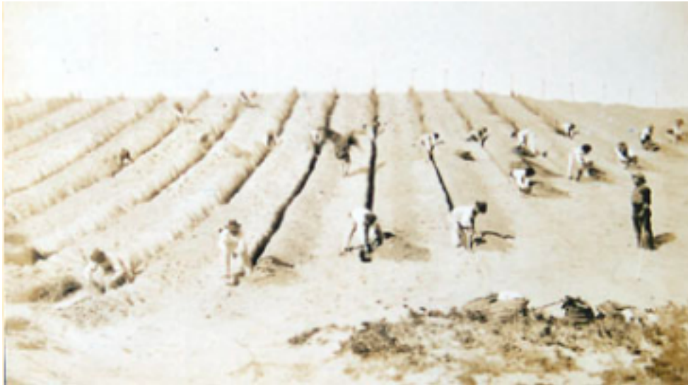
IMAGEN 3. Brigadas de obreros plantando líneas de matas de barrón para la defensa del suelo contra los vientos. 1902. FRANCISCO MIRA.

Tras neutralizar el avance de las arenas, comenzaron las primeras siembras de pino piñonero, carrasco y marítimo. Pero el temor a que aves y roedores se comieran las semillas antes de que germinasen, conllevó que se habilitara un vivero defendido por cañizos perimetrales. En él, se excavaron pozos de dos metros de profundidad, que con bombas de agua servían para regar las plantaciones. Además, se introdujeron dos especies de eucalipto y palmeras de bajo porte. Los guardamarencos también tuvieron que enfrentarse a dos plagas consecutivas de langostas en 1903 y 1904, que consiguieron erradicar sin haber sufrido la plantación daños irreparables.