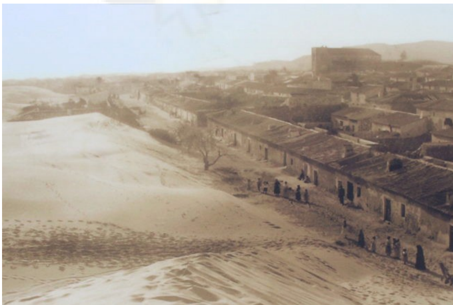
IMAGEN 1. Parte norte del pueblo antes de la repoblación, con las arenas que tienen invadida una calle. Año 1901.