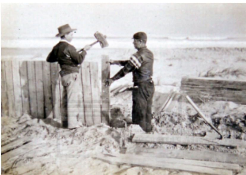
IMAGEN 2. Colocación del tablestacado para formar la duna litoral y detener en la playa la arena que continuamente arroja el mar. 1901. FRANCISCO MIRA.

suelo tan desértico como el que había. En 1900, según consta en el libro del propio ingeniero Mira, “Reposición de las dunas de Guardamar del Segura: Memoria y láminas”, comenzó la primera fase, que consistió en la formación artificial de una duna litoral, la cual serviría de barrera para las arenas que continuamente desalojaba el mar. Se construyó una empalizada mediante tablestacados de metro y medio de altura situados a dos o tres centímetros de distancia los unos de los otros. Así se conseguía filtrar la arena originada por el talud interno de la duna. Se colocaron a unos 70 metros de la línea del mar para conseguir una mayor efectividad.