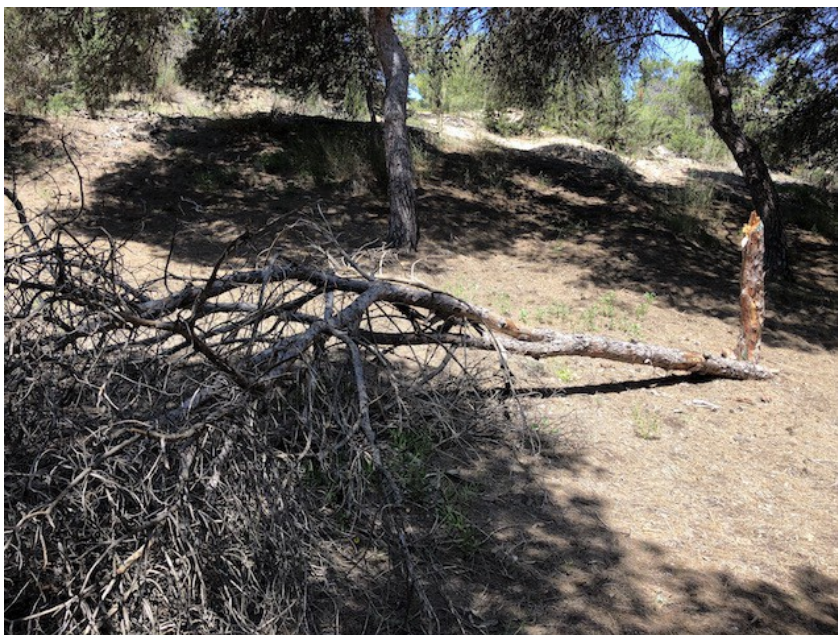
IMAGEN 8. El pinus halepensis es el tipo de pino que mejor ha resistido, contando con el 44,4% de sus ejemplares sanos. ARNAU JOVER.

La representante del PP piensa que “no hay informes que sostengan los argumentos del proyecto sobre la capa freática, salvo que lo dicen ellos”. Díaz expone que con los datos actuales de lluvia es imposible que el subsuelo esté tan seco como dicen. Además, añade que lo que sí que afecta a la capa freática es la salinización de las raíces por la cercanía al mar. La solución a ese problema es regenerando la playa y colocando correctamente el espigón, puesto que está al revés, según la política.