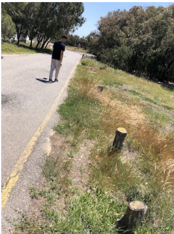
IMAGEN 6. Tocones de pinos talados en el camino que va al Vivero Forestal. A raíz del proyecto, se pueden apreciar en la Pinada zonas con poca densidad de pinos.