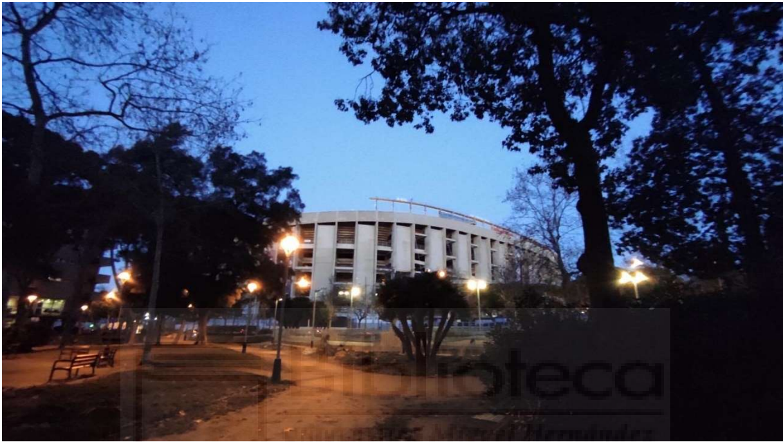
Figura 4. Jardines Bacardí, en los “Aledaños” del Camp Nou.