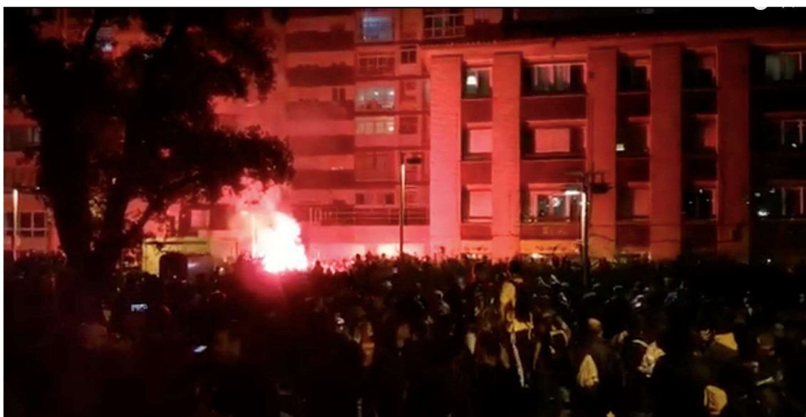
Figura 6. Ejemplo del anonimato que les garantiza a los grupos organizados del FC Barcelona por la mala iluminación en el entorno de los Jardines Bacardí, uno de sus puntos de encuentro y lugar considerado generador de delitos.