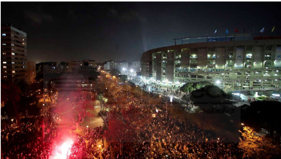
Figura 16. Ejemplo de la magnitud de personas que puede albergar este lugar en concreto por un determinado evento. FC Barcelona – Real Madrid, de liga. Aquí observamos la encendida de bengalas por parte de los grupos organizados.

En la figura 15a se observa como la carencia de luz provoca el efecto de inseguridad y de anonimato. En la figura 15b, se observa el contraste de aplicar una buena iluminación junto con menos elementos de mobiliario ni tanta jardinería.