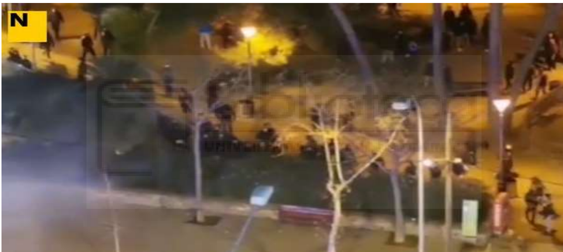
Figura 15 a y 15 b . Ejemplo del contraste de aplicar una buena iluminación junto con menos elementos de mobiliario ni tanta jardinería.