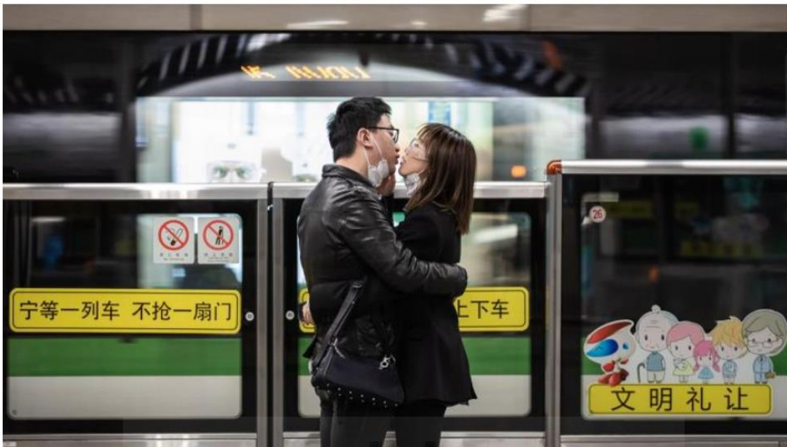
El amor en tiempos del coronavirus sitúa a los amantes al borde de la ley.

búsqueda de la palabra sexualidad en el buscador de la página web de eldiario.es . Pertenece a la sección “Nidos”.