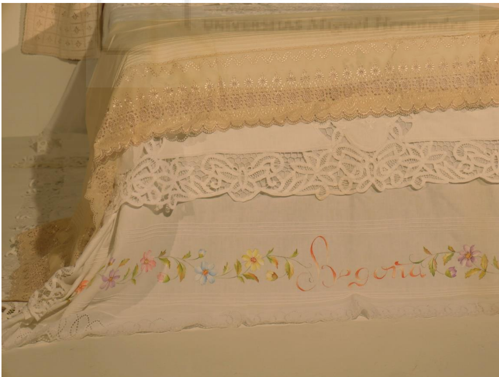
Lola Escribano García: El olor de mi casa (2022). Instalación artística. Tela y ensamblaje. Medidas aproximadas 1,5 m x 1,5 m