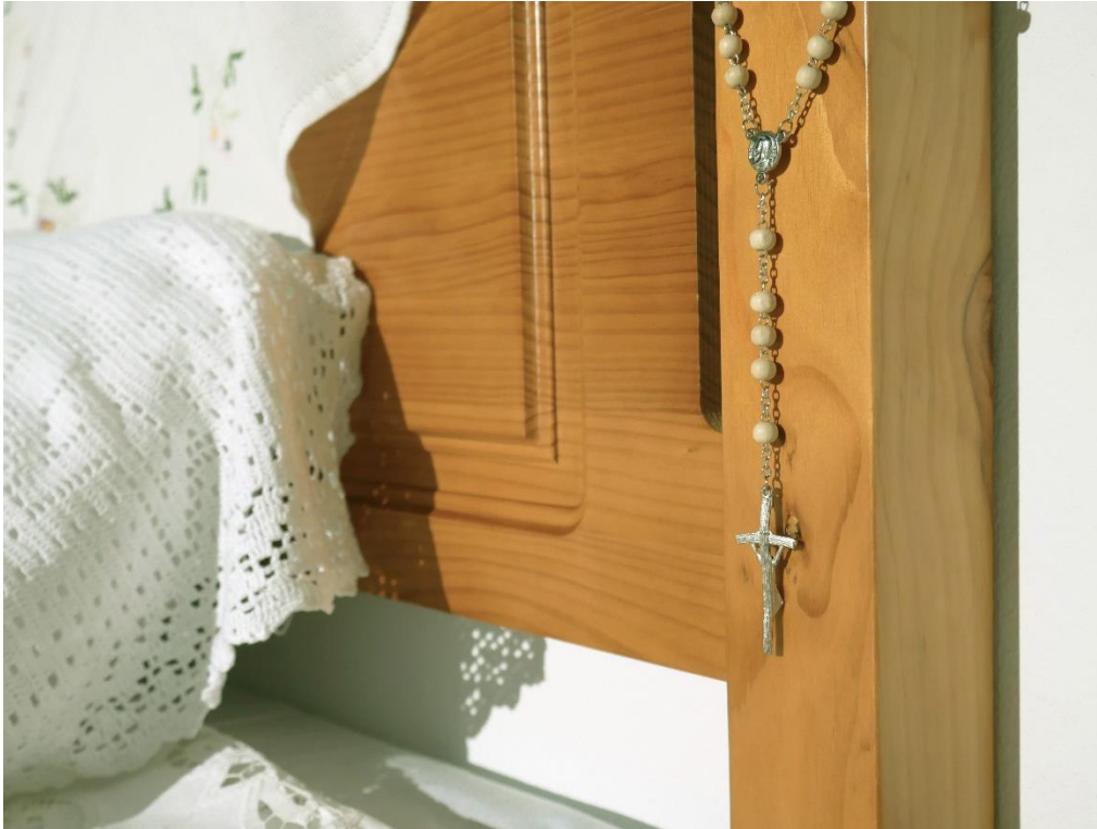
Lola Escribano García: El olor de mi casa (2022). Instalación artística. Tela y ensamblaje. Medidas aproximadas 1,5 m x 1,5 m