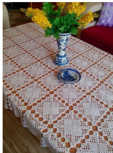
Fig. 1. Altar decorado con telas y ganchillos. Fig. 2. Decoración con ganchillo.