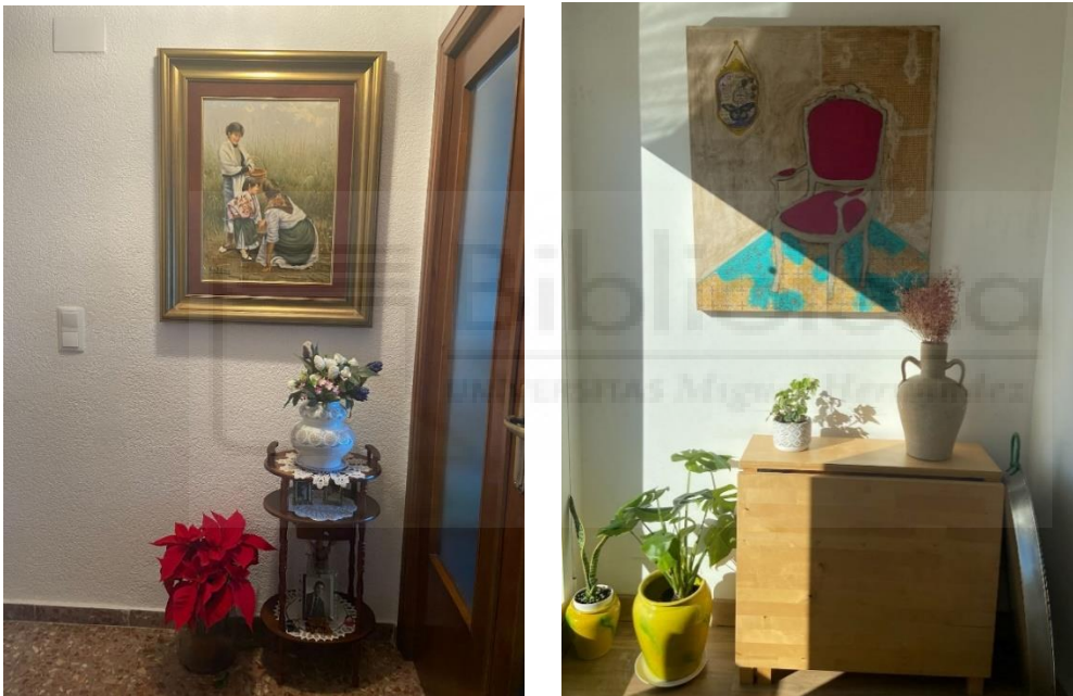
De izquierda a derecha Fig. 1 y 2. Decoración de la casa de la abuela y la madre de la artista.

Para comenzar este proyecto, partimos de una primera búsqueda de las definiciones literales de las palabras claves, para poder analizar a fondo qué significan los vocablos que la artista relaciona con el proyecto. Una vez estudiamos los términos y sus respectivos significados, completamos el marco teórico y pasamos al proceso en el que realizamos un registro fotográfico de las casas del entorno de la artista, para encontrar posibles semejanzas y discordancias que nos muestren más gráficamente la reflexión del proyecto.