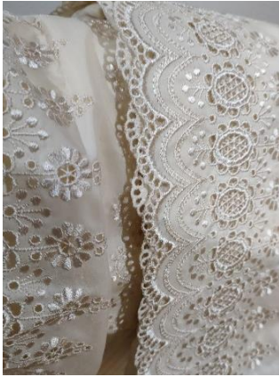
Fig. 1. Ajuar utilizado en la pieza.

A continuación, elegimos una serie de bordados, ganchillos y tapetes realizados por mujeres de la familia de la artista: