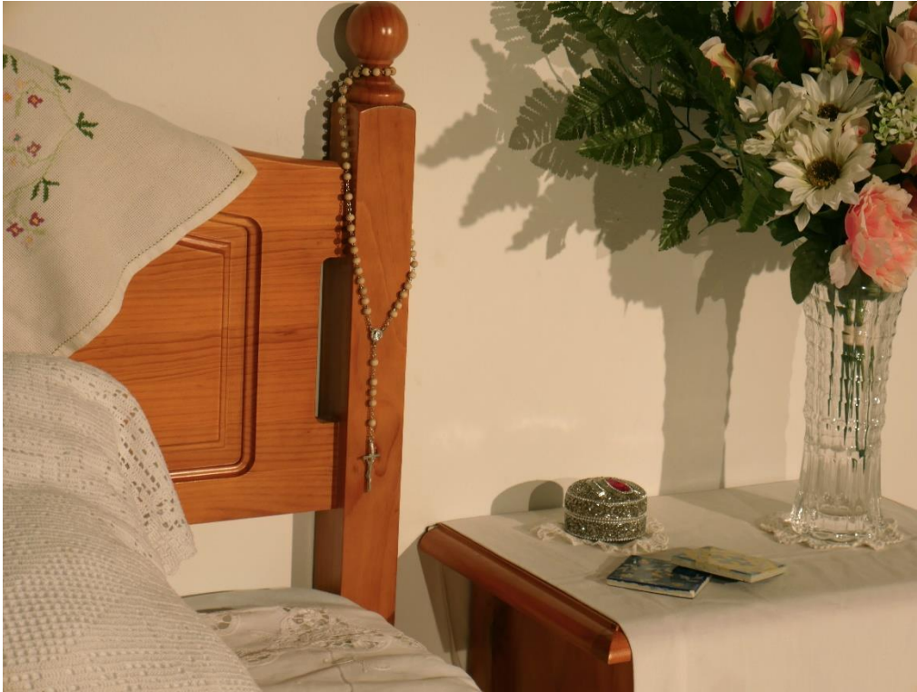
Lola Escribano García: El olor de mi casa (2022). Instalación artística. Tela y ensamblaje. Medidas aproximadas 1,5 m x 1,5 m