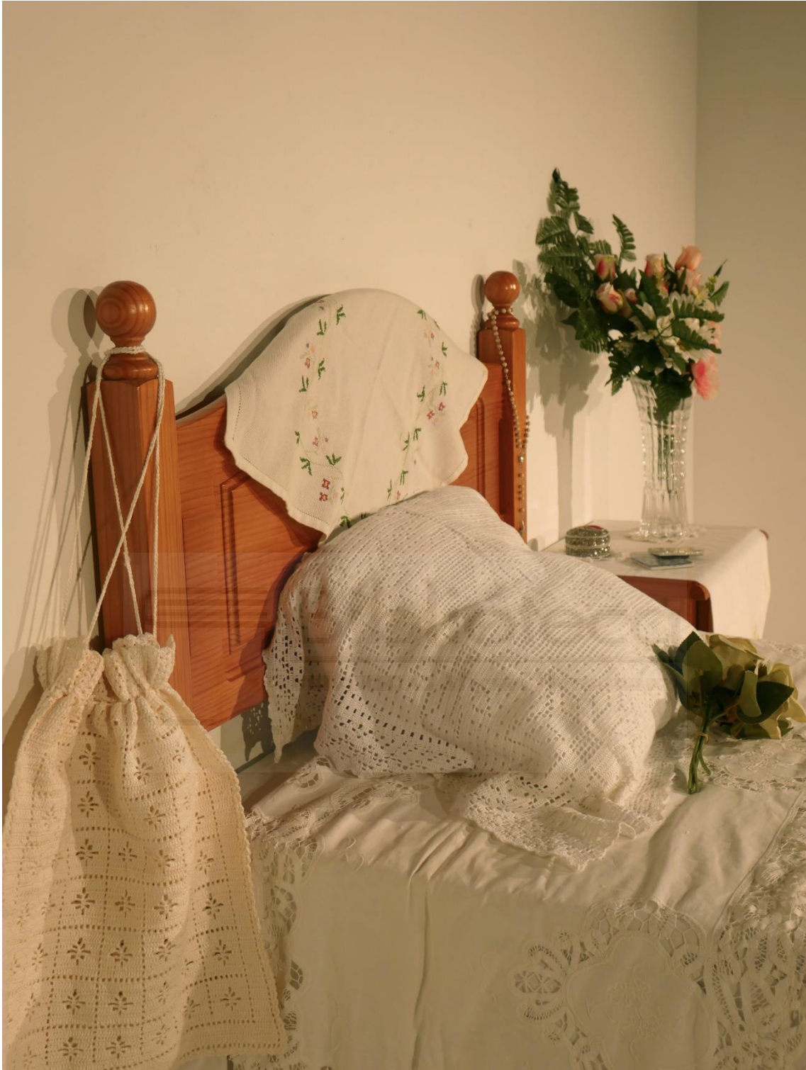
Lola Escribano García: El olor de mi casa (2022). Instalación artística. Tela y ensamblaje. Medidas aproximadas 1,5 m x 1,5 m