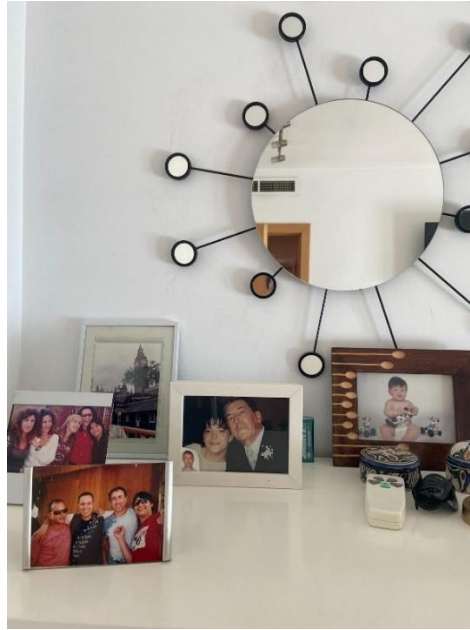
De izquierda a derecha Fig. 1 y 2. Altar familiar de la casa de la abuela y la madre de la artista.