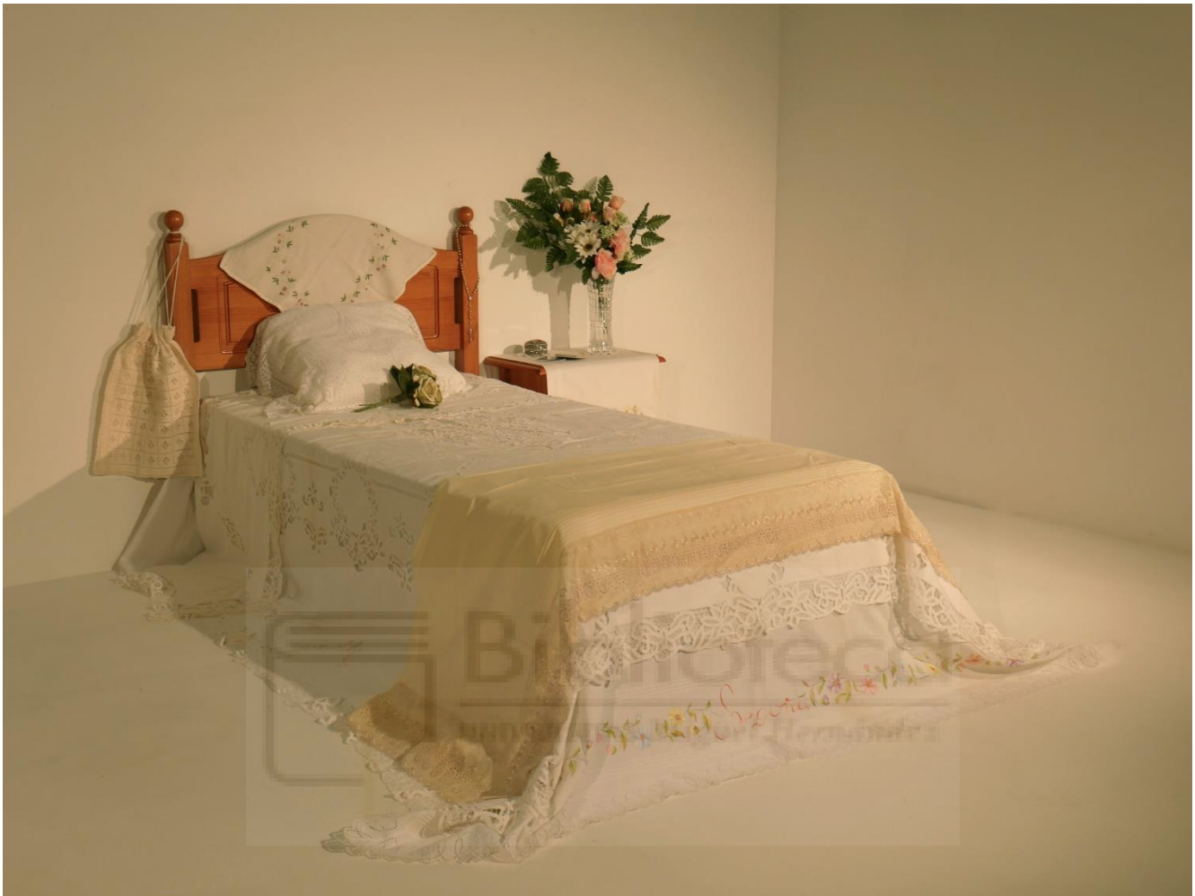
Lola Escribano García: El olor de mi casa (2022). Instalación artística. Tela y ensamblaje. Medidas aproximadas 1,5 m x 1,5 m