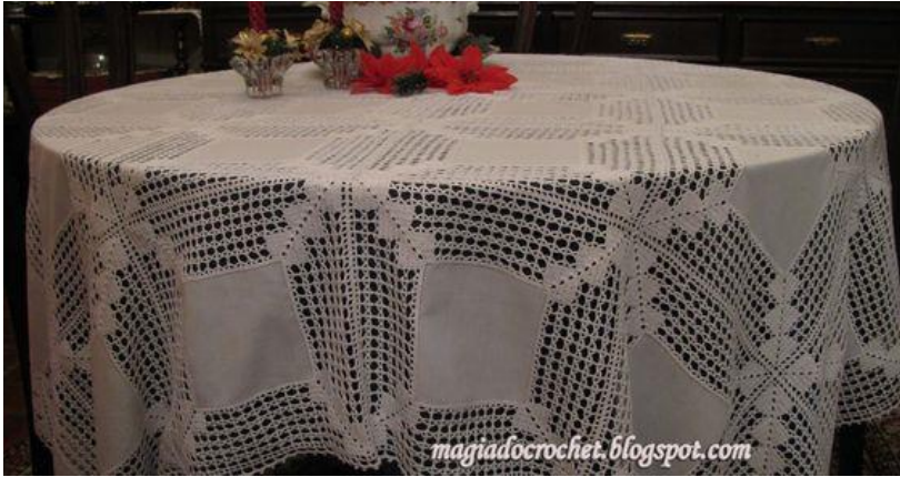
Fig.1. Decoración con ganchillos.