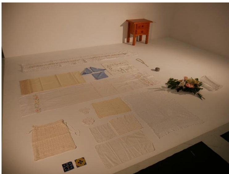
Fig. 1. Decoración utilizada en la pieza.

De izquierda a derecha Fig. 1 y 2. Decoración utilizada en la pieza.