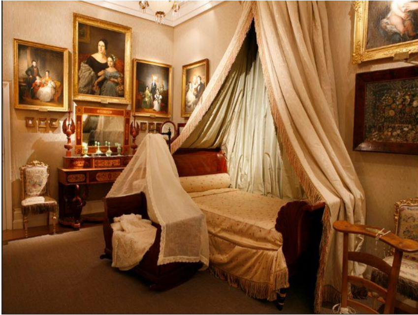
Fig. 1. Alcoba femenina . (1850). Palacio del marqués de Cerralbo. Museo del Romanticismo. Madrid