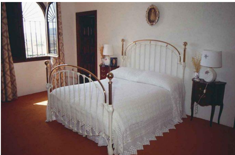
Fig.1. Habitación Isabel Pantoja. Cantora, Cádiz.