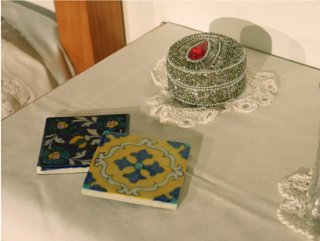
Lola Escribano García: El olor de mi casa (2022). Instalación artística. Tela y ensamblaje. Medidas aproximadas 1,5 m x 1,5 m