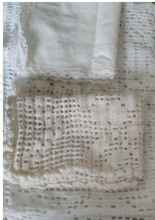
De izquierda a derecha Fig. 1 y 2. Bordados y ganchillos utilizados en la pieza

Finalmente, escogemos una serie de objetos que consideramos que expresan bien la esencia que queremos reflejar: