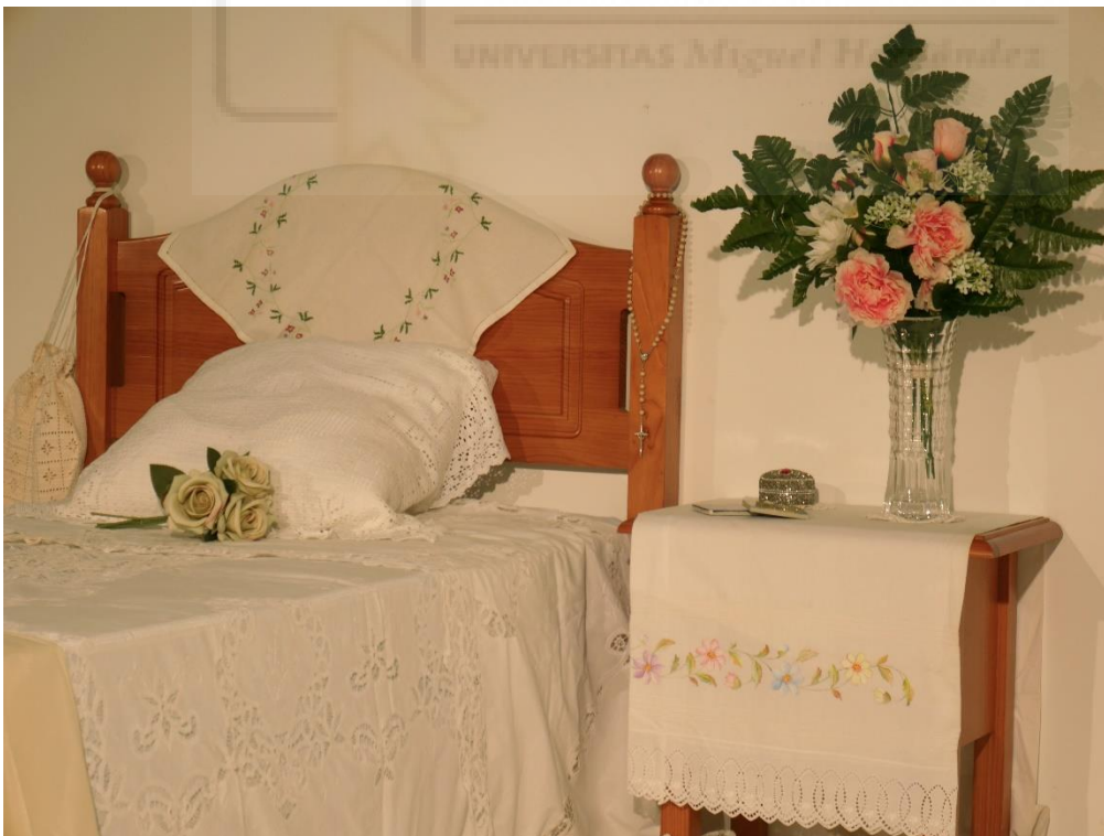
Lola Escribano García: El olor de mi casa (2022). Instalación artística. Tela y ensamblaje. Medidas aproximadas 1,5 m x 1,5 m