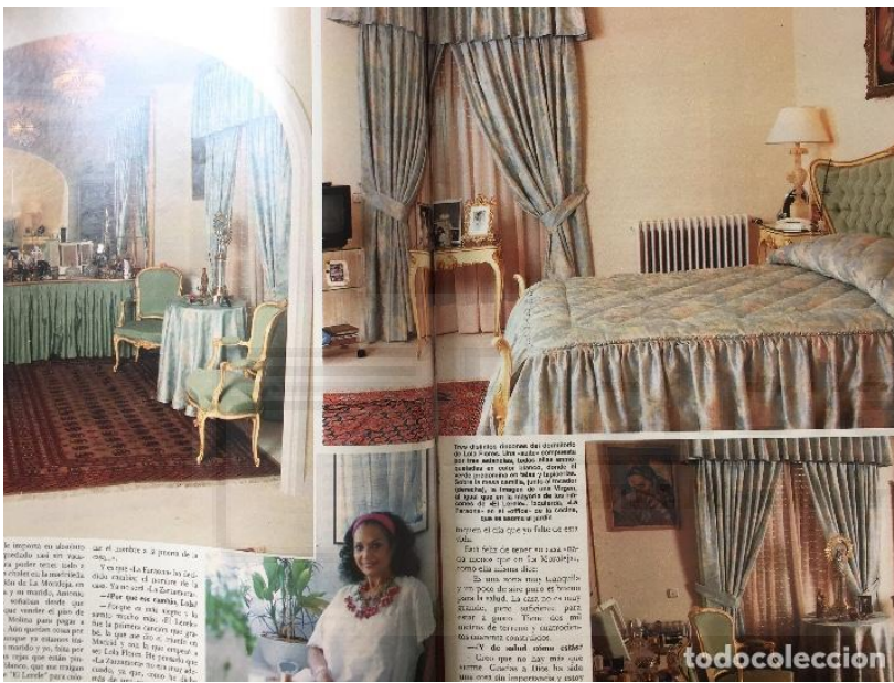
Fig. 1. Interior del Lerele. Residencia de Lola Flores.