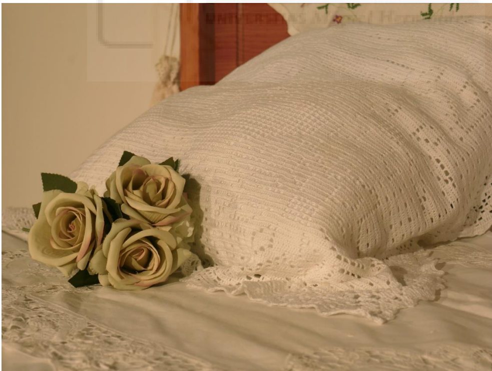
Lola Escribano García: El olor de mi casa (2022). Instalación artística. Tela y ensamblaje. Medidas aproximadas 1,5 m x 1,5 m