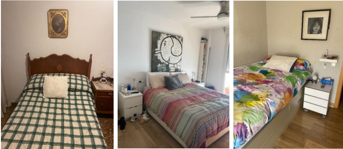
De izquierda a derecha Fig. 1 y 2. Dormitorio de la abuela, la madre y la propia artista.

El principal referente estético sería el de la época de la abuela (años 60 aproximados) ya que esta decoración puede ser el origen del proyecto y consideramos que mantiene mejor los códigos a los que nos referimos a lo largo del TFG y que tienen mayor simbología, mientras las otras dos generaciones adaptan a una modernidad estos patrones.