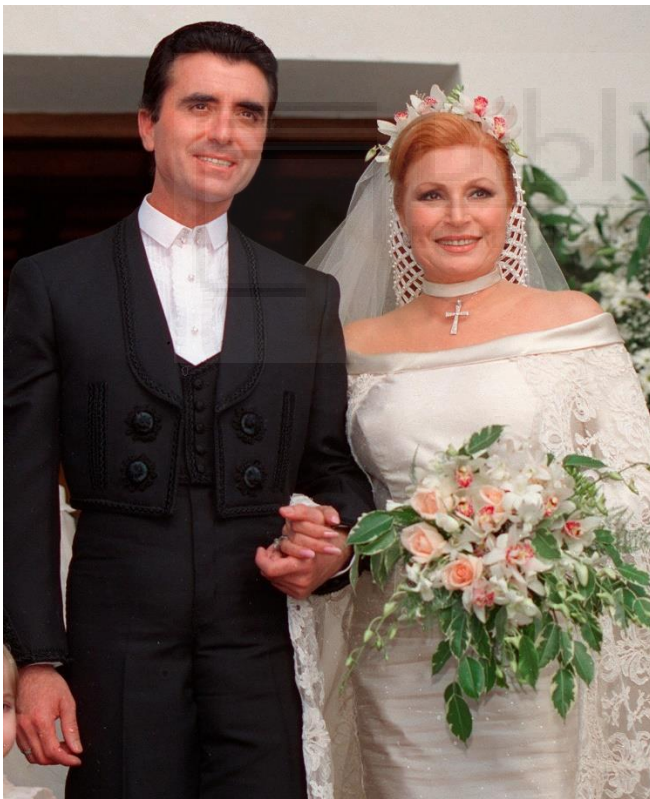
Fig. 1. Boda Rocío Jurado y José Ortega Cano (1995)