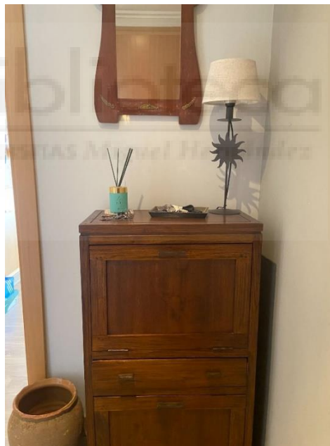
De izquierda a derecha Fig. 1 y 2. Entrada de la casa de la abuela y la madre de la artista.

Tras este análisis sobre el registro fotográfico llegamos a dos puntos. El primero nos sirve fundamentalmente para comprender los elementos comunes que necesitamos en la pieza. Mientras que el segundo punto nos lleva a analizar los materiales que encontramos, y así averiguar cuáles necesitamos para la obra.