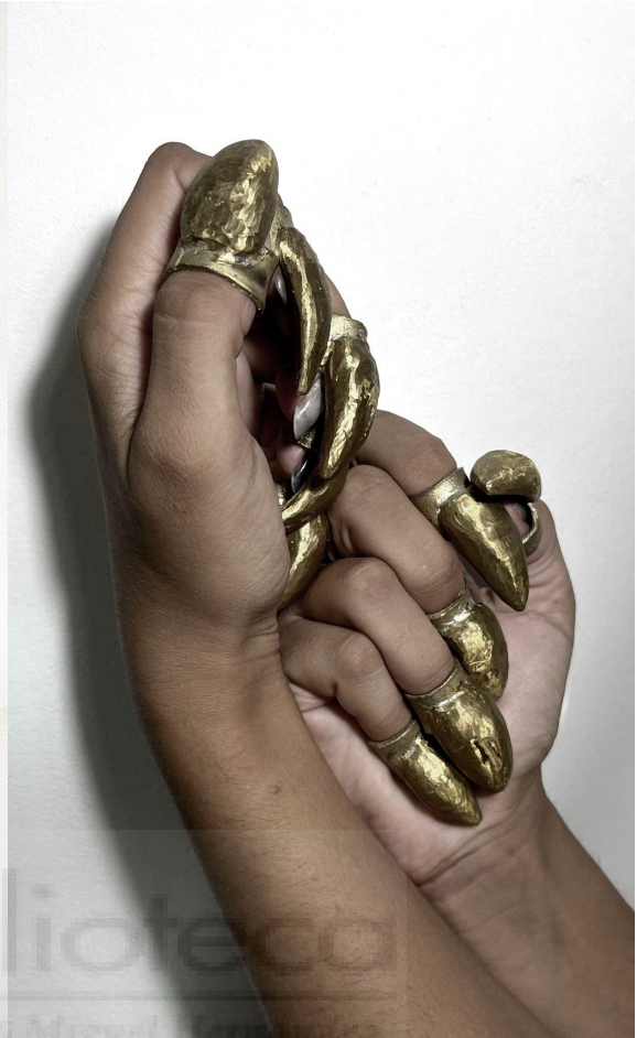
Sin título (2022) cera perdida, laton, 4-5 cm