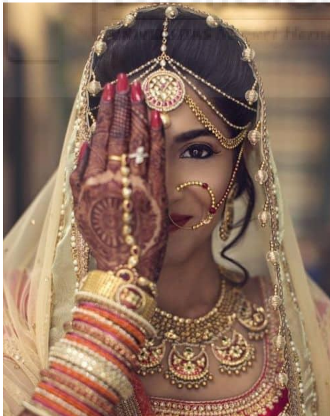
Novia hindú, representación del nathmi.

El Payal o Pajeb es un accesorio que se usa alrededor del tobillo lo usan las mujeres en las bodas y su función es embellecer y dar ternura al pie.