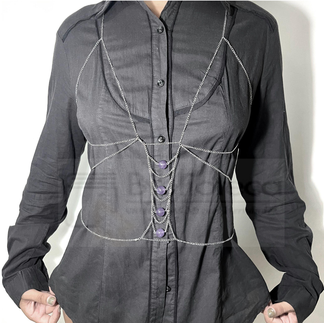
Sin título (2022) acero inoxidable, 55 x 40 cm