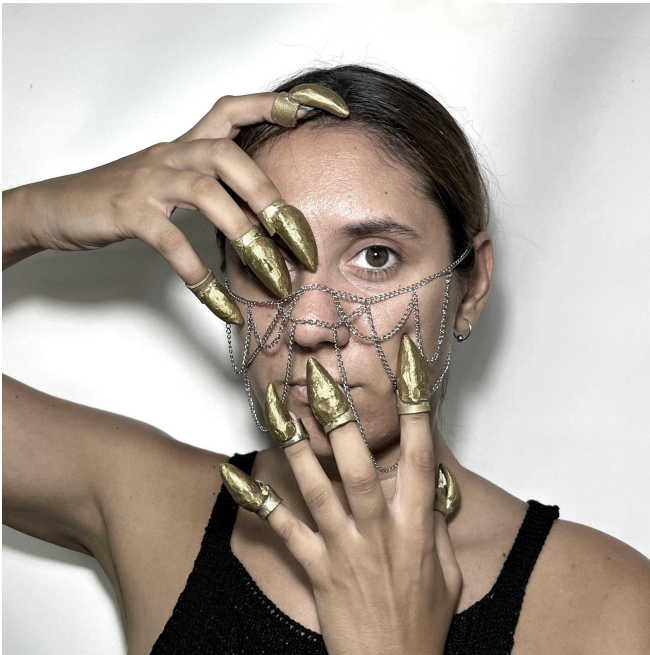
Sin título (2022) cera perdida, laton, 4-5 cm