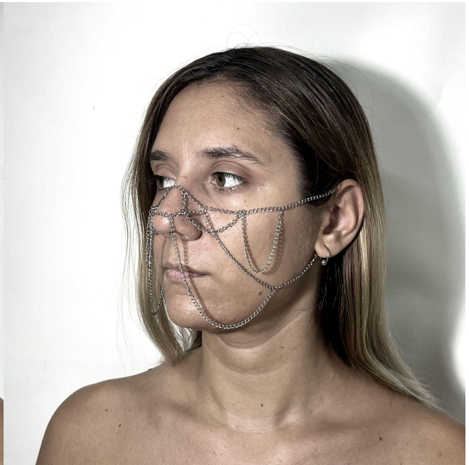
Sin título (2022) acero, 33 x 14 cm