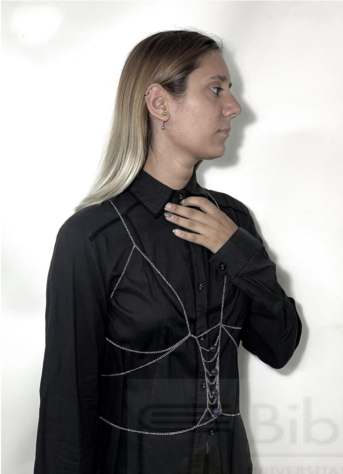
Sin título (2022) acero, 55 x 40 cm