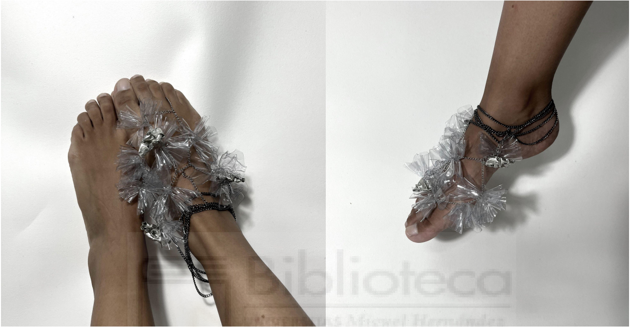
Sin título (2022) técnica mixta, acero, plástico y estaño. 19 x 11 cm