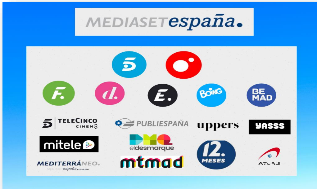
Gráfico de elaboración propia 2 Composición Mediaset España