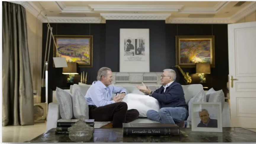
Imagen de la entrevista en el programa Mi casa es la tuya