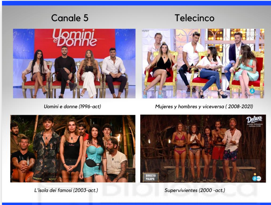
Gráfico de elaboración propia 3, comparación Canale 5 y Telecinco

Este modelo rentable de hacer televisión ha sido construido en torno a las siguientes estrategias y características: