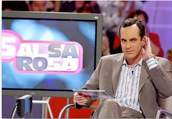
Santi Acosta presentando Salsa Rosa