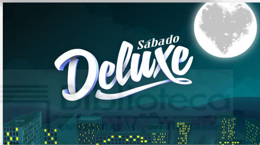
Cabecera Sálvame Diario y Sábado Deluxe / Fuente: Google Imágenes