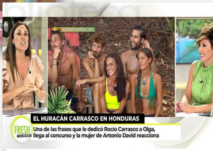
Ya es mediodía

Por otra parte, gracias a la telerrealidad y los programas de corazón Telecinco ha encontrado la fórmula perfecta con la que fabricar constantemente nuevos famosos. Las celebridades tradicionales se quedan en un segundo plano, y las nuevas personalidades que interesan son los concursantes de los realities . Gente de a pie, sin ningún mérito