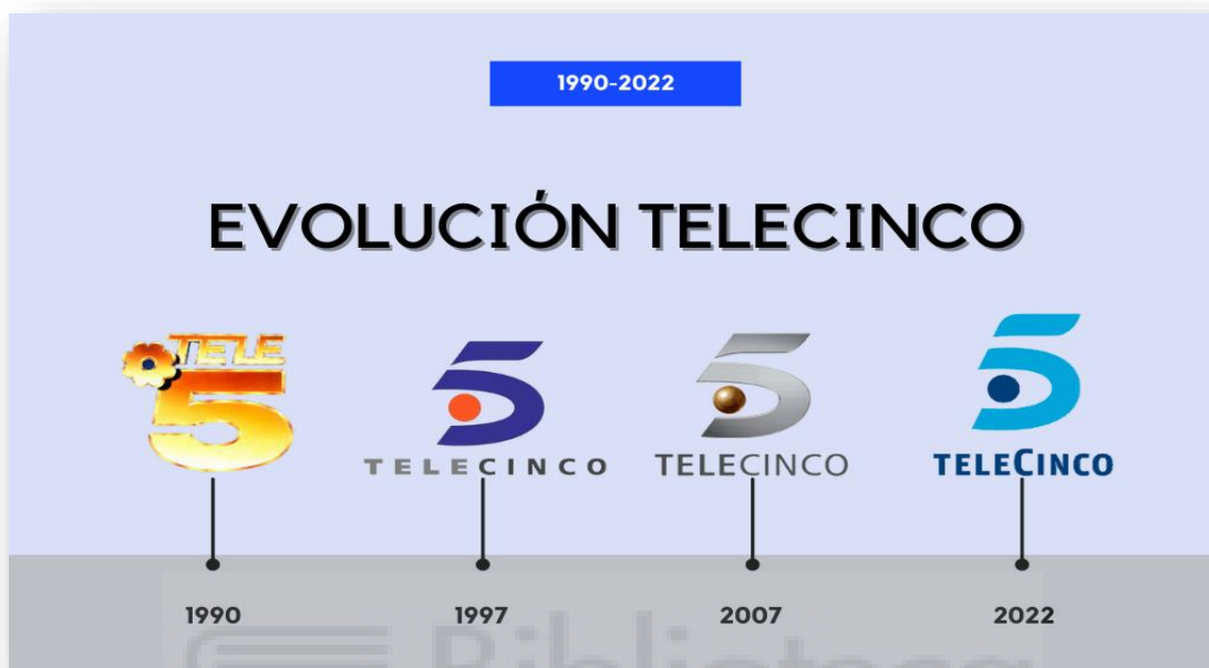
Gráfico de elaboración propia 1 – Evolución de Telecinco 1990-2022