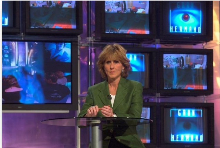
Imagen de la periodista y presentadora de Gran Hermano , Mercedes Milá/