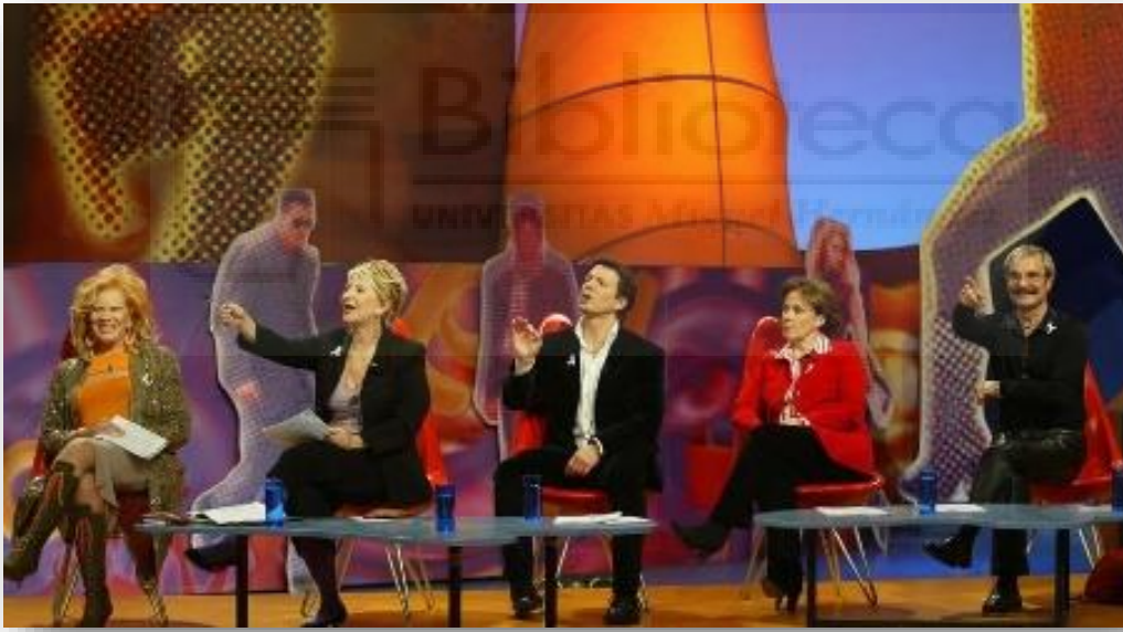
Plató de Tómbola

Un elemento inherente al propio ser humano que lo ayuda a crear, encontrar, descubrir y, también, por qué no, a fisgonear, husmear, espiar, curiosear... en definitiva, a cotillear... y ahí es donde, de nuevo, entra en juego la prensa del corazón como instrumento que facilita esas funciones.