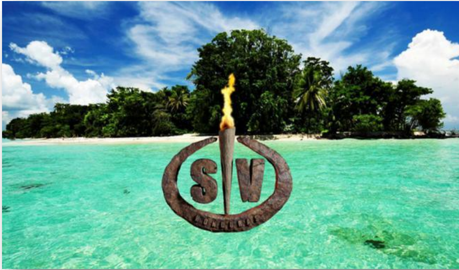
Cabecera Supervivientes