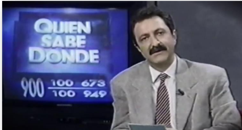
Paco Lobatón presentando Quién sabe donde

reencuentros o las confesiones más íntimas, que en muchas ocasiones eran alentadas por el equipo del programa.