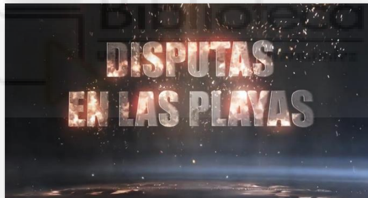
Rótulos del inicio de Supervivientes

Todos los programas inician con un cebo o avance en el que se recogen las imágenes más polémicas. Estas son acompañadas de titulares sensacionalistas para despertar el interés del público y que no cambie de canal hasta conocer su desenlace.