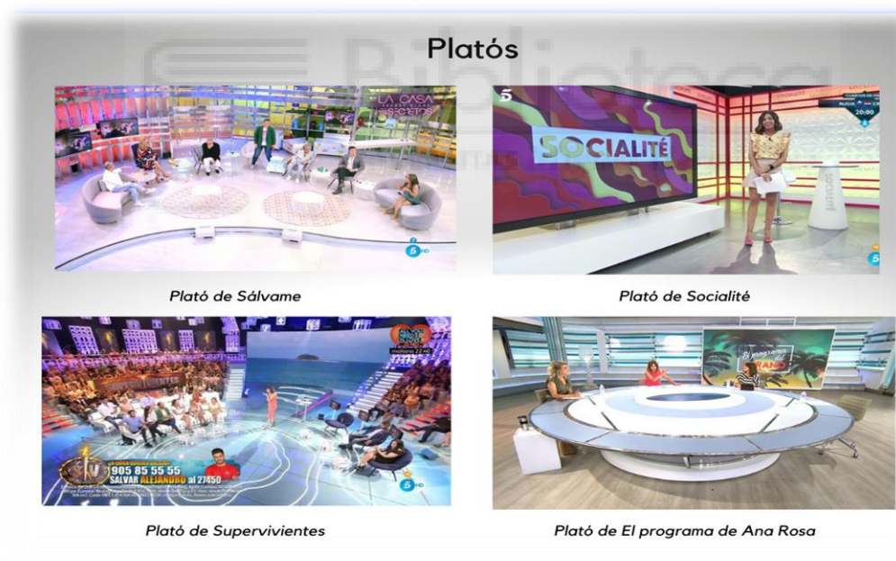
Gráfico elaboración propia 4/ platós de Telecinco

Si algo tienen en común los programas de Telecinco es su puesta en escena. Todos los platós de la cadena siguen una puesta en común: son diáfanos, simples y luminosos.