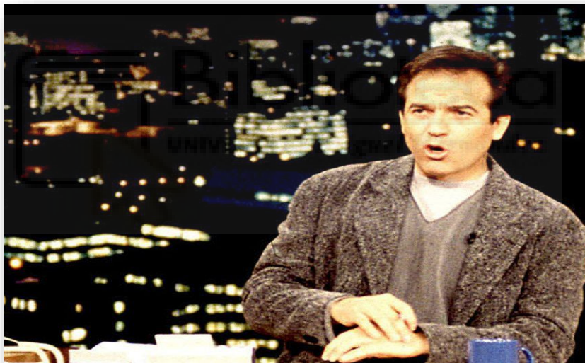
Pepe Navarro en Esta noche cruzamos el Mississippi

Más tarde en 1997, tras dos años de exitosas emisiones el late night y su presentador se trasladarían a Antena 3 . El formato sería el mismo, pero bajo un nuevo nombre: La sonrisa del pelícano .