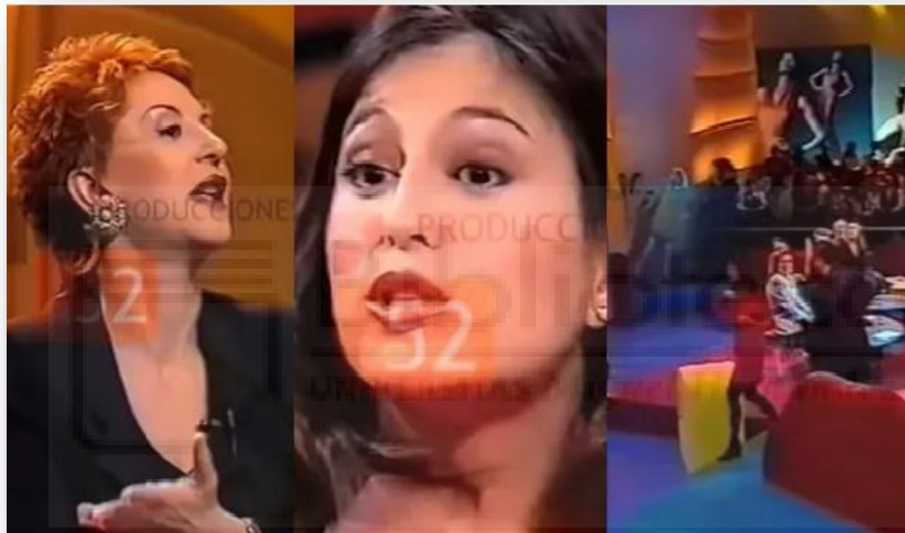
Entrevista de Chabeli en el primer programa de Tómbola

La primera emisión de Tómbola fue una de las más sonadas y polémicas que se recuerdan, y a su vez fue crucial para conocer la dinámica del programa. La invitada principal Chabeli Iglesias, hija de Julio Iglesias e Isabel Preysler, se sentaba en el plató de Tómbola , esperando una tranquila y respetuosa entrevista. Pero no fue así, los periodistas del espacio, especialmente Karnele Marchante y Jesús Mariñas fueron tremendamente duros: “esta señora no hace nada”, “no sabe ni leer ni escribir”, “no nos interesa nada”, “nos estamos riendo de ella”. Tras varios minutos aguantando la situación, Chabeli se levantó y abandonó el plató en directo alegando: “Me voy, me da vergüenza tu programa y esta gente es gentuza”.