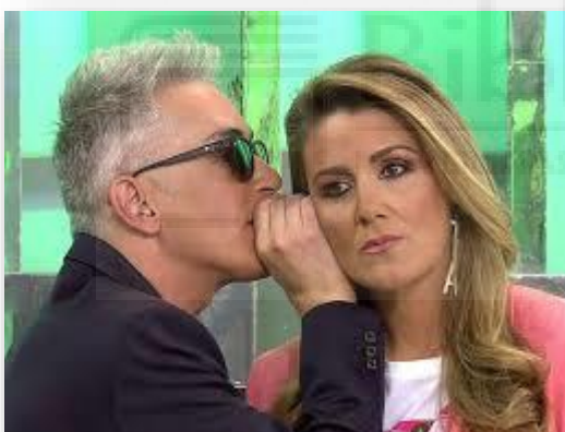
Kiko Hernández y Carlota Corredera

Los niveles de sensacionalismo de Sálvame son muy altos, ya que emplean muchas de estas técnicas. Normalmente, cuando tienen que dar una noticia o exclusiva usan mucho dramatismo. Por ejemplo, repiten el avance una y otra vez, modifican la escenografía; apagan las luces del plató, cambian la música e incluso el tono del presentador es totalmente distinto. Una estrategia que se repite es que van desvelando pequeños datos, nunca la noticia al completo. Sino también cuentan la noticia a los colaboradores y las expresiones de estos al enterarse siempre son muy exageradas y forzadas. Todo ello, para provocar sensaciones al espectador y que acabe viendo el programa al completo para finalmente conocer la noticia.