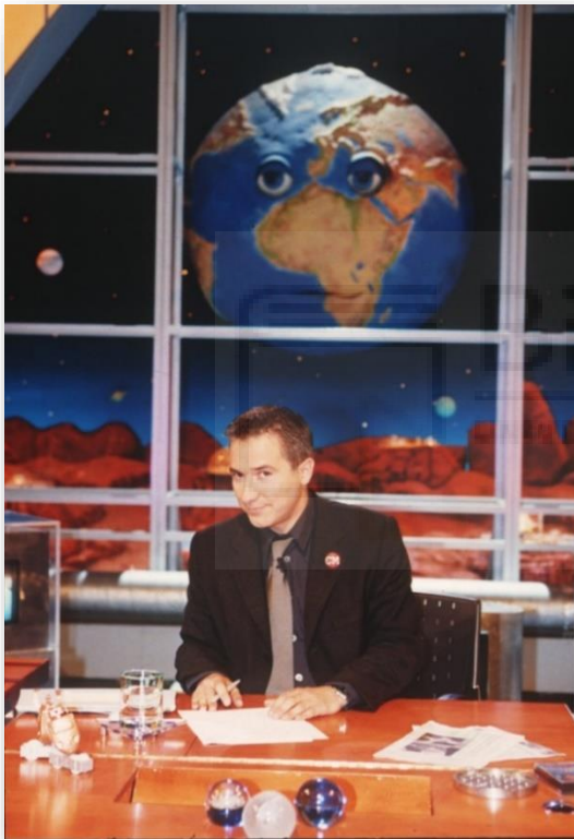
Javier Sardá en el plató de Crónicas Marcianas

Crónicas Marcianas tomó como referencia a los late nights americanos, pero quiso innovar en el concepto. Así lo explicó Sardá en su entrevista en el programa Mi casa es la tuya 50 de Bertín Osborne: