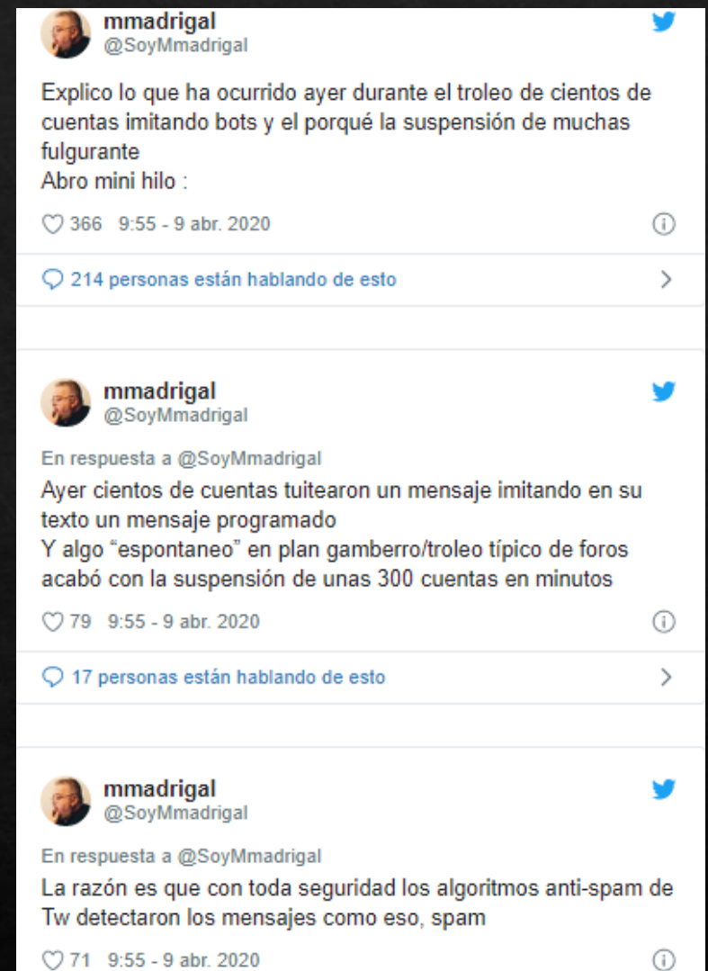
Captura extraída del diario público del tweet de Madrigal publicado el 9/4/20 a las 9:55 h