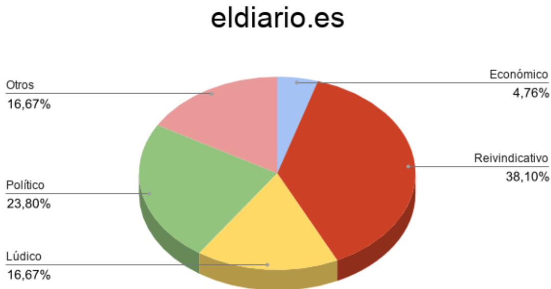
Figura 5. Gráfico carácter publicaciones de eldiario.es.

eldiario.es es, de los tres medios analizados, el que más publicaciones tiene sobre las cuestiones reivindicativas del Orgullo (38,10%) en el periodo analizado. Por otra parte, también aborda el Orgullo desde el punto de vista político y de las relaciones entre los partidos, mientras que el contenido lúdico y de otros temas son cubiertos a partes iguales (16,67% en ambos casos).