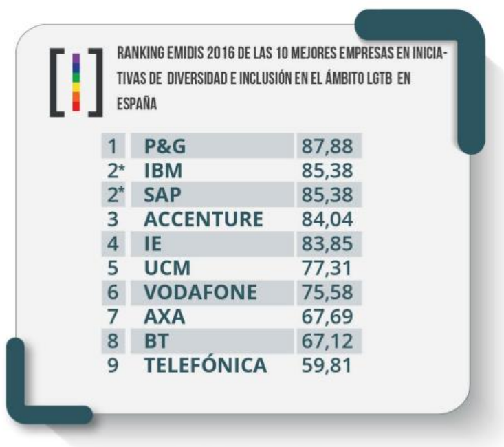
Figura 12. Captura pantalla Ranking Emidis, 2016.

Vodafone ha participado en el Informe EMIDIS 82 , que evalúa las políticas que las empresas desarrollan para fomentar la inclusión de la diversidad sexual y de género.