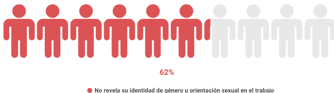
Figura 13. Gráfico personas que ocultan su orientación sexual en el trabajo. Elaboración propia a partir de los datos: https://mpatika.com/wp-content/uploads/2019/05/La-Diversidad-LGBT-en-el-Contexto-Laboral-en-Espan%CC%83a.pdf

Todavía existe miedo por parte de las personas LGTB a que su identidad de género u orientación sexual pueda afectarles negativamente en su vida profesional. De hecho, según este mismo estudio, a pesar de que deben existir medidas para evitar la discriminación, las personas no-heterosexuales sufren lo siguiente: