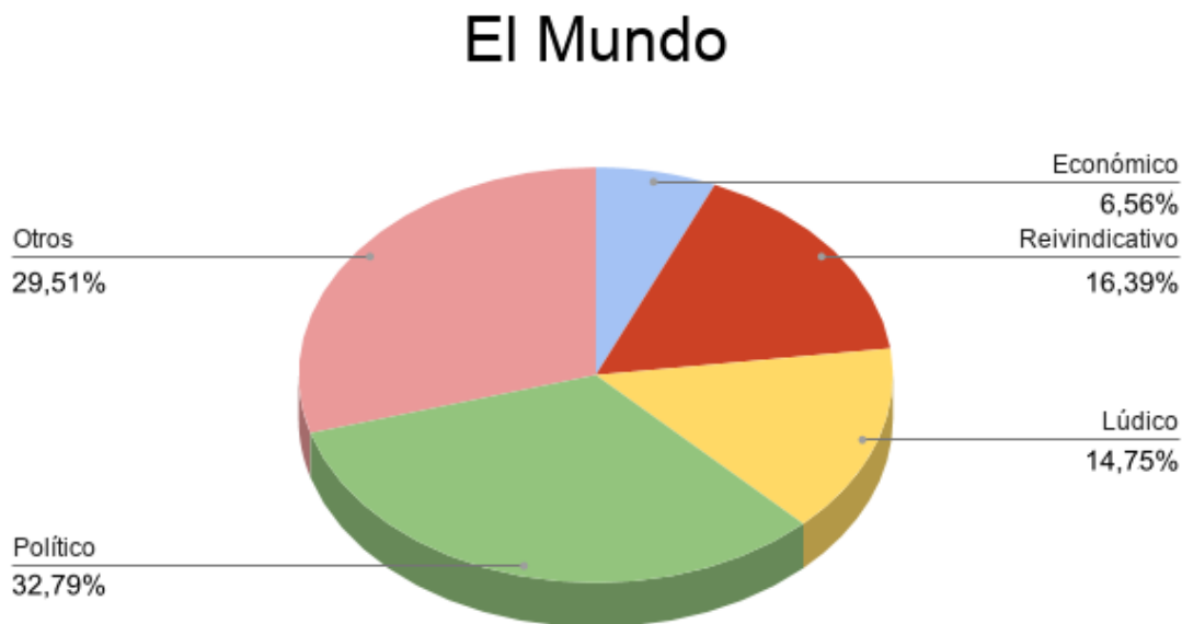
Figura 4. Gráfico carácter de publicaciones El Mundo .

El carácter de las publicaciones de El Mundo sobre el Orgullo es, predominantemente, político (32,79%), pues relacionan esta manifestación, sobre todo, con enfrentamientos partidistas sobre quiénes muestran más apoyo al colectivo LGTB. Sin embargo, el segundo porcentaje más elevado es el que está relacionado con otras cuestiones, en este caso suelen publicar cada año la basura que deja la celebración de las marchas y las posteriores fiestas o las horas extras que tendrán que hacer algunos sectores profesionales e incluso los altercados que se producen en el Orgullo y que deben ser atendidos por la policía.