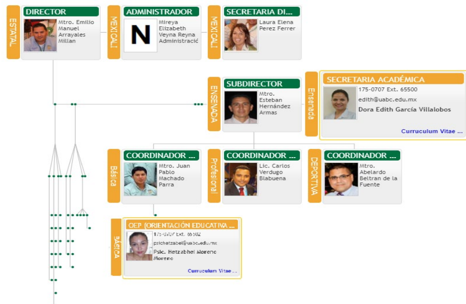
Figura 1. Organigrama del centro

La finalidad de la Facultad de Deportes (UABC) es formar profesionales cualificados en la actividad física y deporte, que apliquen principios científicos y técnicos específicos de la motricidad humana, para el diseño y desarrollo de soluciones a problemáticas en el ámbito nacional e internacional, con sentido ético, responsables, emprendedores y capaces de adaptarse a las demandas del entorno; además de fomentar la generación y transferencia de nuevos conocimientos para ayudar al desarrollo de la sociedad a través de la cultura física. Para fomentar esta cultura, la Facultad de Deportes, oferta y desarrolla una gran cantidad de actividades de salud, lúdico-deportivas y disciplinas específicas para todos los alumnos de la universidad y la población de Ensenada, promocionando así el deporte y sus beneficios.