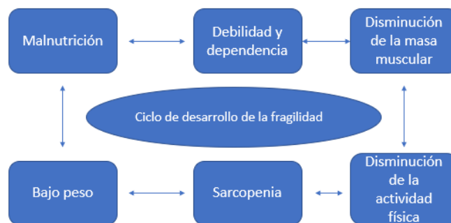
Ciclo de desarrollo de fragilidad, imagen adaptada de Hernández et al., 2018

Teniendo claro lo anterior, un aspecto clave para el desarrollo de la fragilidad son los factores dietéticos, el estado nutricional es la clave y varios estudios muestran relación entre el estado nutricional, la ingesta de nutrientes y el desarrollo de fragilidad. Los aspectos más importantes son el aporte calórico, la cantidad y calidad de proteínas en la dieta y los niveles de algunos micronutrientes como vitamina D y calcio (Morley et al., 2013). El estudio de Bartali et al., dice que la baja ingesta de energía se asocia con un mayor riesgo de desarrollar fragilidad, así como una inadecuada ingesta de proteínas, vitamina D, vitamina E, vitamina C, y vitamina B9. En este punto cabe destacar el papel fundamental de la ingesta de proteínas. Kobayashi et al., en su estudio llegó a la conclusión de que independientemente de la fuente y de la composición de aminoácidos, hay una relación inversa entre la ingesta de proteínas y la fragilidad, es decir, a un mayor consumo de proteínas, un menor desarrollo de la fragilidad.