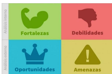
Imagen 2. Análisis DAFO