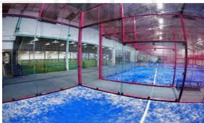
Imagen 1. Las Instalaciones deportivas.