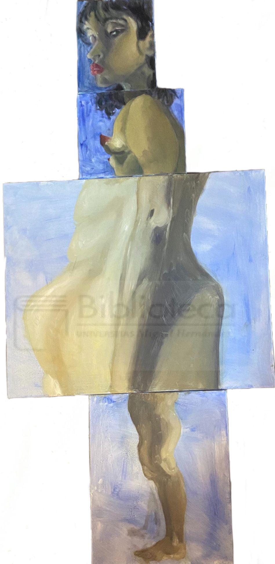
Angie Cusme: El cuerpo dismorfico. Una realidad distorsionada (2021), pintura, 1'58 x 0'73m, lado derecho