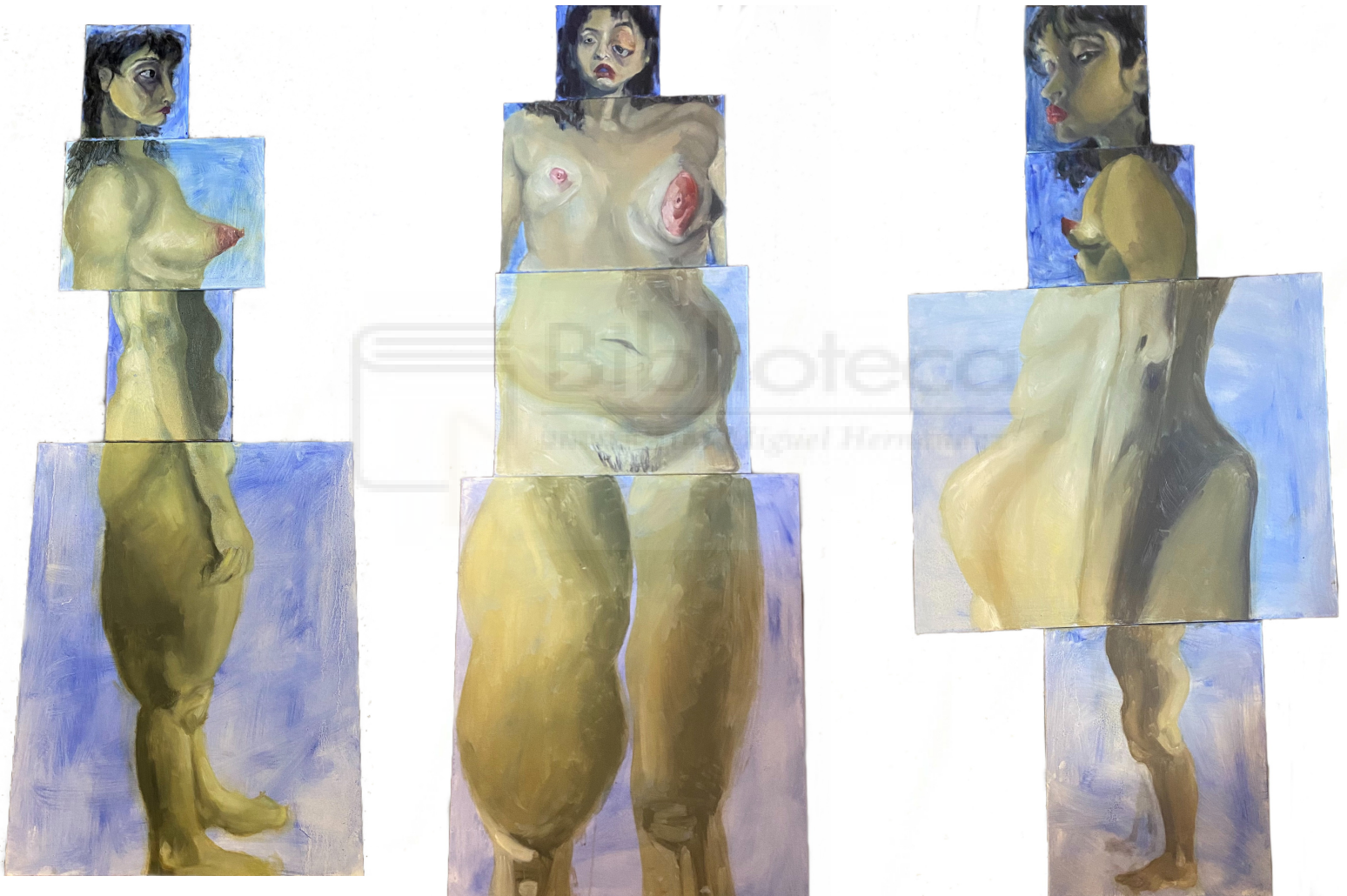
Angie Cusme: El cuerpo dismorfico. Una realidad distorsionada (2021), pintura