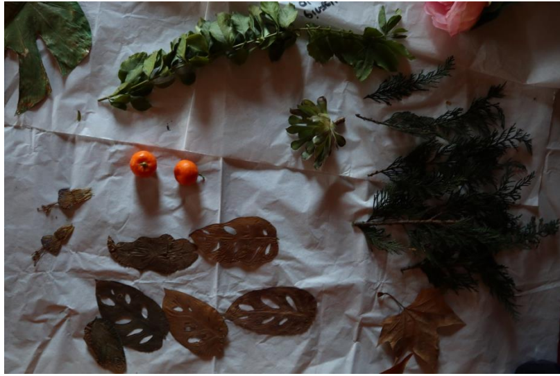
Fig.5. Recolección de materiales

Seguidamente, la elección de las posibles paletas de colores, y los elementos vegetales en función de cada obra, y las pruebas de registro de tales elementos en papel, para observar la huella que dejan y decidir la mejor forma de registrarlos sobre la obra. 5