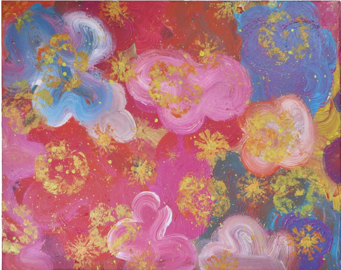
Fig. 9. Sara Almarche. Un jardín propio. El abstraccionismo orgánico como modo de expresión (2021). Acrílico sobre lienzo, 65 x 80 cm.

Las imágenes pictóricas resultantes son fruto de una búsqueda de la armonía, en los colores, la composición, las formas, permitiendo así al espectador adentrarse en esa imaginación y memoria en dónde la naturaleza y los jardines están presentes.