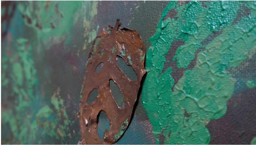
Fig. 7. Proceso de registro de un elemento orgánico sobre el lienzo.

Dejándose llevar por los sentidos, sin importar el resultado, simplemente la artista y el trazo que le acompaña, y con este propósito, añade los registros de los elementos vegetales en el lienzo, que crean unas formas orgánicas, que dotan a las obras de esos detalles macro y micro.