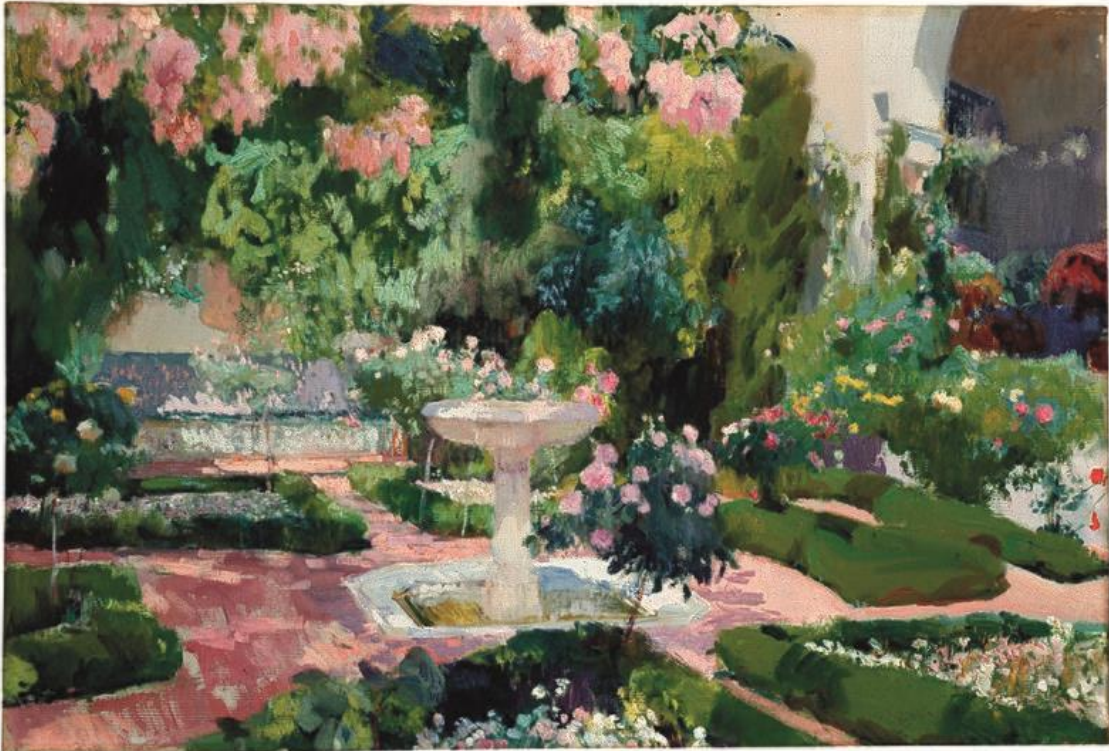
Fig. 1. Joaquín Sorolla. Jardín de la Casa Sorolla (1918-19). Óleo sobre lienzo.

Finalmente, Joaquín Sorolla; su jardín de artista y la influencia de otros jardines que visitaba para la creación de sus cuadros.