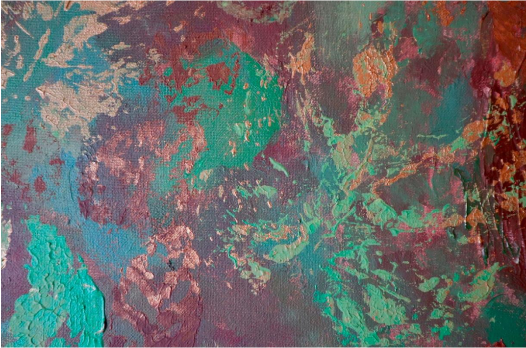
Fig. 15. Sara Almarche. Un jardín propio. El abstraccionismo orgánico como modo de expresión (2021). Detalle de las piezas finales.