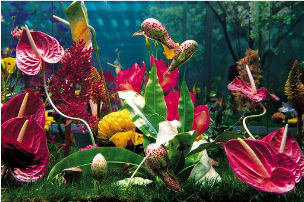
Fig.2. Marc Quinn. Garden (2000), cámara fría, acero inoxidable, vidrio, espejos, tanque acrílico, césped, plantas.

Para mí, el jardín se trata de deseo, se trata de que todas las flores del mundo surjan al mismo tiempo, en el mismo lugar, una idea de un paraíso perfecto. Quería que también tratara sobre la manipulación de la naturaleza. Ya no existe la naturaleza. Ahora todo es cultura. Cada paisaje que ves es un paisaje manipulado, cada flor ha sido modificada genéticamente a través de la reproducción para que sea como es, por lo que estas imágenes son sobre The Garden siendo construido, no cultivado, ese es un aspecto. 1