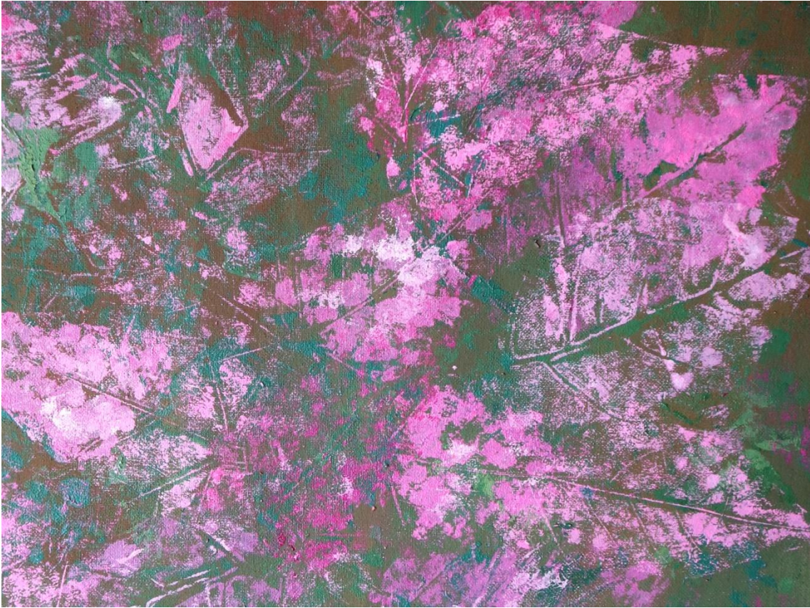
Fig. 12. Sara Almarche. Un jardín propio. El abstraccionismo orgánico como modo de expresión (2021). Detalle de las piezas finales.