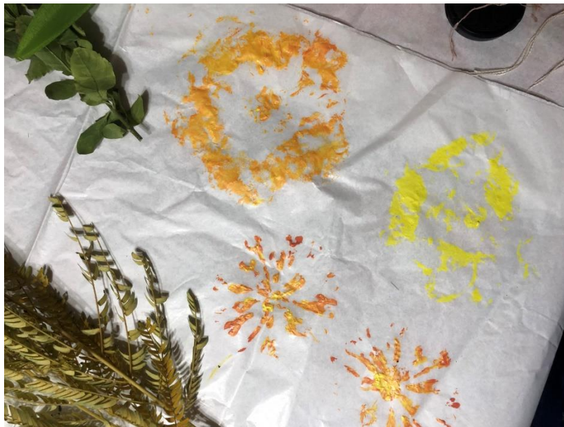
Fig. 6. Pruebas de registro.