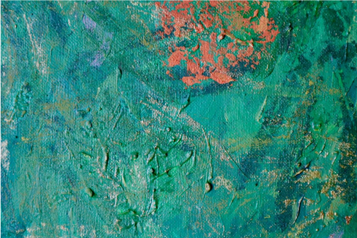
Fig. 13. Sara Almarche. Un jardín propio. El abstraccionismo orgánico como modo de expresión (2021). Detalle de las piezas finales.