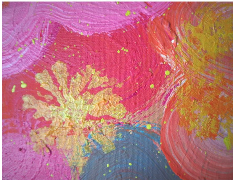
Fig. 10. Sara Almarche. Un jardín propio. El abstraccionismo orgánico como modo de expresión (2021), detalle de las piezas finales.