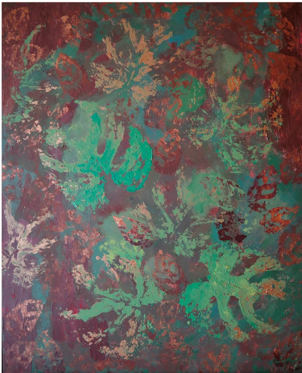
Fig. 14. Sara Almarche. Un jardín propio. El abstraccionismo orgánico como modo de expresión (2021). Acrílico sobre lienzo, 65 x 80 cm.