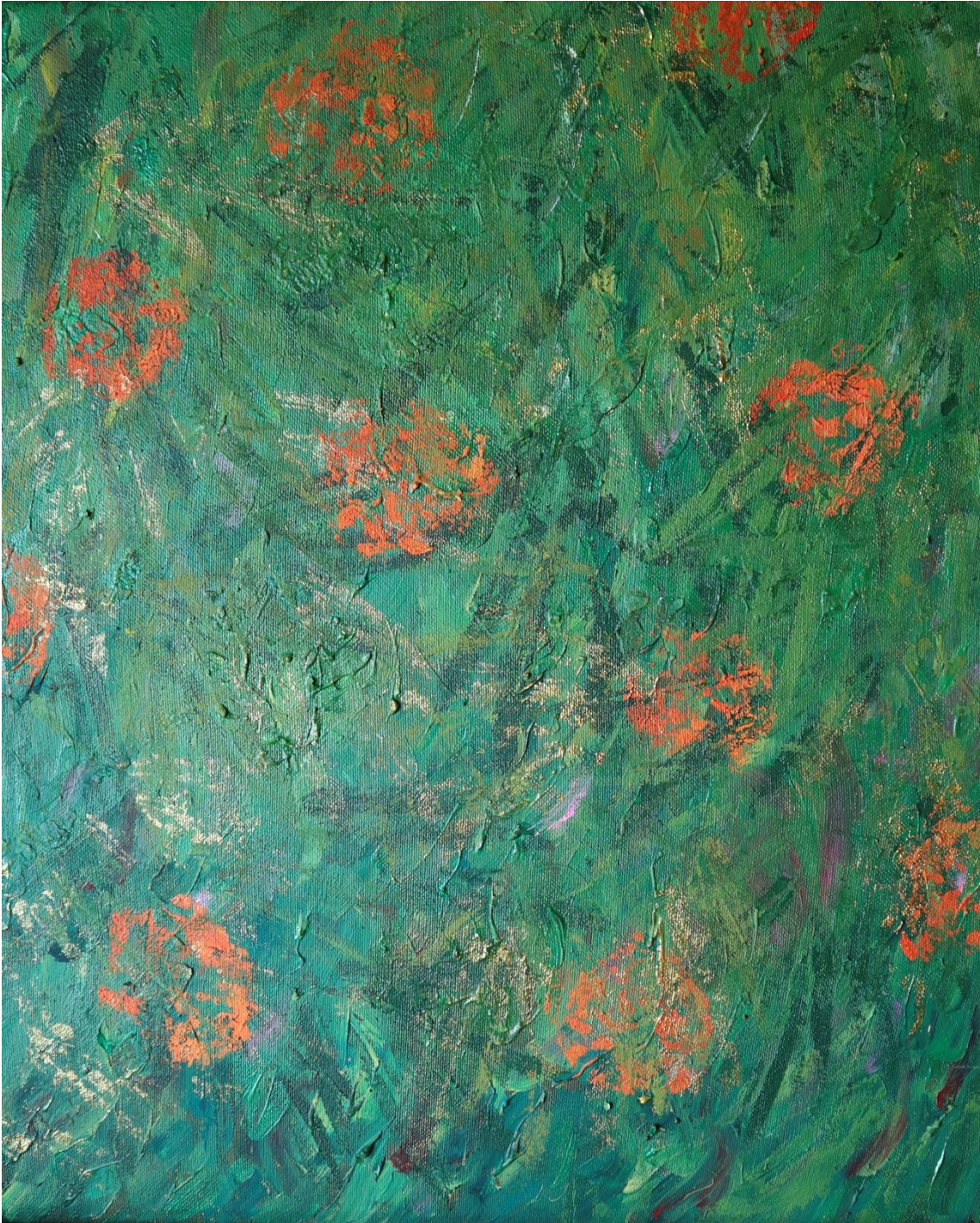
Fig. 12. Sara Almarche. Un jardín propio. El abstraccionismo orgánico como modo de expresión (2021). Acrílico sobre lienzo, 46 x 55 cm.