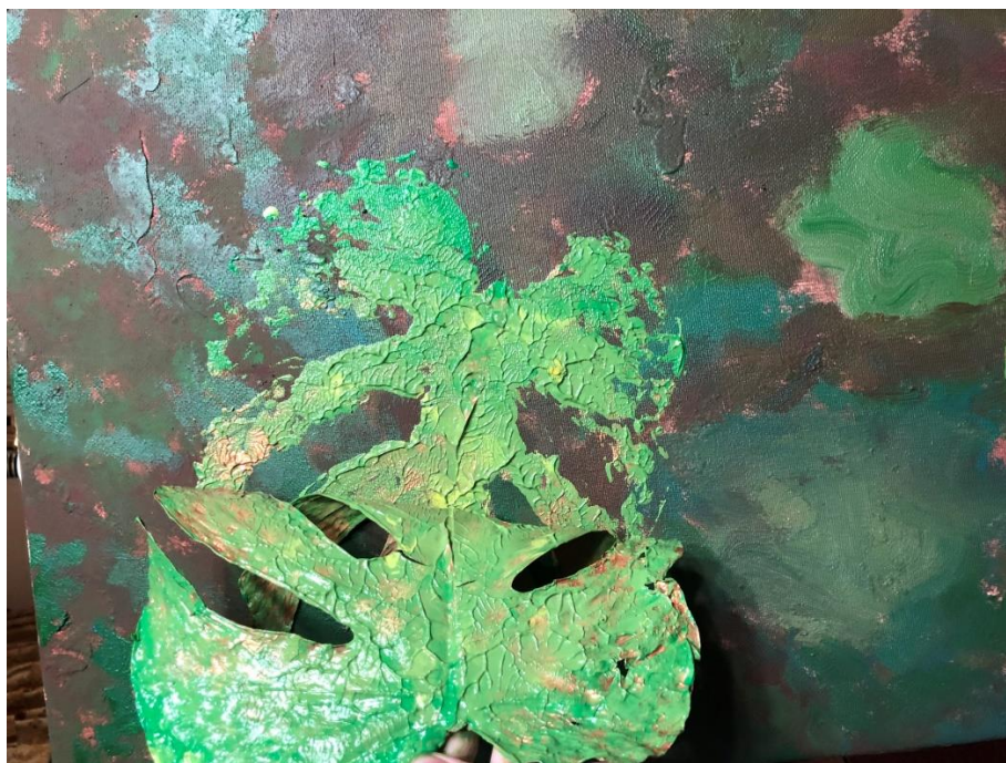
Fig. 8. Proceso de registro de un elemento orgánico sobre el lienzo.