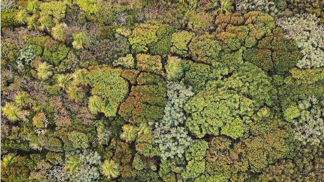
Fig.3. Fotograma de Forest Therapy (2019), Dimitar Karanikolov, grabación aérea.

Forest Therapy (2019) 2 es una obra de Dimitar Karanikolov, fotógrafo y creador de contenido online. Esta obra es una grabación aérea de un bosque Mexicano, que como el nombre indica, muy terapéutica por el momento multisensorial al que te induce observarla.