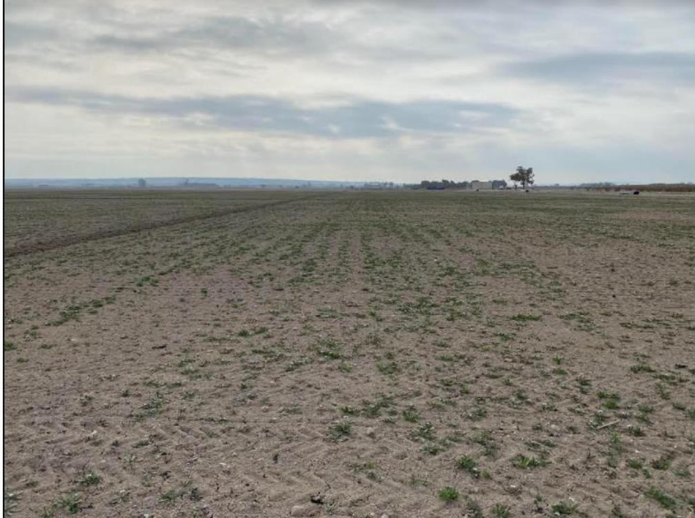
Figura 5. Suelo sometido a laboreo convencional, uso de herbicidas y actualmente cambiando el cultivo. Elche, Alicante. Fotografía de J. Mataix-Solera, 2021.