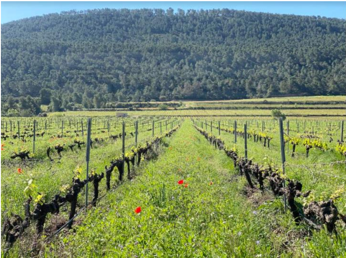
Figura 7. Viñedo en cultivo ecológico con aporte de estiércol, laboreo mínimo, y mantenimiento de cubierta vegetal en Moixent, Valencia. Fotografía de J. Mataix-Solera, 2021

de poda, puede existir un riesgo ambiental, ya que estos residuos pueden actuar como reservorios de hongos, patógenos, insectos y termitas. Por ello, se recomienda evitar el uso de residuos de poda como enmienda del suelo cuando se sospeche una posible infección por algún tipo de patógeno (García-Orenes et al., 2016). La aplicación de residuos orgánicos favorece un aumento del contenido de materia orgánica en el suelo, mejora la estructura y aumenta la biomasa microbiana y la actividad en los suelos. Esta práctica también cambia las comunidades microbianas para responder a los aumentos en el carbono orgánico. Sin embargo, la aplicación repetida de estiércol puede presentar riesgos ambientales, ya que introducen flora microbiana exógena en el suelo y tienen el potencial de alterar la estructura microbiana endógena (García-Orenes et al., 2013).