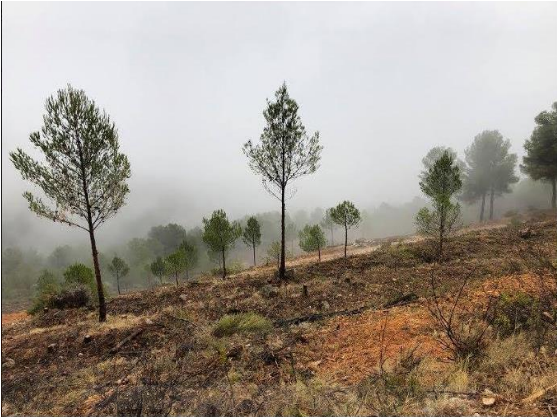
Figura 2. Ejemplo de clareo en Sierra de Mariola (Alicante). Foto de J. Mataix-Solera, 2017.