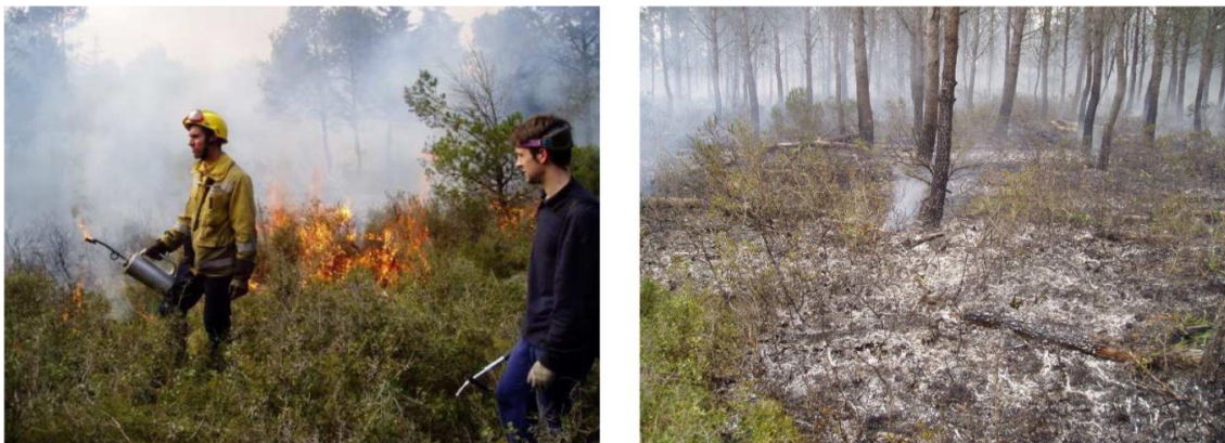
Figura 3. Tratamiento silvícola (quema prescrita).

cambios en las propiedades químicas o físicas del suelo. Las quemas pueden ser perjudiciales para la comunidad biótica, particularmente cuando se aplica repetidamente en la misma área. Sin embargo, cuando la quema se encuentra dentro de ciertas prescripciones (bajas temperaturas o alto contenido de humedad del suelo) los efectos en la biota del suelo son mucho más suaves (Catalanotti et al., 2018).