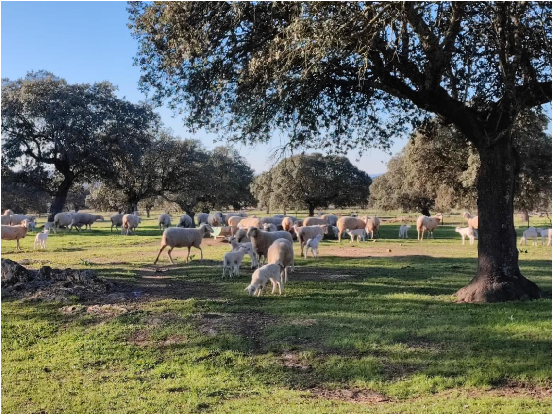
Figura 4. Suelo con uso de pastoreo.

con un aumento en el suministro de carbono del suelo, lo que, a su vez, aumenta la biomasa microbiana edáfica y su actividad (Bardgett et al., 2001).