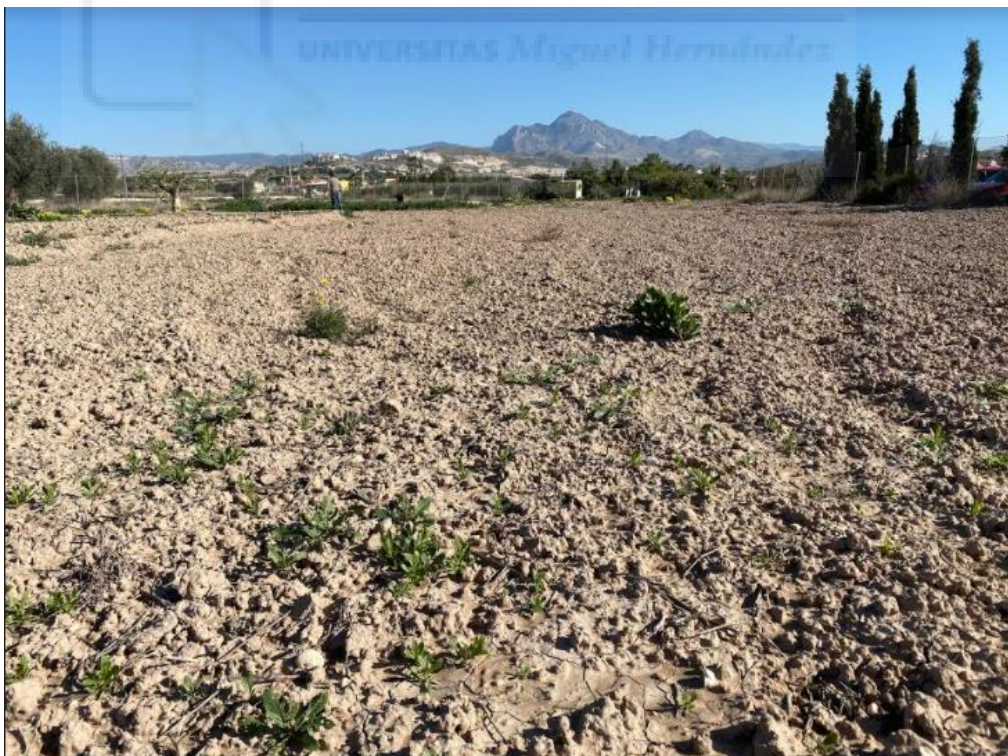
Figura 6. Suelo sometido a laboreo convencional, uso de herbicidas y actualmente sin cultivo en el que se puede apreciar encostramiento y sellado superficial. Mutxamel, Alicante.