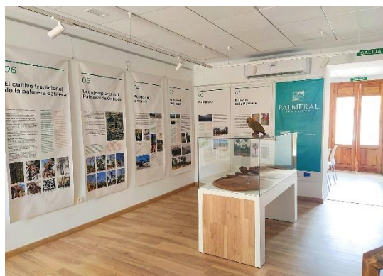
Fig. 10 y 11. Aspecto exterior e interior del nuevo Centro de Interpretación del Palmeral de Orihuela, creado en 2020 mediante fondos FEDER CV, que han permitido restaurar la denominada “Casa de los Verdú”, inmueble que se encontraba en estado de ruina.

Se ha realizado el reacondicionamiento de infraestructuras en mal estado y la recuperación de un sistema de regadío de gran importancia para la gestión diaria del Palmeral. Este sistema, es herencia del gran conocimiento de la hidráulica y gestión del agua de la cultura árabe ya que durante su asentamiento entre los siglos VII-IX crearon una gran red de riego y conducciones, así como terrazas de cultivo que se adaptaban a cualquier orografía.