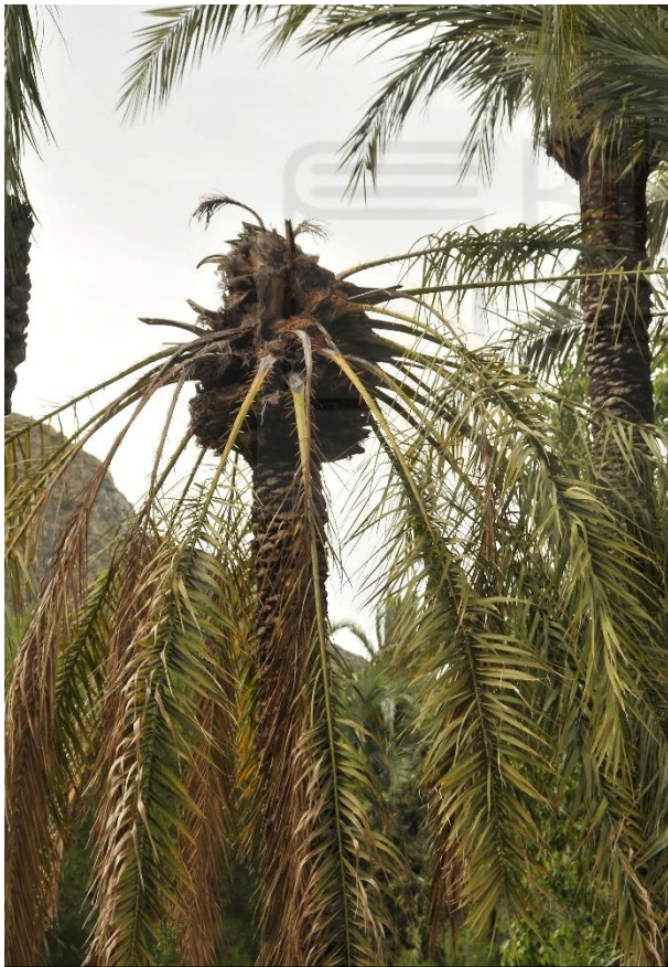
Fig. 7. Palmera prácticamente muerta por daños provocados por las larvas de picudo rojo en 2017.