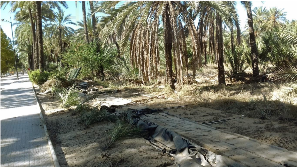
Fig. 4. Daños producidos por la avenida de agua de la DANA 2019 junto a la avenida Doctor García Rogel donde se aprecian muros derribados, palmeras volcadas y materiales de arrastre de la Rambla de Abanilla.