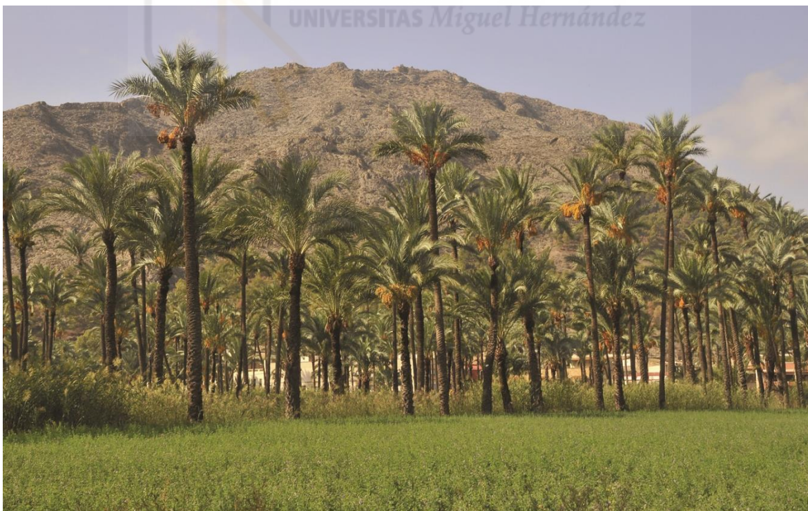
Fig. 2. Aspecto del Palmeral de Orihuela en 2017 con cultivos herbáceos de alfalfa en las proximidades del Monte de San Miguel. (Foto: G. Escudero).

Actualmente se trata de un enclave transitado, conocido y valorado por la población general, estableciéndose un fuerte vínculo entre las personas, el palmeral y el medio paisajístico donde se desarrollan sus actividades, pero que sin embargo en 2019 se encontraba en una situación límite que debía afrontarse con una política decidida que contara con los medios apropiados y suficientes.