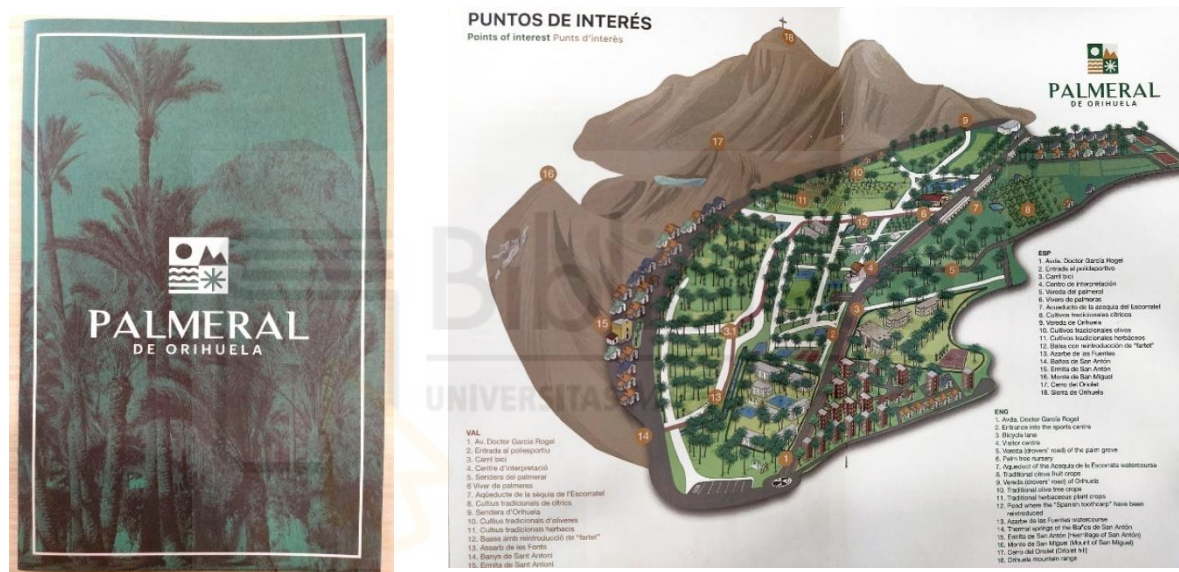
Fig. 12. Folleto dedicado al palmeral, editado en varios idiomas, disponible en el Centro de Interpretación del Palmeral de Orihuela. (Fuente: concejalía de Medio Ambiente).

Por último, se han editado folletos divulgativos en castellano, valenciano e inglés, donde se explican los aspectos más importantes relacionados con el Palmeral, planos de ubicación y rutas de interés para el senderista. Se ha creado una página web ( palmeraldeorihuela.com ) desde donde se pueden reservar visitas al centro de interpretación y solicitar visitas guiadas por el interior del Palmeral y como ya se ha indicado, se ha dotado de contenido mediante las salas de exposiciones, al Centro de Interpretación .