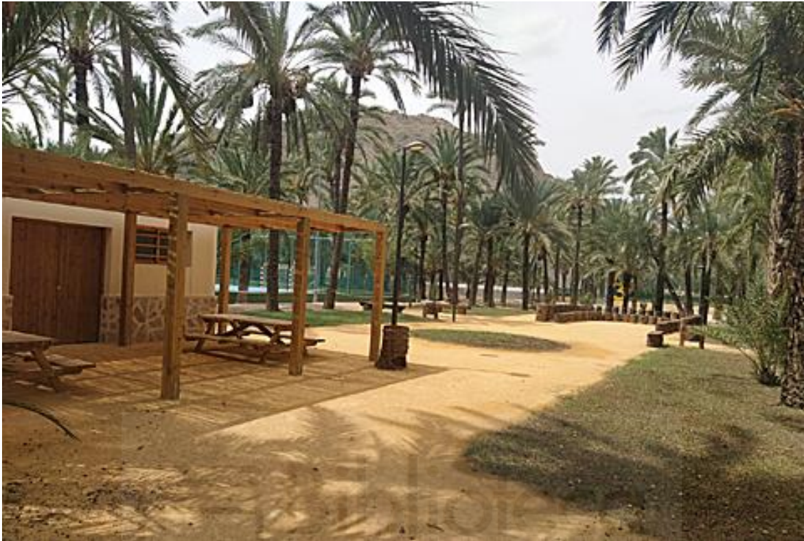
Fig. 18. Recuperación de una parcela que albergaba escombros y materiales de desecho para la creación de una zona estancial para el visitante del centro de interpretación. Al fondo se puede observar la disposición de asientos creados con tocones de palmeras y dispuestos a modo de anfiteatro para los escolares.