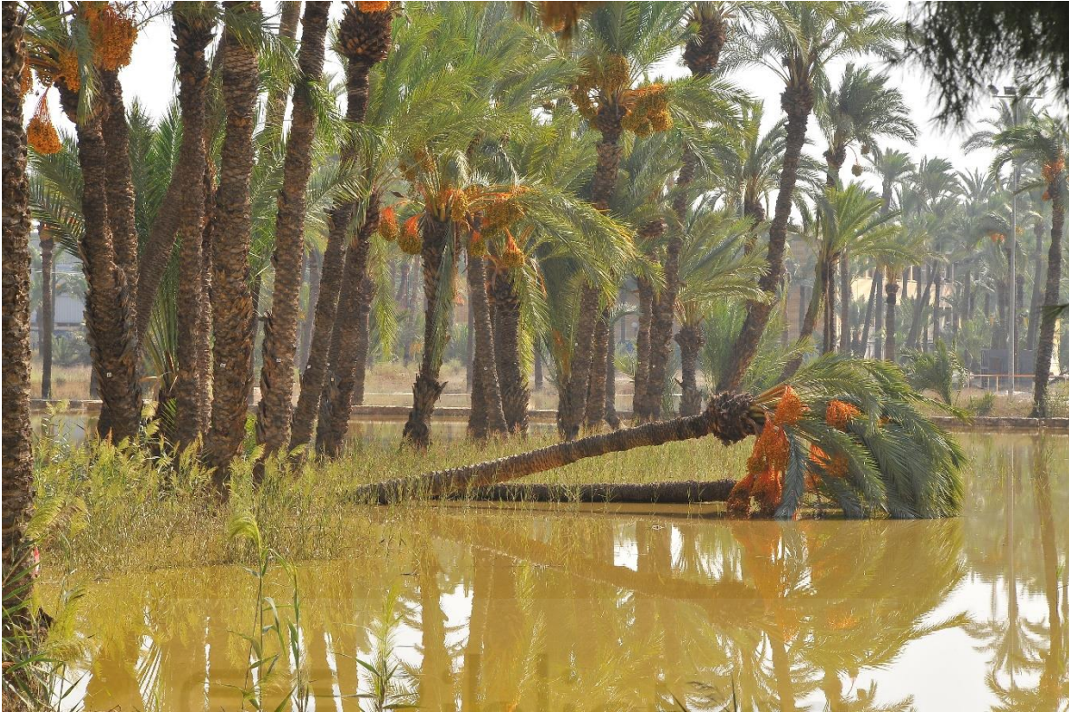
Fig. 3. Ejemplar de palmera datilera derribada por el temporal asociado a la DANA de 2019.