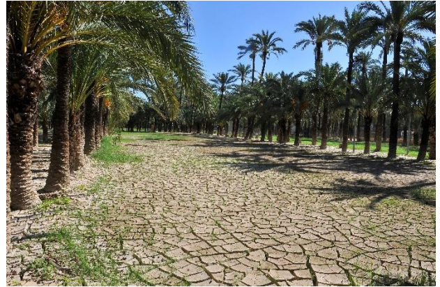
Fig. 5 y 6. Imágenes del palmeral inundado en el área del polideportivo municipal y la espesa capa de limos cuarteados tras su desecación. Estos limos inutilizaron caminos, pistas deportivas, conducciones de riego y otras infraestructuras.