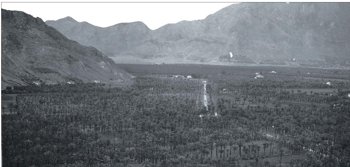
Fig. 1. El Palmeral de San Antón de Orihuela en 1910, (Foto: Andrés Fabert), procedente del expediente de declaración de Paraje Pintoresco de 1963, cedida por el Ministerio de Cultura.