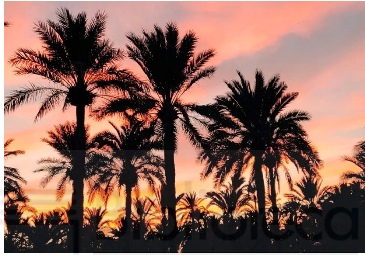
Fig. 19. Amanecer en el Palmeral de Orihuela en febrero de 2021.