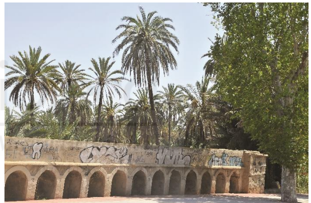
Fig. 8. Acueducto de la Escorrata en 2017 antes de su restauración.