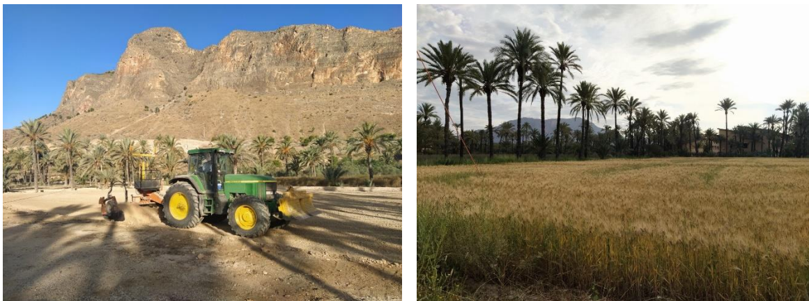
Fig. 16 y 17. Trabajos de labrado y siembra de cultivos de trigo como ejemplo de recuperación de las parcelas de agrícolas que caracterizan el agroecosistema del palmeral. (Fotos: G. Escudero).