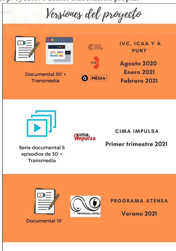
Figura 4. Versiones del proyecto.

De esta forma tenemos tres versiones del mismo relato audiovisual, como podemos ver en la figura 4: original en valenciano con un planteamiento que abarca el transmedia y la realización de un documental en profundidad para IVC, ICAA y À Punt Media; una serie documental para CIMA IMPULSA y un cortometraje más modesto para el programa ATENEA.