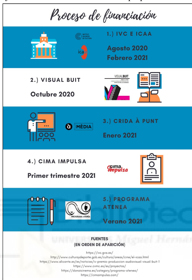
Figura 3. Proceso de financiación.

En definitiva, el proceso de obtener la financiación previa al desarrollo del audiovisual quedaría como podemos ver en la figura 3.