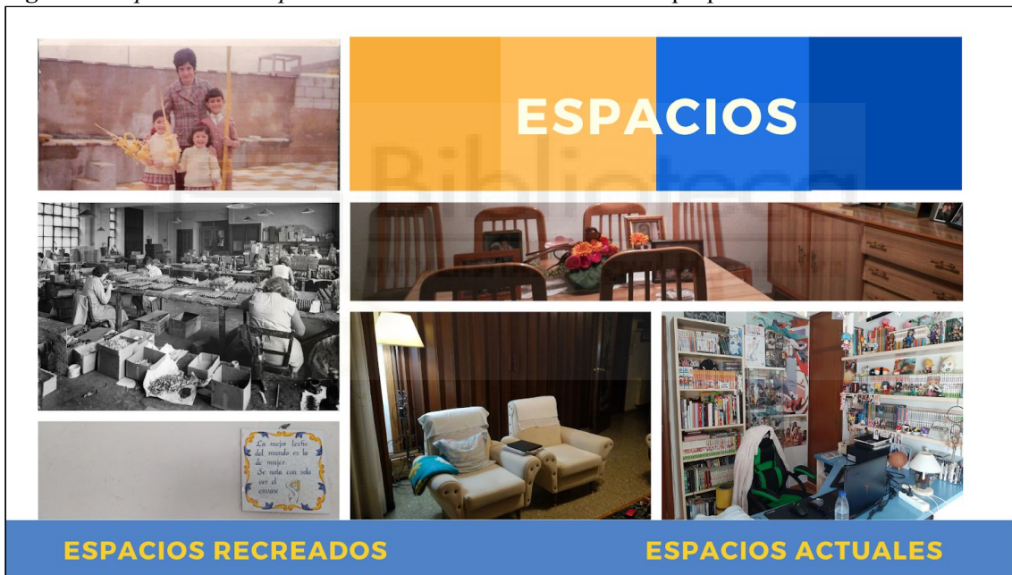
Figura 2. Espacios en Vesprada amb la iaia.

Con toda esta información se desarrolla el dossier que es uno de los documentos más importantes para ser beneficiado con una ayuda. No se ha de olvidar que se presenta un proyecto audiovisual y, como tal, la descripción mediante imágenes y un diseño acorde al producto que se desea elaborar ilustran y favorecen una percepción positiva por parte de los valoradores. El dossier del proyecto Vesprada amb la iaia se adjunta en el Anexo 2, planteado a doble idioma para las convocatorias del IVC y del ICAA. No obstante, hay que destacar que si se desea que el proyecto tenga como objetivo alcanzar un