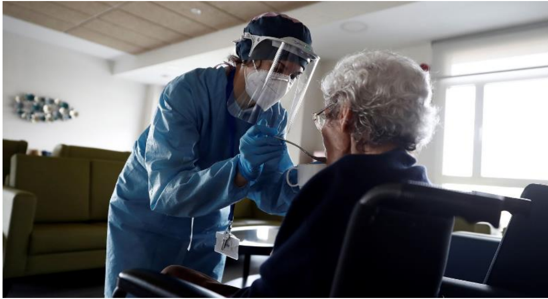
Imagen de la Noticia 2: “La Comunidad de Madrid envió al menos cuatro correos para excluir de hospitales a ancianos de residencias”.