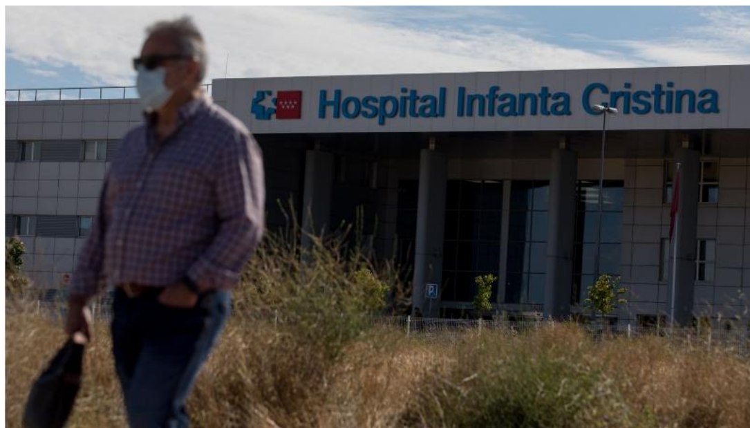
Imagen de la Noticia 3: "Vamos a denegar la cama a los pacientes que más riesgo de morir tienen".