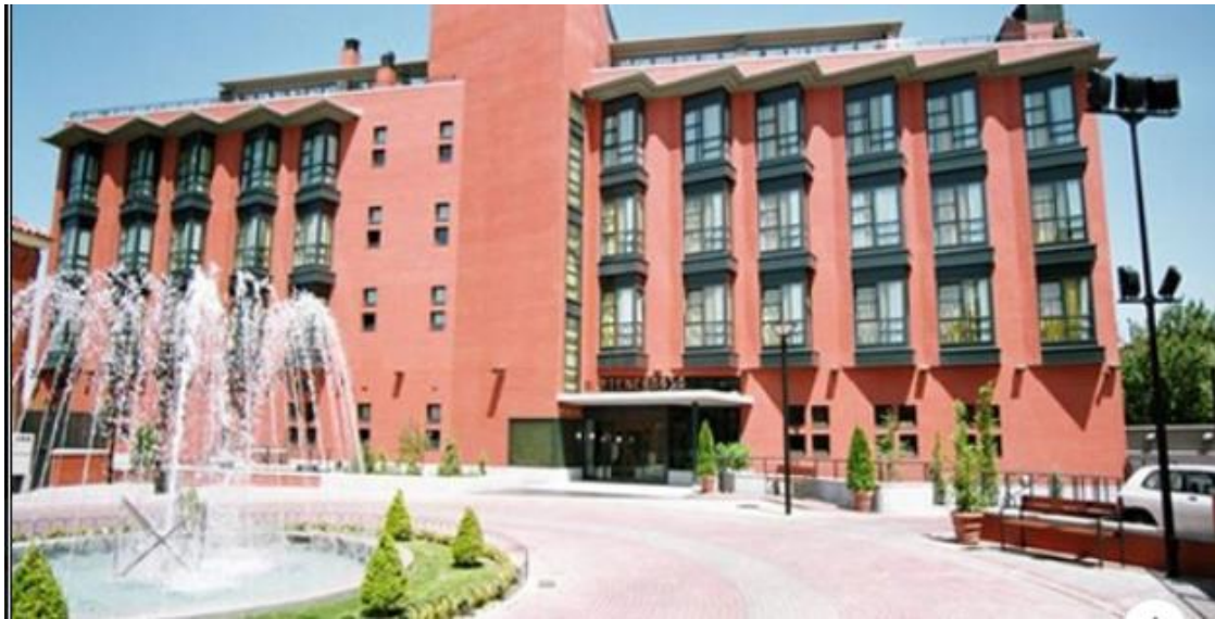
Imagen de la Noticia 4: “Al menos 19 muertos en una residencia de ancianos de Madrid por el brote de coronavirus”.