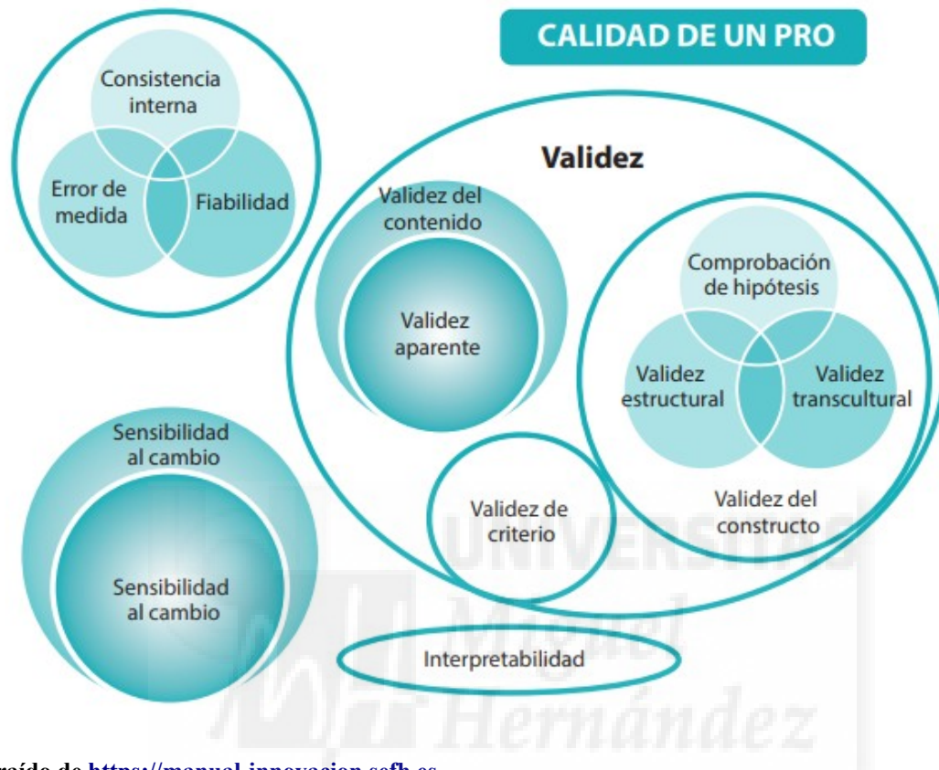
Figura 1. Taxonomía COSMIN (adaptada al español)