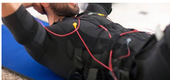
FIGURA 2: CHALECO DE EENM

Recientemente se ha estado hablando mucho sobre los chalecos de electroestimulación neuromuscular, tanto positivamente como negativamente. Si indagamos en las páginas webs de estos chalecos, se puede observar que venden el producto como si fuera el mejor tipo de entrenamiento posible (ganancias de fuerza, resistencia, potencia...o “activación simultánea de 350 músculos”) y difícilmente podemos acceder al apartado de contraindicaciones si es que incorporan ese apartado en sus webs. En el año 2013, Kemmler et al. llevaron a cabo un estudio en el que un grupo numeroso de mujeres de la tercera edad con osteoporosis entrenó con chalecos de estimulación eléctrica durante 54 semanas (figura 2). Los resultados fueron bastante positivos ya que aumentaron su masa muscular y su fuerza, lo cual es básico para evitar el desarrollo de la osteoporosis y la sarcopenia.