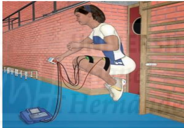
FIGURA 1 : USO SIMULTÁNEO DE EENM Y PLIOMETRÍA

En el ámbito de rendimiento deportivo, Maffiuletti et al.(2002) llevaron a cabo un programa de preparación física para jugadores de voleibol durante cuatro semanas que se basaba en contracciones involuntarias producidas por la EENM seguidos posteriormente por ejercicios pliométricos. Los resultados fueron muy positivos, aumentaron su fuerza en los extensores de rodilla y su salto vertical. No obstante, el autor de este estudio afirma que estas mejoras no se pueden atribuir únicamente a la EENM ya que quizás son debidas al entrenamiento pliométrico. En el estudio de Martínez-López et al.(2012) se organizaron tres grupos diferentes, el primero entrenó únicamente mediante pliometría, el segundo grupo hizo un entrenamiento pliométrico a la vez que recibían EENM (entrenamiento simultáneo) y el tercer grupo hizo una combinación de EENM seguido posteriormente por pliometría. Tras ocho semanas de entrenamiento, únicamente el segundo grupo mejoró el SJ, CMJ y DJ. En otro estudio de características similares (Benito E. et al.,2011), se llegó a la conclusión que el entrenamiento simultáneo de pliometría y EENM era lo más adecuado para mejorar en el sprint de 30 m. Por tanto, podríamos decir que el uso simultáneo de EENM y pliometría parece ser lo más indicado para mejorar la explosividad (figura 1).