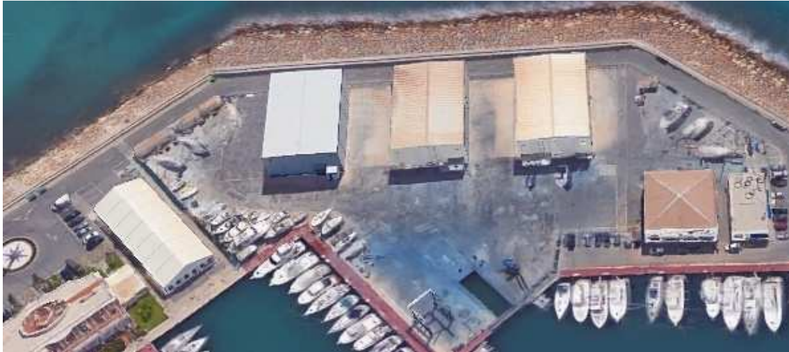
Varadero club náutico El Campello