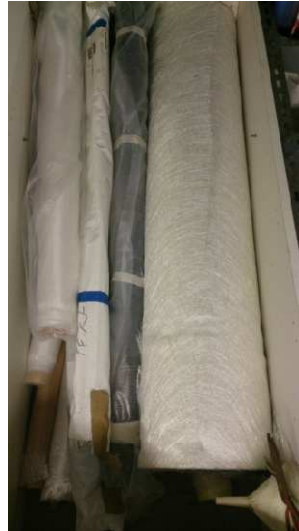
Almacenaje Fibra de vidrio, utilizada para reparación de embarcaciones