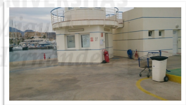
Gasolinera puerto de El Campello