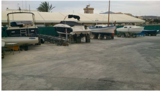
Varadero Club Náutico el Campello