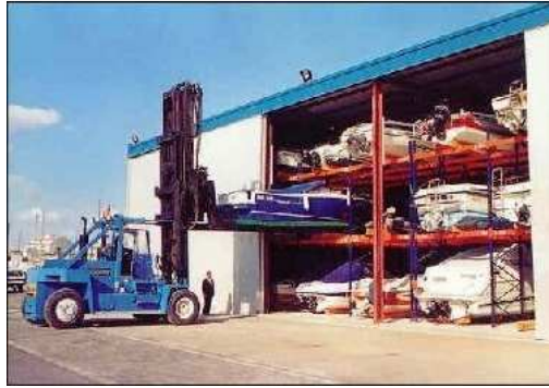
Marina seca club náutico el Campello

EL Club náutico cuenta con los siguientes servicios: