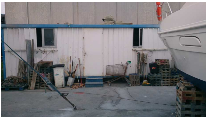
Almacén sustancia químicas.

natural o es producido, utilizado o vertido –incluido el vertido como residuo- en una actividad laboral, se haya elaborado o no de modo intencional y se haya comercializado o no, necesarios para la realización de los trabajos del puerto.