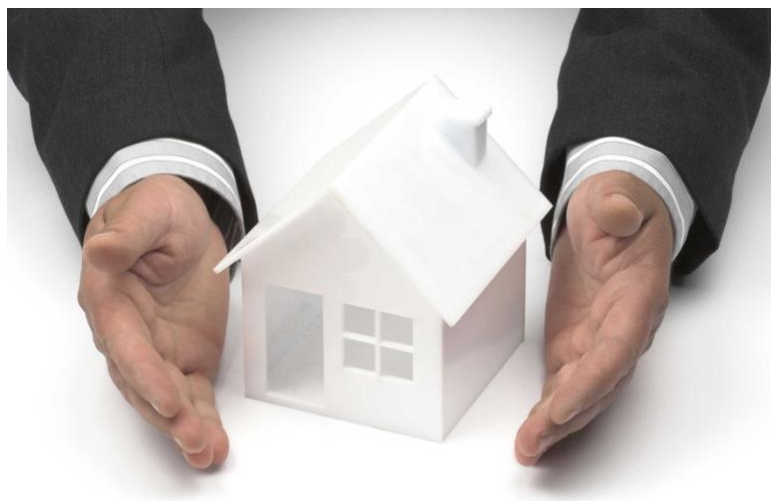
Imagen 1: Empresas Camaltec

Dicho de una forma más concreta, según la página web de la Seguridad Social y a los efectos del Régimen Especial de Trabajadores Autónomos, “se entiende como trabajador por cuenta propia o autónomo, aquel que realiza de forma habitual, personal y directa una actividad económica a título lucrativo, sin sujeción por ella a contrato de trabajo y aunque utilice el servicio remunerado de otras personas, sea o no titular de empresa individual o familiar.”