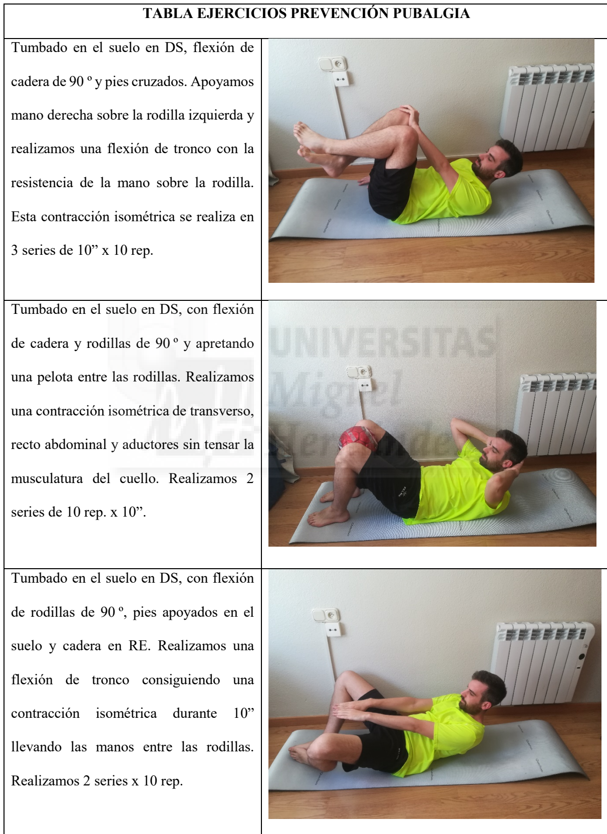
Tabla 1. Ejercicios para la prevención de la pubalgia