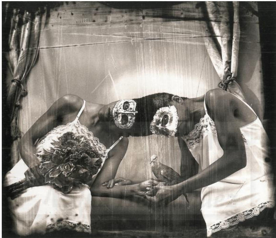
Fig. 2. Joel Peter Witkin. Siamese twins, New Mexico . 1980.

empleando colores vivos y sugerentes, hasta el punto de encontrar la belleza aparente, o esconder de forma tenue las emociones desagradables que nos producen. Imágenes como accidentes de coches o sillas eléctricas, son las que emplea para realizar su obra. “No creo en la muerte porque uno no está presente para saber que, en efecto, ha ocurrido” 5 . Warhol crea repeticiones de estas imágenes, consiguiendo no solo la contextualización de la imagen sino la pérdida del significado principal. Es así como Warhol alcanza a enfocar lo siniestro al mundo del arte, cubrir de belleza aquellas imágenes que nos crean ese horror o esa incertidumbre.