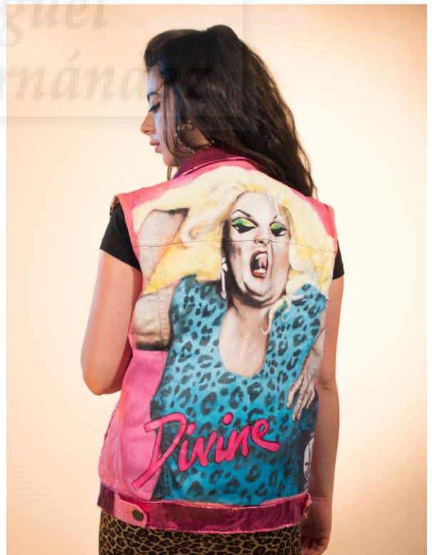
Figs. 9 y 10. Chaqueta Desierto rojo . Chaleco Divine .