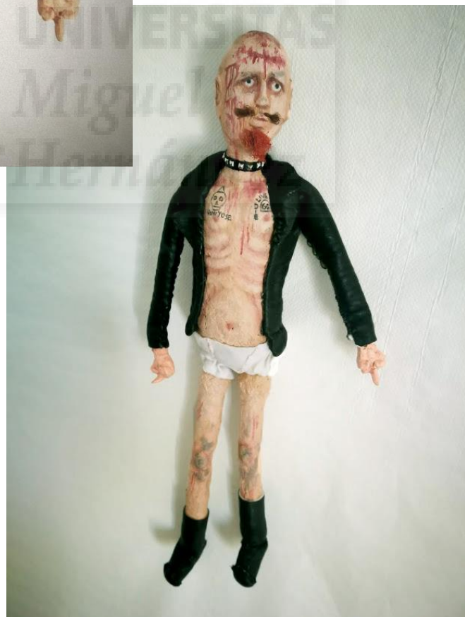
Fig. 23. Silvia Ponce. Serie Spit it out , #GG Allin. 2020. Fotografía sobre pared. 50x 15 x 6. Edición única. Ref.9435.