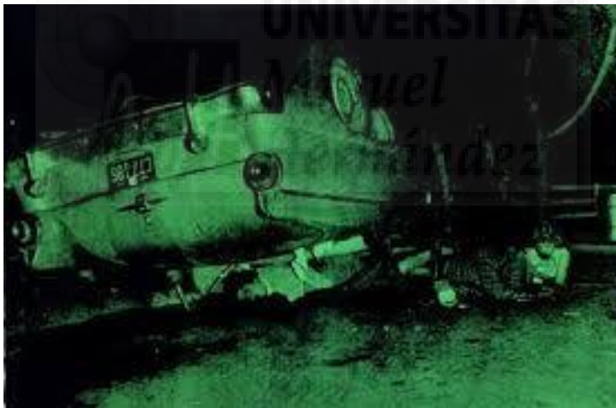
Fig.1. Andy Warhol. 5 Deaths . Serie “Death and Disaster” 1962-1963.

Umberto Eco en su libro Historia de la fealdad , 2007, muestra un mundo de horrores que queda fijado a lo largo del texto, donde aparecen obras siniestras, grotescas, macabras. Prodigios y monstruos, el infierno y las metamorfosis del diablo se entrecruzan con el triunfo de la muerte, la caricatura, el satanismo, lo siniestro y la fealdad industrial para acabar en la fealdad del mundo actual vista a través de lo kitsch, lo camp, el punk y el piercing que tanto recuerda los cuadros de El Bosco. Esta vibrante historia de horror y desprecio por lo feo está enriquecida por el lujoso tratamiento de las numerosas ilustraciones tomadas de la historia del arte y por la selección de textos de los autores más significados en el tratamiento de la fealdad. “La historia de la fealdad es decididamente más interesante que la historia de la belleza” 4 .