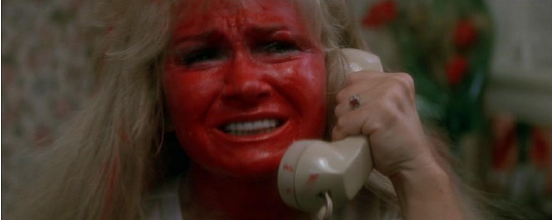
Fig. 3. David Lynch. Fotograma de Wild at Heart , 1990.

Para referirse al cine de David Lynch el mejor adjetivo es el de extraño y perturbador. Que no admite explicaciones ni racionalidades, porque se nutre de los sueños. Es una mirada al mundo que irrumpe en la realidad, para desenmascarar su apariencia más idílica, y conectarla con su lado más salvaje. Crea un cine del subconsciente en una celebración pagana de la ficción: “la muerte en mi mente no es una finalidad. Es como por la noche, que te vas a dormir y durante el día te despiertas, y es un nuevo día” 7 . En las obras de David Lynch se une la estética siniestra con la estética abyecta, según las definiciones de Bataille y Kristeva. Los argumentos y su trama narrativa son marcadamente siniestros, y su estética es decididamente abyecta. Un aliento de tragedia, brutalidad y desesperanza que recorren unas tramas cercanas al mundo literario del romanticismo negro.