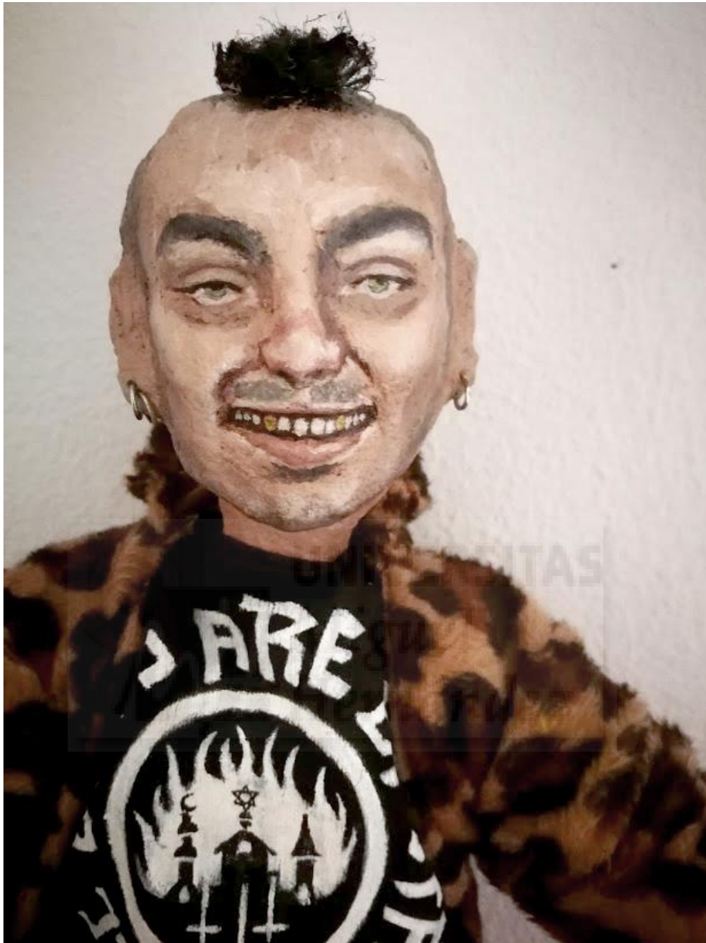
Fig. 19. Aplique de pelo.

Las caras se pintan con óleo, ya que al mantener la frescura más tiempo, da juego a hacer más detalles. Se usan colores verdosos, marrones y ocre, para obtener rostros de apariencia enferma. Los pinceles son finos para obtener mejores detalles, ya que se trata de hacer un realismo muy logrado.