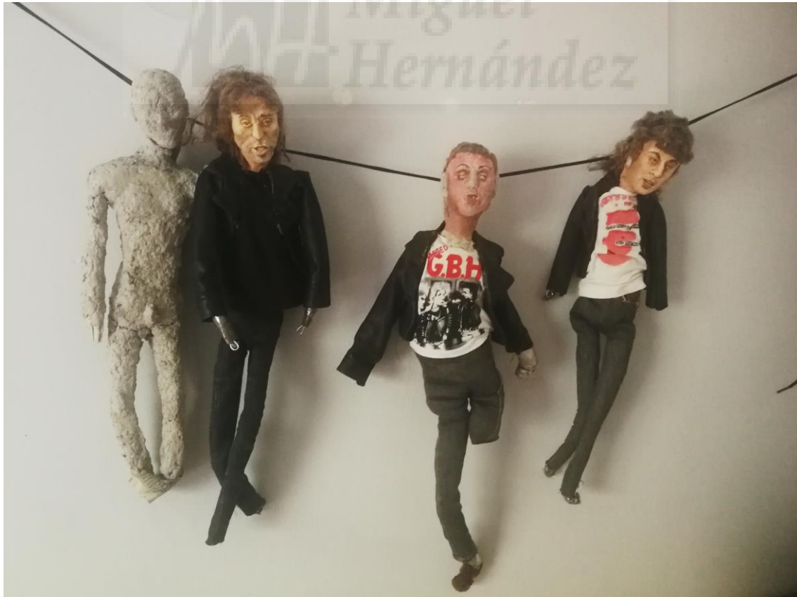
Fig. 27. Silvia Ponce. Serie Spit it out, #Destroy . 2020.