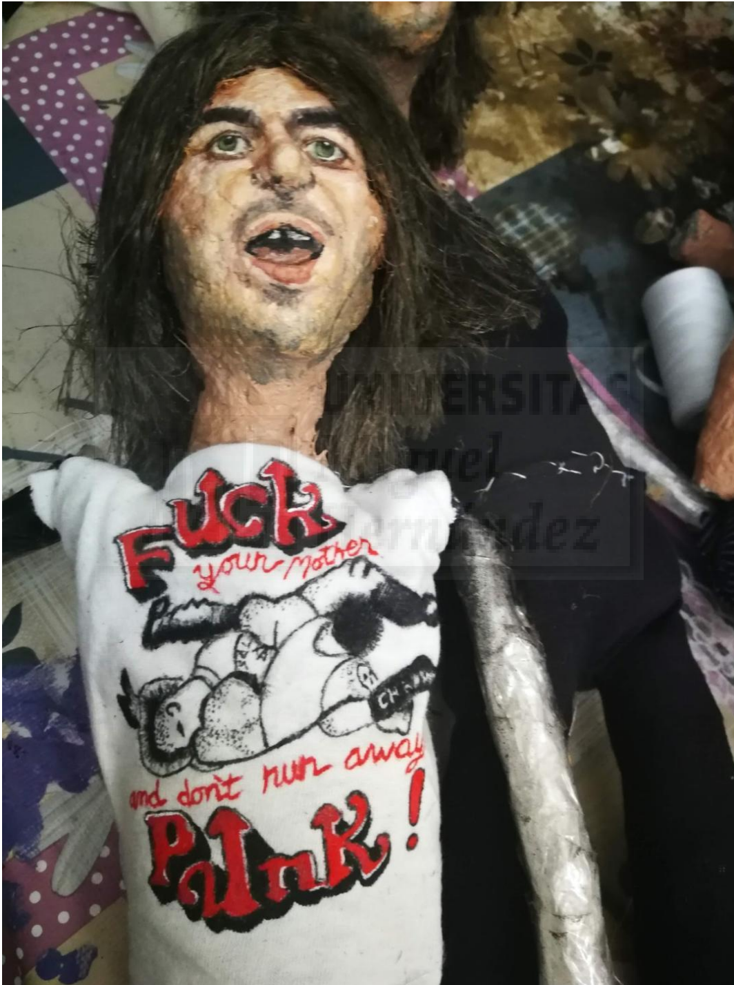
Fig. 18. Producción de ropa.

Más tarde se realiza la ropa. La tela se obtiene en rastros de segunda mano. Ya que la tela desgastada da una apariencia más tenebrosa y siniestra. Anteriormente la cosía directamente sobre el cuerpo de muñeco a mano, después empecé a hacer patrones y a realizar las piezas con una máquina de coser. Suelo trabajar con varios materiales distintos como cuero, látex y otros tejidos reciclados, de algodón, etc.