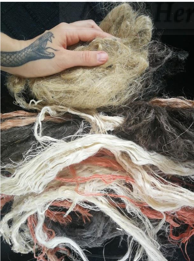
Fig. 16. Base cuerpos. Foto de la autora

El pelo se realiza con estopa. Se usan tintes para el cabello sin amoníaco para darle color o aclarar, ya que la estopa natural tiene un color bastante feo. A veces es necesario decolorar para que los tintes claros queden más potentes. También se puede teñir con tintes de ropa. Se hecha en una olla grande, añade una cucharada de sal de cocinar gruesa por cada litro de agua. La cantidad de tinte natural a utilizar para teñir estopa debe ser equivalente al peso del material. Es decir, por cada 100 gramos de estopa, por ejemplo, tendremos que incorporar 100 gramos de tinte.