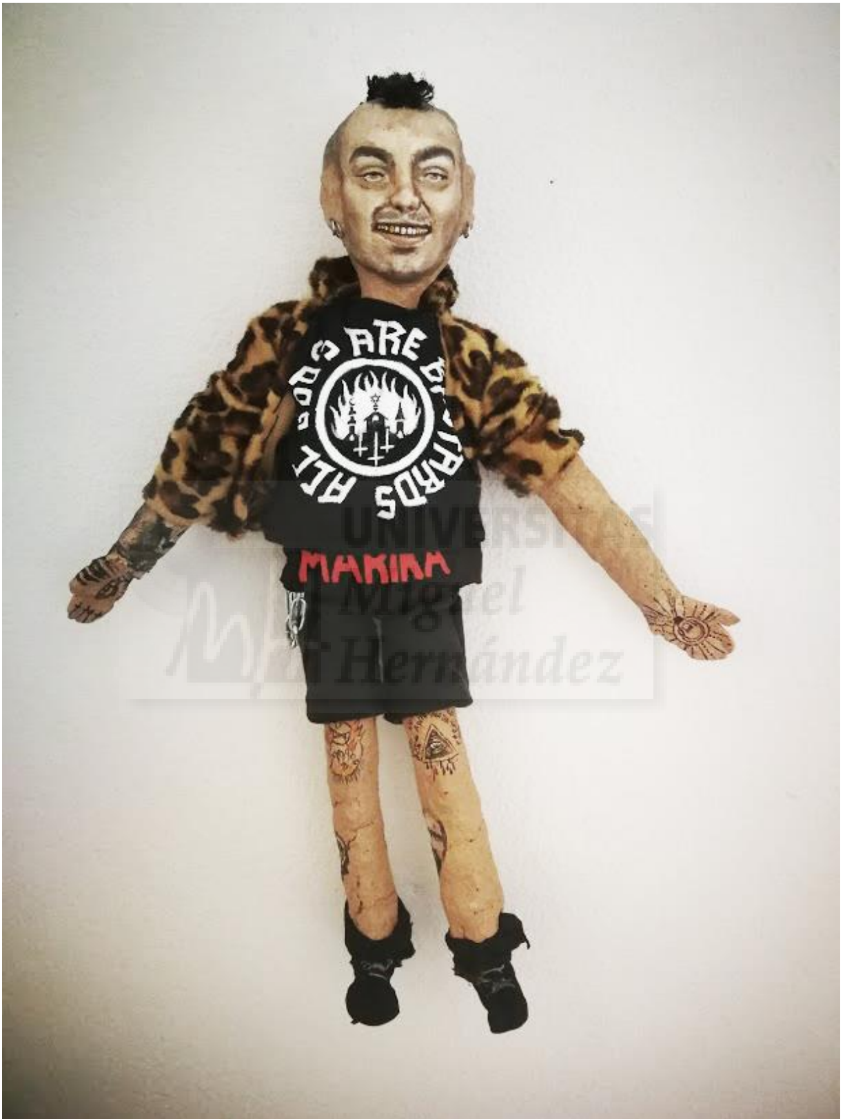
Fig. 21. Silvia Ponce. Serie Spit it out , #Mocho. 2020. Fotografía sobre pared. 50x14x7. Edición única. Ref.6457.