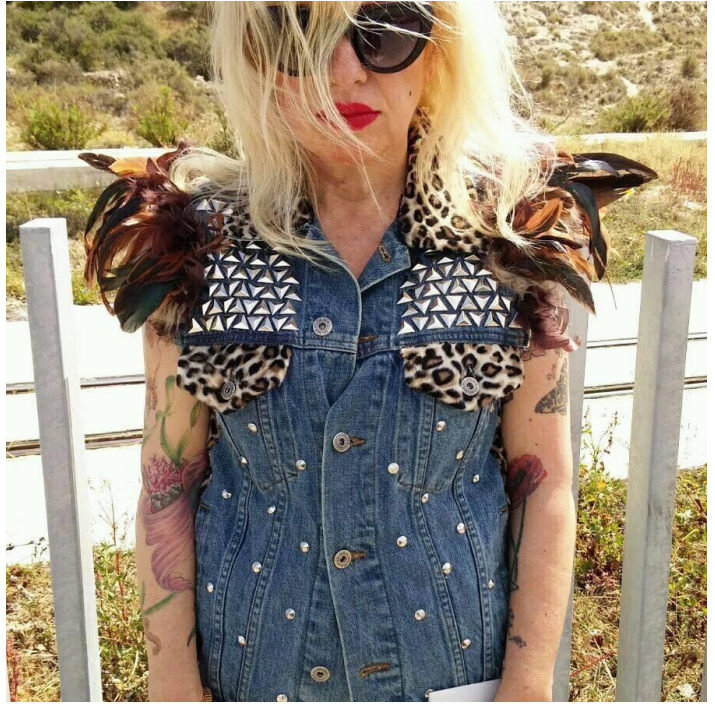
Figs. 8 y 9: Chaleco Savage . Chaleco Vampire .