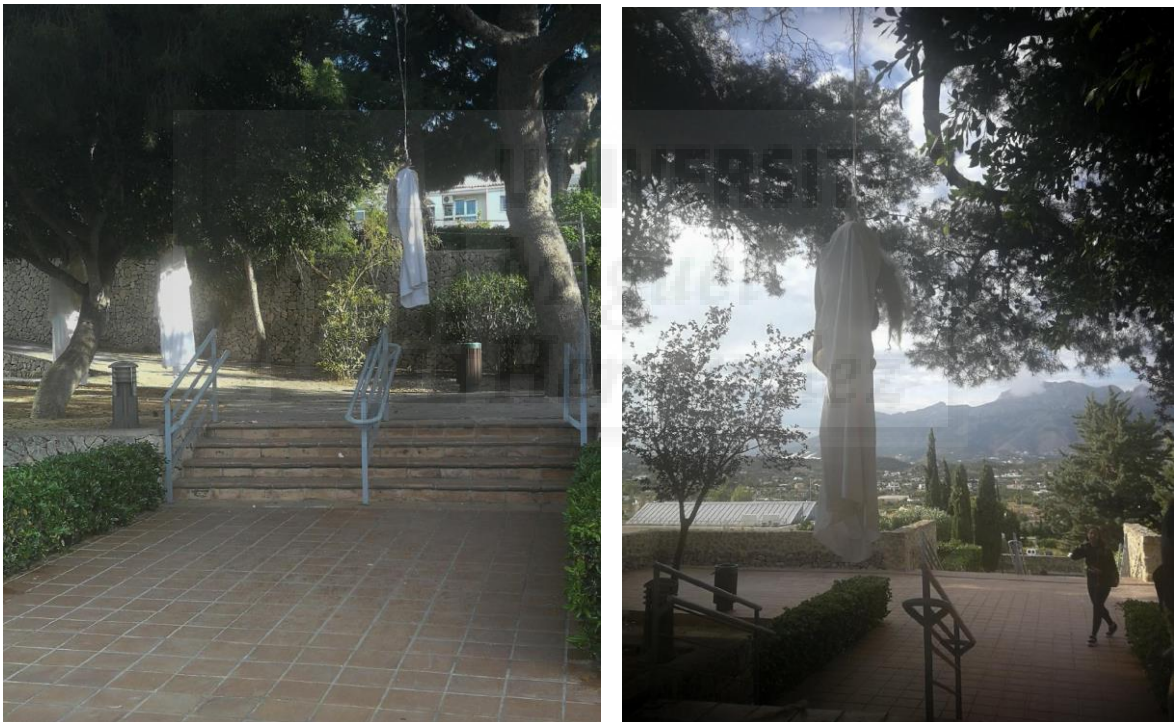
Figs. 11 y 12. Intervención Belleza efímera en Universidad de Bellas artes de Altea. 2019.

En trabajos anteriores de la asignatura de Instalaciones, realicé esta intervención, Belleza efímera , en un espacio abierto. El tema era el de la belleza efímera. El método de creación es la variación de películas como Las vírgenes suicidas de Sofia Coppola (1999) y El proyecto de la bruja de Blair de Myrrick y Sánchez (1999). Mi intención era la de crear un espacio en la naturaleza siniestro y violento. Los materiales fueron seleccionados por su carácter áspero y basto. Como la estopa y el acabado rugoso que se produce con el papel maché. Que dan a las piezas un aspecto bizarro, muy apropiado para la caracterización de figuras monstruosas. La experimentación con las piezas hechas con estos materiales y el procedimiento de la Instalación han sido determinantes en la creación de esta nueva propuesta.