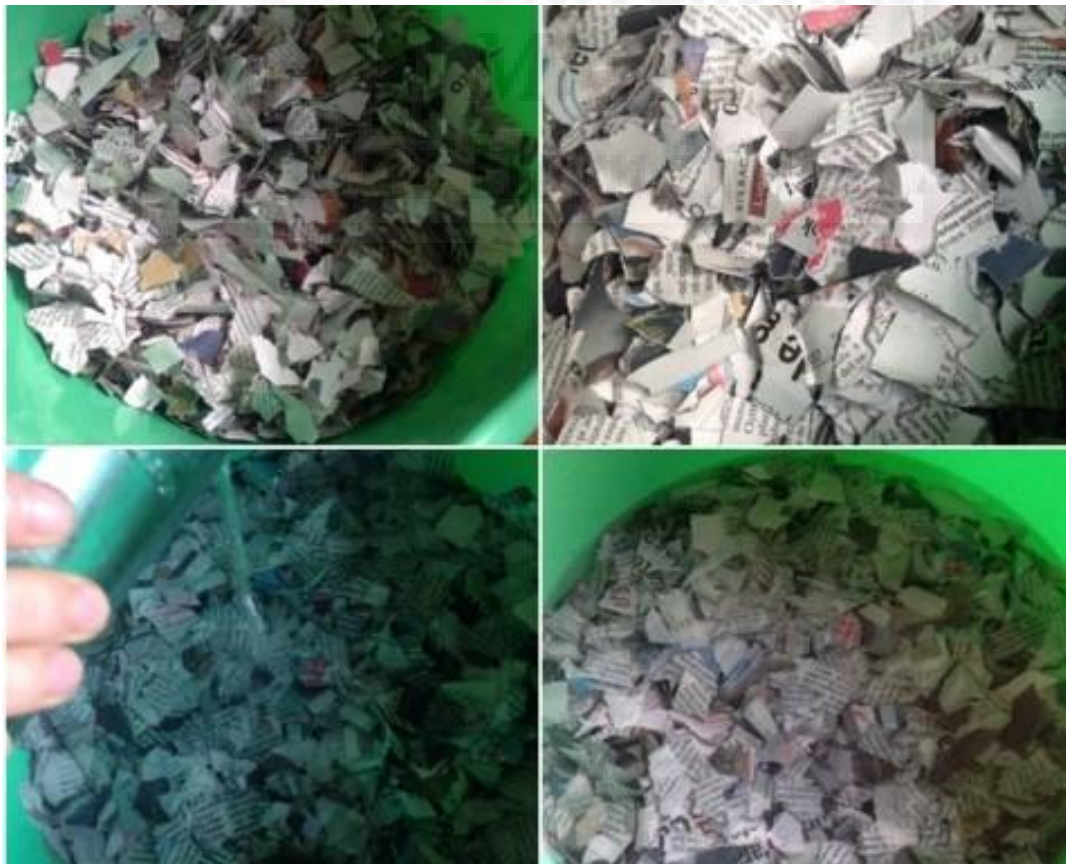
Fig. 13. Preparación papel maché.