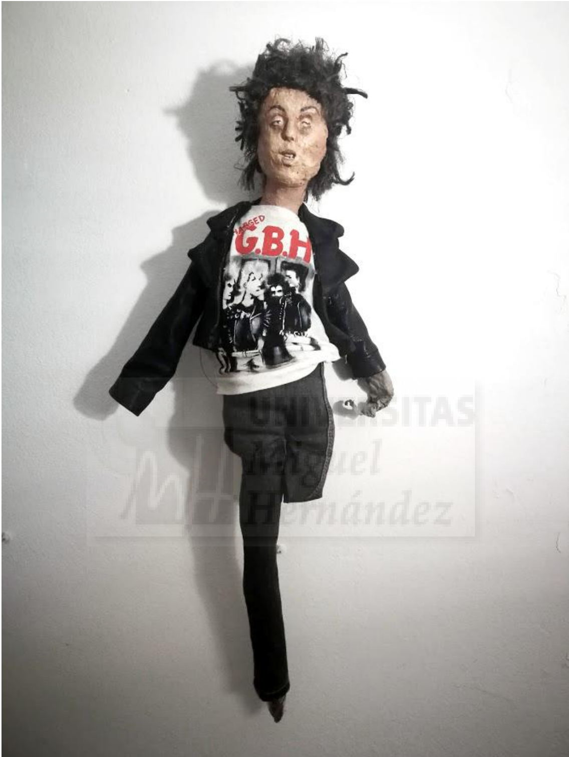
Fig. 24. Silvia Ponce. Serie Spit it out , #John Manteca. 2020. Fotografía sobre pared. 50x15x6. Edición única. Ref.3473.