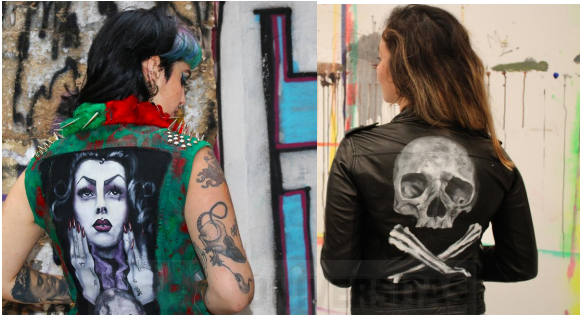
Figs. 5 y 6. Chaleco Absinthe . Chaqueta Niche .

Por eso mis piezas buscan sacudir visualmente al espectador, basándome en estos conceptos, lo siniestro, lo abyecto, lo grotesco y lo macabro. Con anterioridad a los muñecos de este proyecto, titulada Spit it out , realicé unas piezas de ropa de carácter siniestro. Se trata de chaquetas con ilustraciones pintadas a mano con apliques de metal y tachuelas de grandes dimensiones