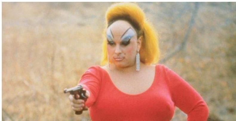
Fig. 7. John Waters. Fotograma de Pink Flamingos , 197

Están inspiradas en la ropa que vestían los miembros de las bandas de rock gótico, deathrock, y del black metal como CHISTIAN DEATH, THE DANCE SOCIETY, THE SELETAL FAMILY, THE MISSION, SUNGLASSES AFTER DARK, MORBID, BEHERIT y DARK THRONE. Aunque la más fuerte de las influencias ha sido el punk y post-punk como JOY DIVISION, BAH AUS, SIOUXSIE, OI POLLOI, FEAR, SUICIDAL TENDENCIES o MISFIST. Igualmente, los iconos del cine y series de terror y la subcultura trash , manga y anime son mis inspiraciones: DIVINE, VAMPIRA, FRANKENSTEIN, ETC.