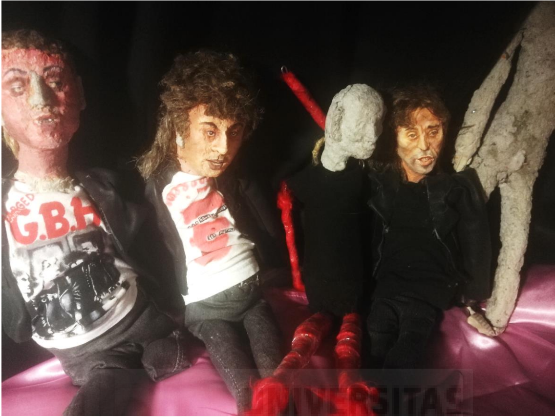
Figs. 28 y 29. Silvia Ponce. Serie Spit it out, #Destroy . 2020.