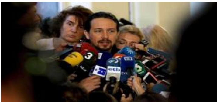
Figura nº1. Pablo Iglesias ante la prensa.

En primer lugar se explicarán los orígenes del partido político en las manifestaciones del 15M, en segundo lugar se va detallar la forma de comunicación a través de Internet y las redes sociales como: Twitter, Facebook o Youtube. Luego se tratará en el estado de la cuestión que es el estudio del tratamiento informativo de Podemos en los medios de comunicación generalistas tanto de prensa escrita como de prensa digital. A continuación se comentará la irrupción del partido político en las elecciones generales de diciembre del 2015 y junio del 2016, y cómo fueron tratadas por los medios de comunicación. Y por último se hablará sobre la actualidad del partido político y su posible fractura en un futuro.