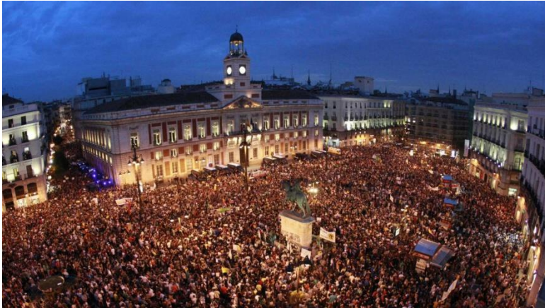
Figura nº2. Cinco años del 15-M. Fuente: Reuters/Sergio Pérez