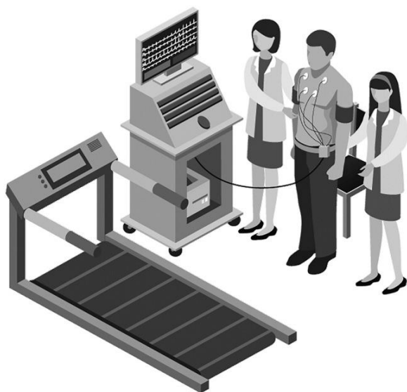
Figura 4. Prueba de cinta de correr 13

Un estudio reciente evaluó el valor diagnóstico de las pruebas de la cinta de correr (siguiendo el protocolo de bruce). Los sujetos inicialmente realizaban el ejercicio físico en la cinta de correr, acto seguido se procedía a reposo en bipedestación y un minuto después se administra nitroglicerina sublingual. Se observa ahora si el paciente sufre síntomas típicos del síncope o presíncope. 13