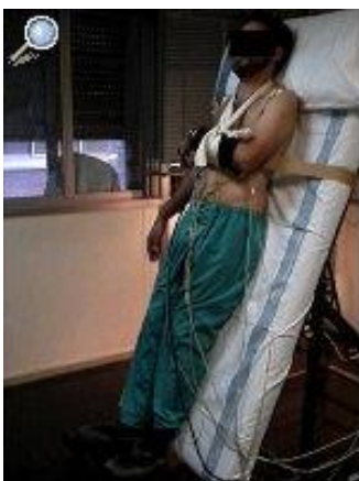
Figura3. Prueba mesa basculante 1

Esta prueba se usa desde 1986 como herramienta diagnóstica de síncope vasovagales. Además fue de gran utilidad para conocer la fisiopatología del síncope reflejo o neuromediado, comprobando los mecanismos del sistema nervioso central sobre el sistema nervioso autónomo, evaluando así la respuesta compensadora del corazón y del aparato circulatorio en respuesta a los cambios posturales y de presión arterial. 11