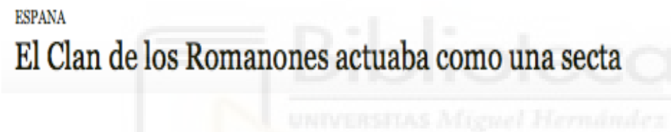
Figura 5: Titular de noticia publicado en ABC Diario ABC

En cuanto a la terminología empleada, un matiz a resaltar y que ejemplifica con este caso las teorías apuntadas en el marco teórico de la investigación, es la atribución en el contenido informativo del concepto “abuso de debilidad” por parte del padre Román hacia la víctima. Una vez más esta postura se refuerza y mantiene el problema en un marco de supremacía de poder, moral, jerárquico o social entre abusador y abusado. Para exponer dicho argumento la víctima declara alguna de las insinuaciones que recibió por parte del padre Román : "Soy tu padre, tienes que dejarte llevar, no vives bien tu sexualidad". El diario El Mundo publica citas con peso, productoras de grandes polémicas, como el subtítulo que escogió para una de sus noticias : “Once abusadores de niños están brindando ahora con champán”.