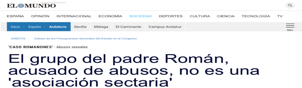
Figura 4: Titular de noticia publicado en El Mundo Diario El Mundo