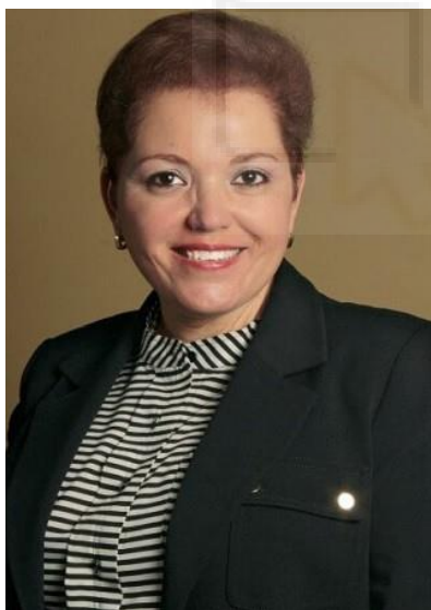
La periodista Miroslava Breach

En el primer semestre de 2018 han ocurrido 6 homicidios de periodistas en México. El último fue el de Héctor González Antonio, corresponsal del diario Excélsior, asesinado a golpes el 29 de mayo en Tamaulipas. El año 2017 fue el más mortífero con un repunte de 12 periodistas asesinados y 507 agresiones, según datos de Artículo 19. Entre ellos, 11 hombres y una mujer: Miroslava Breach. La impunidad de su asesinato ha sido reclamado a nivel internacional. Sin embargo, en México ha sido solo un número en la estadística de periodistas asesinados.