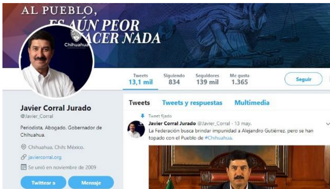
Red social del gobernador de Chihuahua, Javier Corral