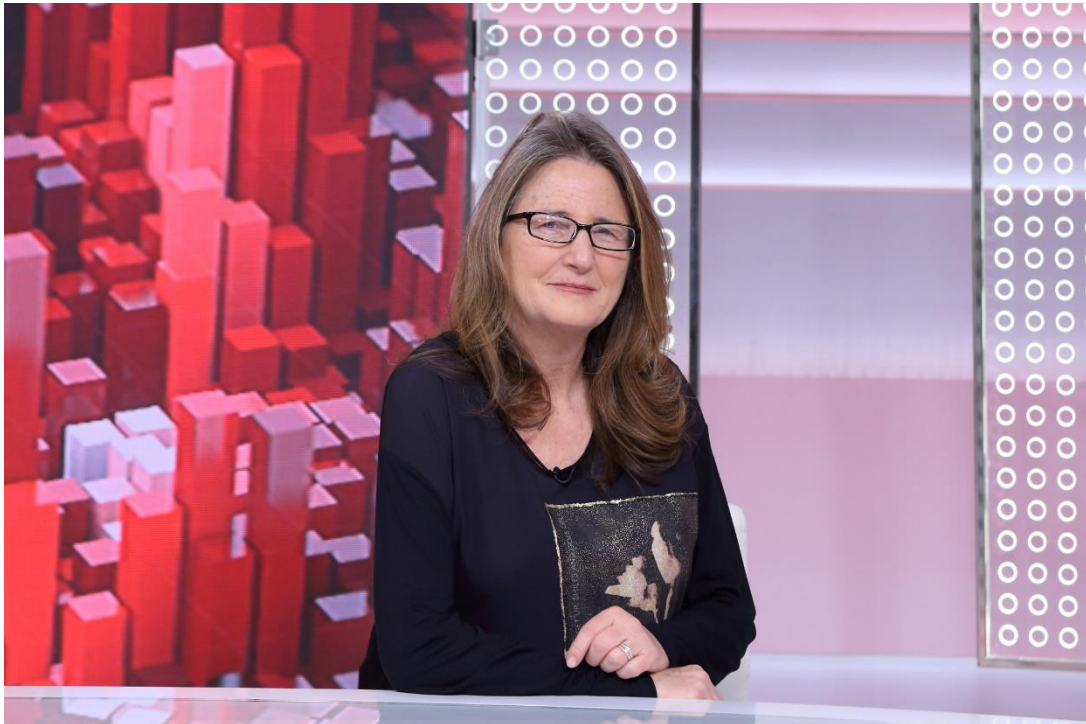
Chelo Alvarez-Stehle en el programa televisivo La tarde en 24 horas

México es el quinto país en trata de personas en el mundo. La periodista Chelo Alvarez-Stehle ha investigado este fenómeno a través del testimonio de las víctimas que componen sus escalofriantes documentales. Ella explica que el alto índice de trata en México se debe, en gran parte, a la emigración. Las jóvenes que se arriesgan a cruzar la frontera con el fin de encontrar una vida mejor se ponen en contacto con los coyotes que van a ayudarles a cruzar a cambio de altísimas cantidades de dinero.