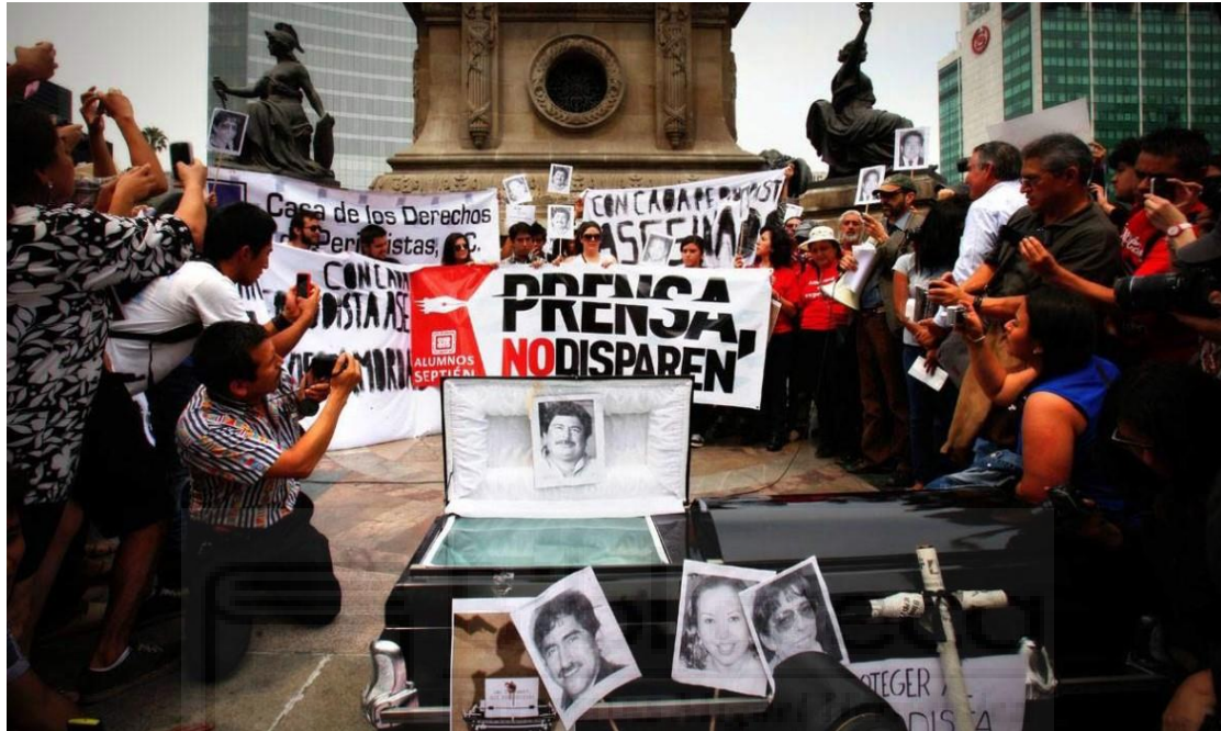
México: un país violento para el ejercicio periodístico/ Revista La hoja de Arena

Radiografía de la situación crítica del periodismo mexicano durante el proceso electoral 2018 a través de los testimonios de sus intrépidos protagonistas