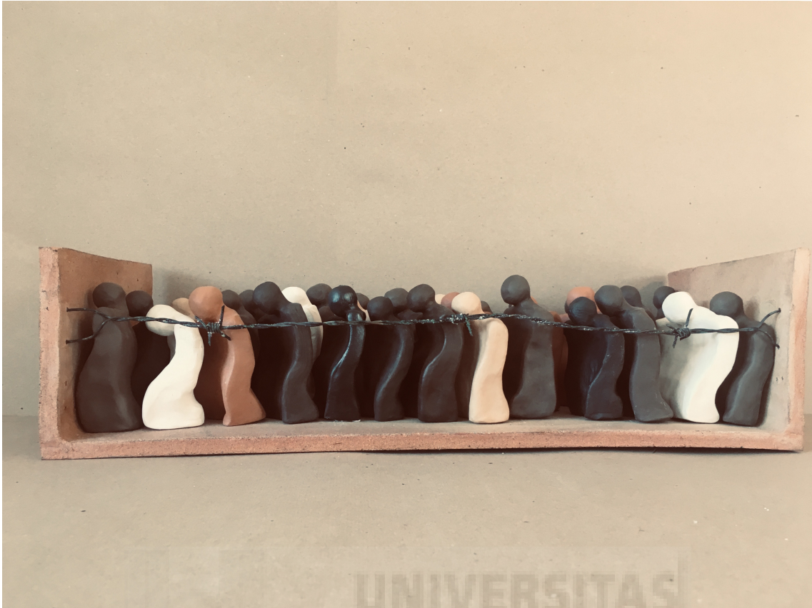
Fig. 19. Huida (2019), cerámica y alambre de espinos, 13x50x18.5 cm.