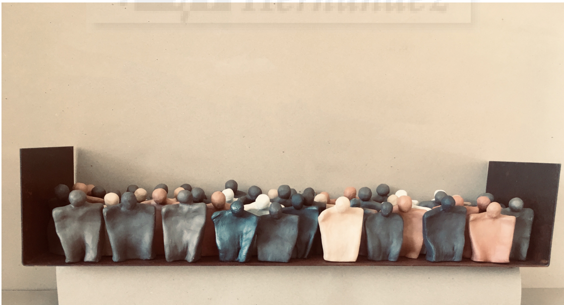
Fig. 18. Siempre fronteras (2019), hierro y cerámica, 16x73x20 cm.