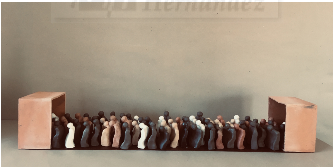
Fig. 20. Buscando la salida (2019) cerámica, gres y hierro, 19x102x19