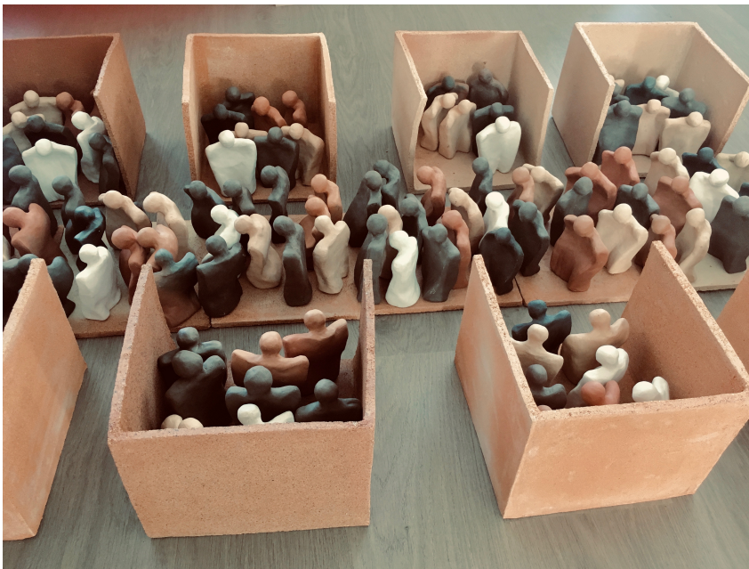
Fig. 16. Campo de refugiados (209), cerámica y gres, 19x67x152 cm .