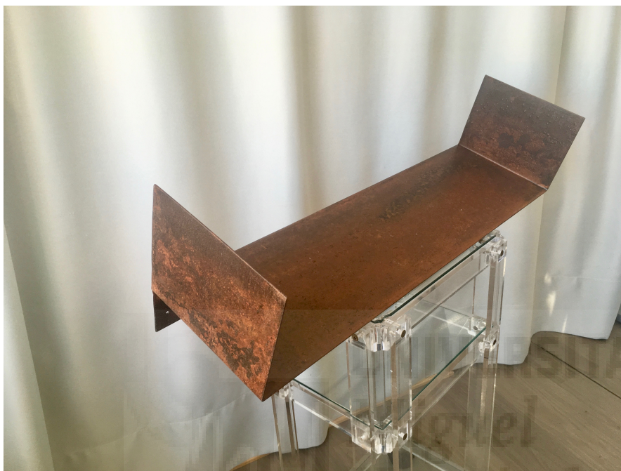
Figura 13. Siempre fronteras (2019), hierro y cerámica, 16x73x20 cm.

Para su exposición se acompañan de 50, 100 y 45 figuras de arcilla respectivamente.