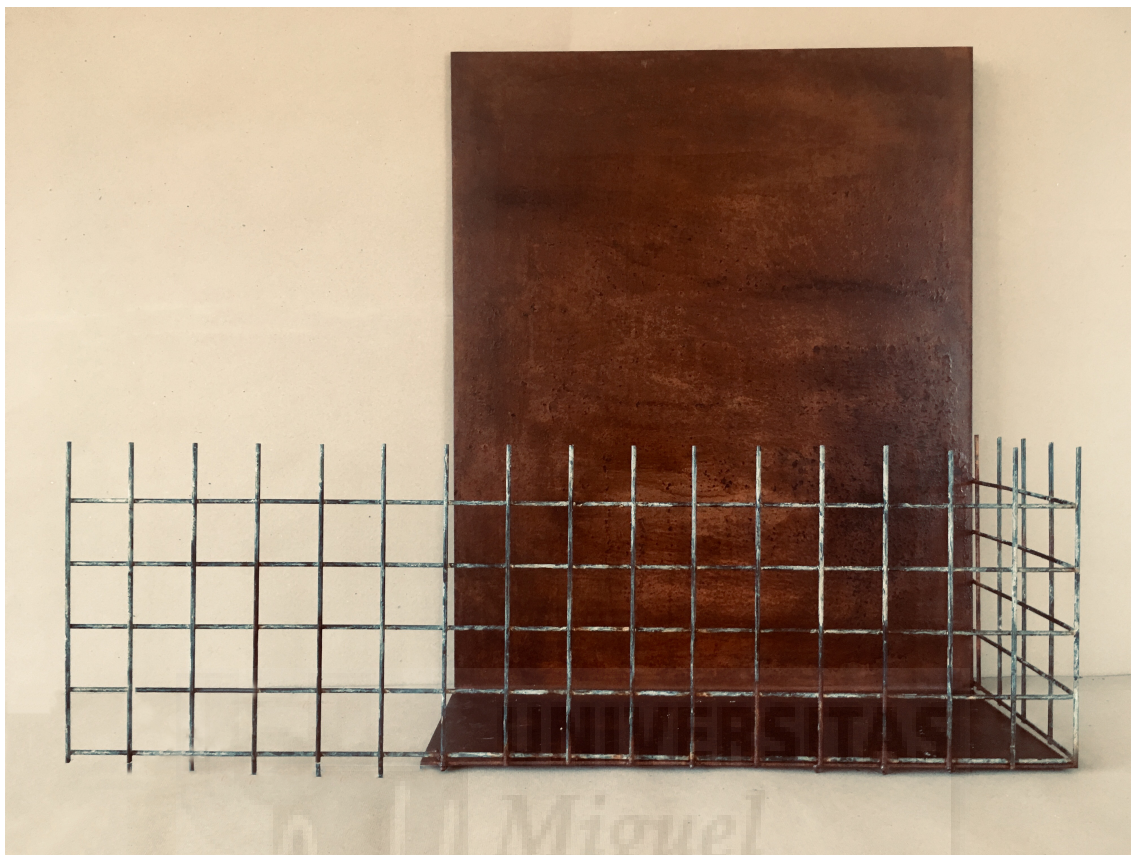
Fig. 15. Sin horizontes , (2019) Hierro, 64x81x21 cm.

A esta pieza se le ha soldado una verja de hierro de 26X81x21 cm. (fig. 15)