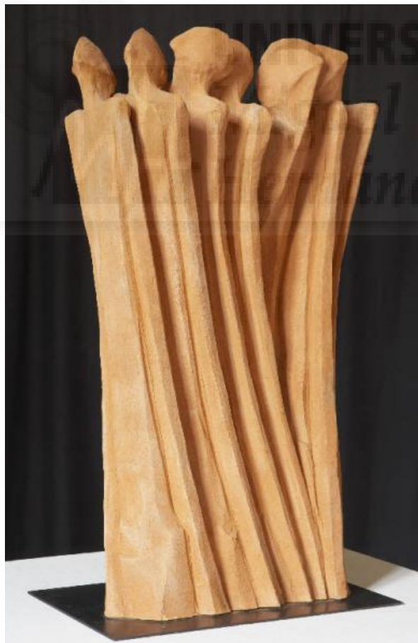
Fig. 1. Previtali Dolores, Uomini fragili (2003). Escultura, terracota (41 x 35 x 65 cm.). Musel Civici dl Lecco. Galería Comunal d'Arte.

La utilización de arcilla, como medio de expresión, para contar el viaje de la humanidad en manojos de figuras errantes, son otra de las referencias que hemos tenido en cuenta en nuestro trabajo.