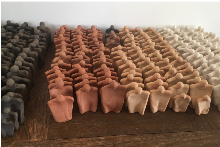
Fig.8. Multiplicidad de figuras