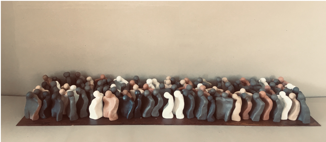
Fig. 17. Desolación (2019), hierro y cerámica, 9.5x102x24 cm.