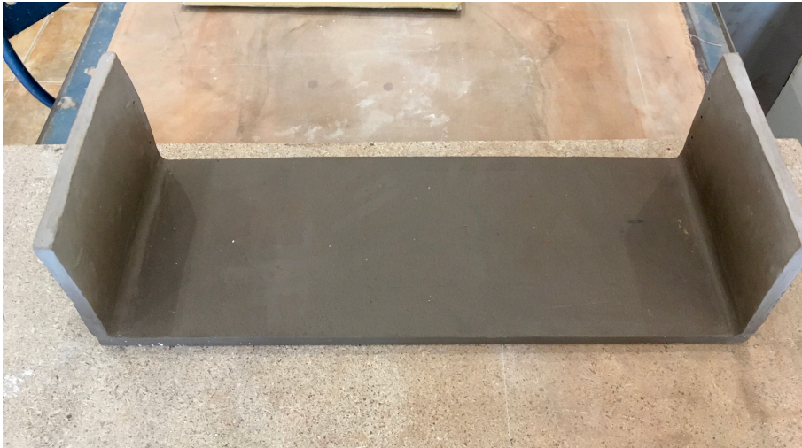
fig. 11. Huida (2019). cerámica y alambre de espinos, 13x50x18.5 cm.

Para su exposición se acompañará de 37 figuras de arcilla