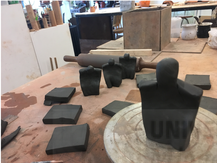
Fig. 7. Proceso de modelación de las figuras de arcilla.

El primer compromiso era realizar cada una de las 450 figuras humanas que compone la instalación, hechas individualmente mediante rectángulos de 7x8 cm, y una esfera de 2 cm, que se unirán modelando la arcilla. (fig. 7 y 8)