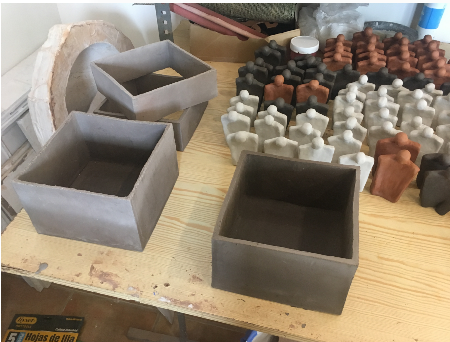
Fig. 12. Buscando la salida (2019) cerámica, gres y hierro, 19x102x19cm.

Para su exposición se acompañan con 45 figuras de cerámica.