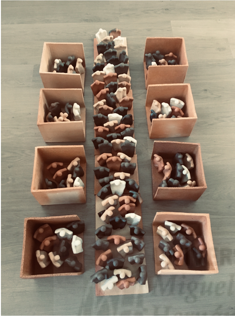
Fig. 16 A Campo de refugiados (209), cerámica y gres, 19x67x152 cm.