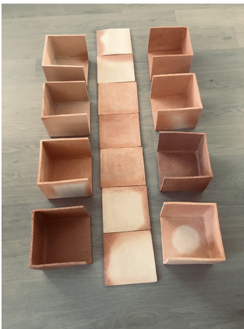
Fig. 10 Campo de refugiados (2019), , cerámica y gres, 19x67x152 cm.