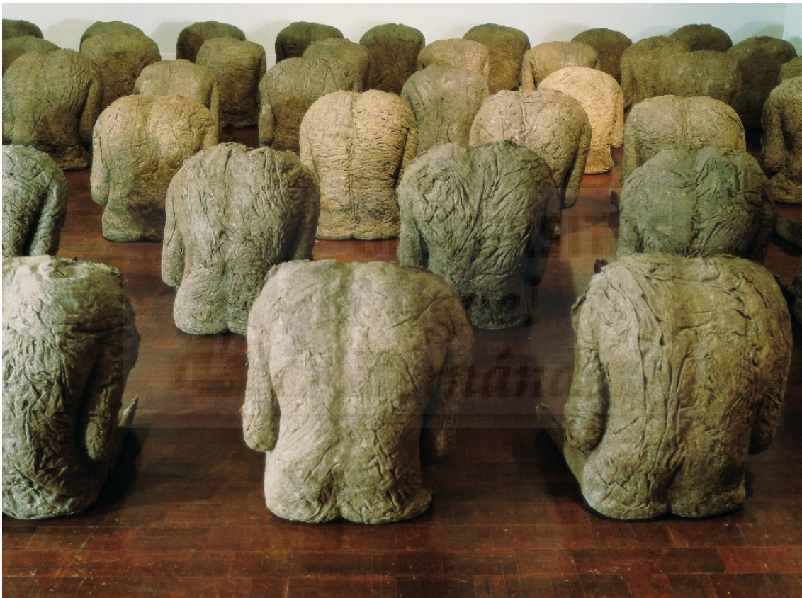
Fig. 4. Abakanowicz Magdalena. Plecy/Backs (1976-80) - Escultura formada por ochenta negativos de cuerpos. trozos de tela de saco grueso cosidos, unidos con resina sintética.

Su obra (fig.4) está marcada también por la experiencia de un país asolado por la guerra y su vivencia en un régimen totalitario bajo la órbita soviética, circunstancias, que a través de las diferentes piezas que desarrollamos constituyen la base de este proyecto.