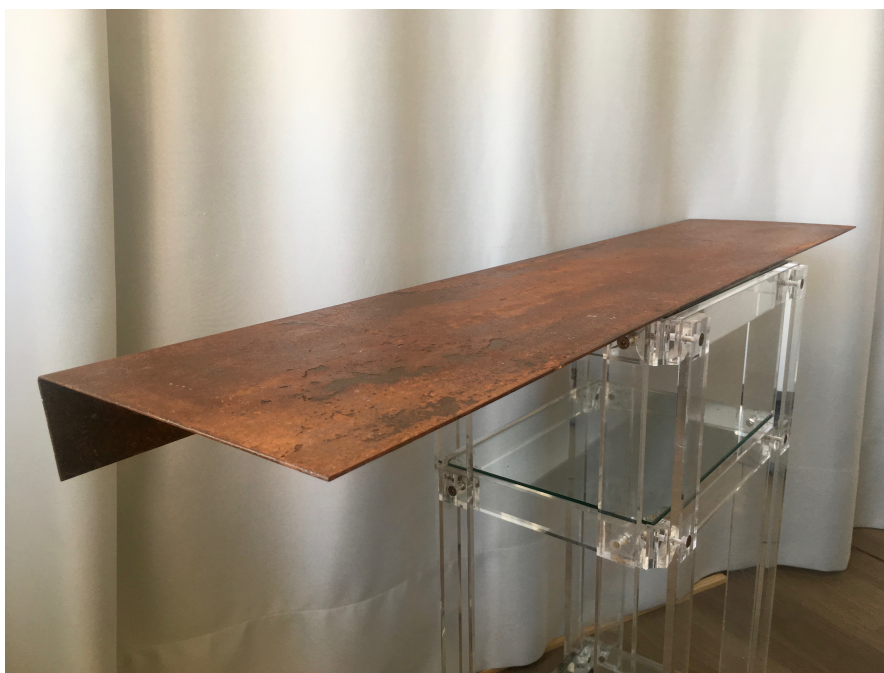
Fig. 14. Desolación (2019), hierro y cerámica, 9.5x102x24