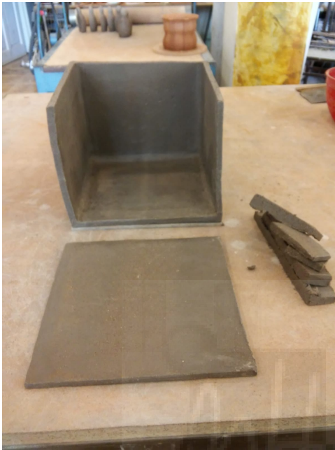
Fig. 9. Campo de refugiados (2019), cerámica y gres, 19x67x152 cm.

Para su exposición, se le acompañará 120 figuras de arcilla en diferentes tonalidades.