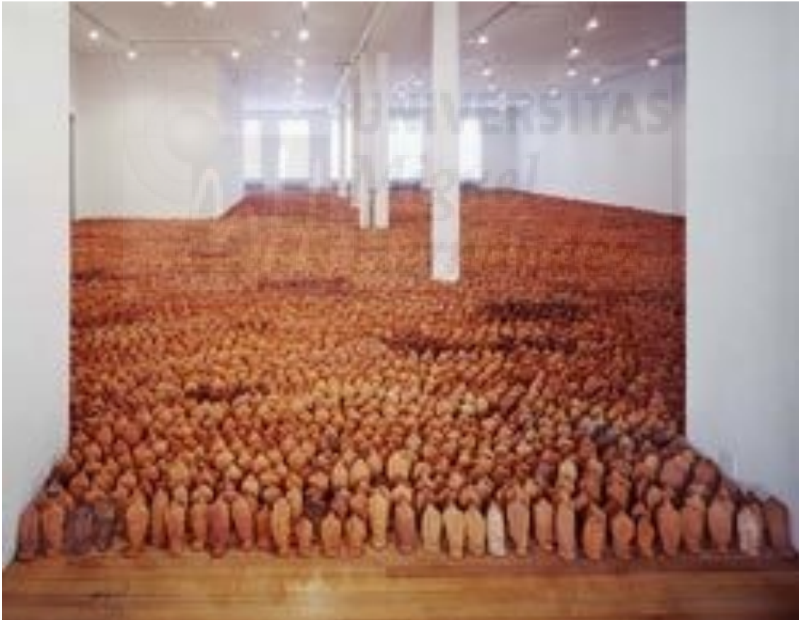
Fig. 3. Gormley Antony, Campo (1991). Esculturas, cerámica (8 cm. a 26 cm.) Royal Albert Dock Liverpool

La instalación actualmente contiene 210,000 cuerpos. El incentivo de Gormley fue sencillo: producir una serie de pequeñas piezas a las que da vida con diminutos ojos que puedan mirar hacia atrás en nosotros.