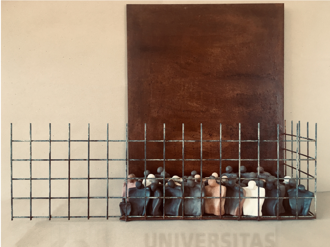
Fig. 21. Sin horizontes , (2019) Hierro y cerámica, 64x81x21 cm