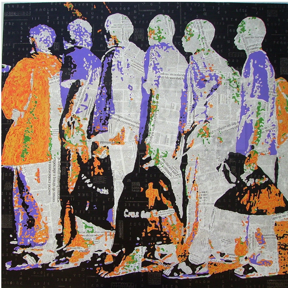
Fig. 2. Nolasco Cordero Gómez Pedro, "Conflictos" (2.009), Mixta sobre madera. (120 x 120 cm.)

Este joven pintor autodidacta, trata de interpretar en esta obra ( Fig. 2 ), sus sentimientos más profundos, sus pasiones y ansiedades, ante los horrores de la guerra, el desastre y la desesperación de las personas que viven en países con conflictos bélicos. Todo esto se trata de transmitir en este estudio, y se utiliza al igual que el artista, la multiplicidad de figuras para enfatizar el dramatismo del momento