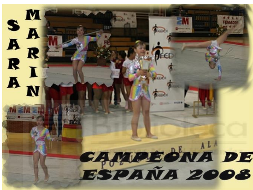
Ilustración 5. Recapitulación de imágenes del primer campeonato de España.