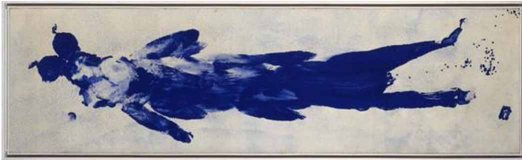
Fig.1. Yves Klein. Antropometría sin título (ANT 56) . Pintura, Pigmento seco en resina sintética sobre papel entelado pegado a lienzo. 1960. 1

Yves Klein (1928-1962) utiliza preferentemente el azul ultramarino, un pigmento que el propio artista patentó bajo la marca IKB (International Klein Blue).