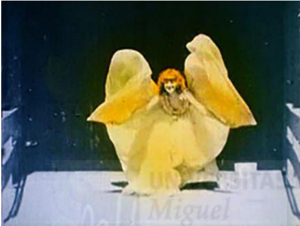
Fig.2. Loïe Fuller. Annabelle Serpentine Dance . 1895.

La primera de muchas películas dedicadas a la " danza serpentina " creada por la bailarina estadounidense Loïe Fuller en 1889 e interpretadas por Annabelle Moore.