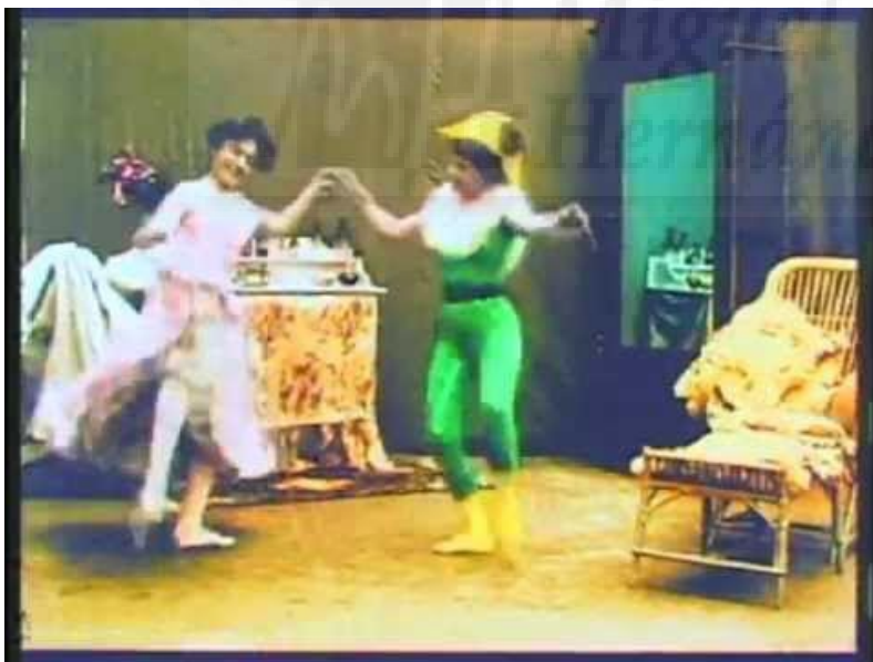
Fig.3. Alice Guy Blaché. Pierrette's Escapes . 1900.

Pierrette's Escapes (1900) se coloreó a mano, fotograma a fotograma-subvirtió los roles de género de La Comedia del Arte a través de una escena de seducción. En la primera, un sexualmente ambiguo Pierrot trata de enamorar a Colombina bailando, pero ella lo rechaza rotundamente. Luego entra en escena una mujer que logra llamar su atención. El vídeo acaba cuando ambas se besan. Así se rodó la primera escena lésbica en la historia del cine.