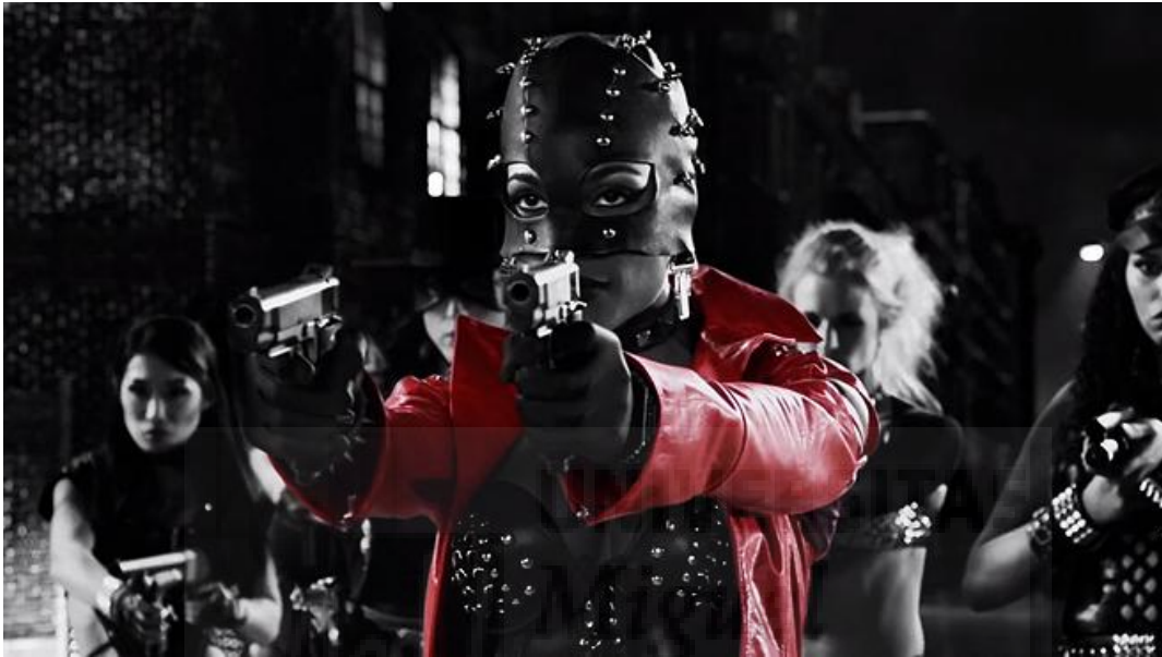
Fig.8. Sin City. Película (2005)

Es una película de 2005, relata tres historias por separado de estilo cómico, esta película se traza mediante la utilización de colores en escenas caracterizadas por la oscuridad, del negro y el gris. El espectador observa con facilidad lo que el director desea en cada momento, algo que no hubiera ocurrido si la película no tuviera el efecto de color selectivo.