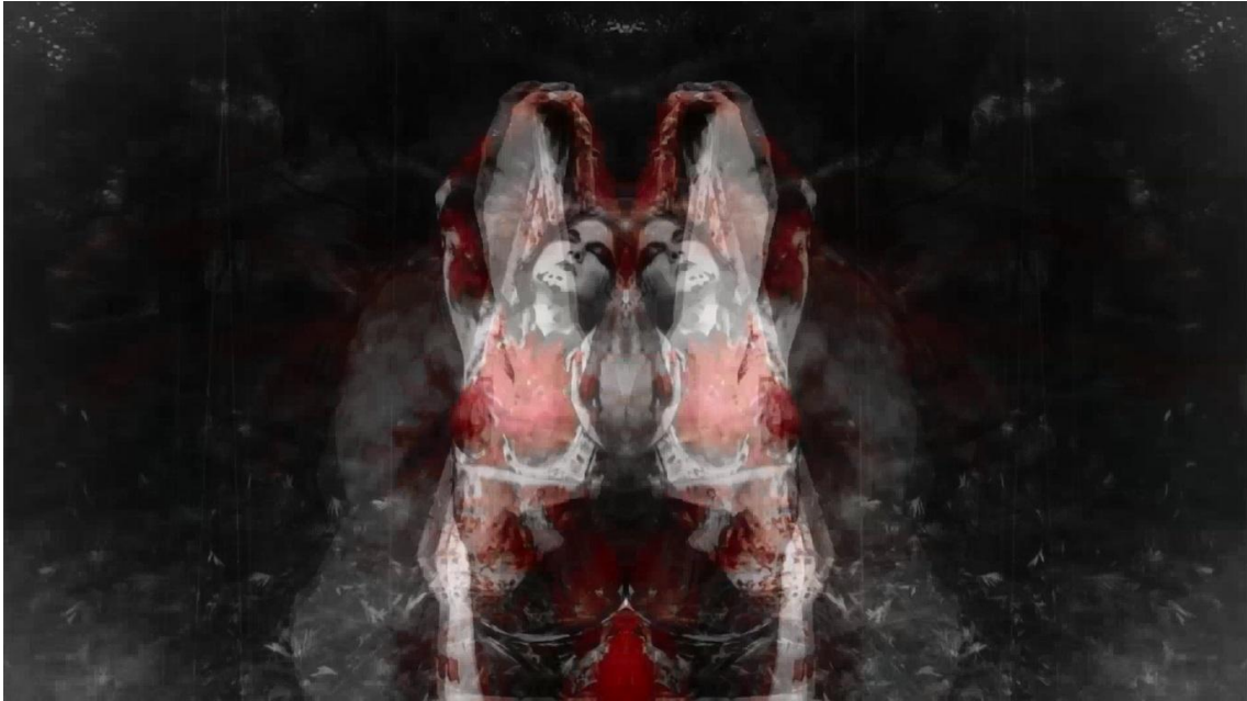
Fig.15. Dennis Cambero Pérez. Fotograma del vídeo experimental perteneciente al proyecto Súbito atentado. Sometido por el pánico. (2018).