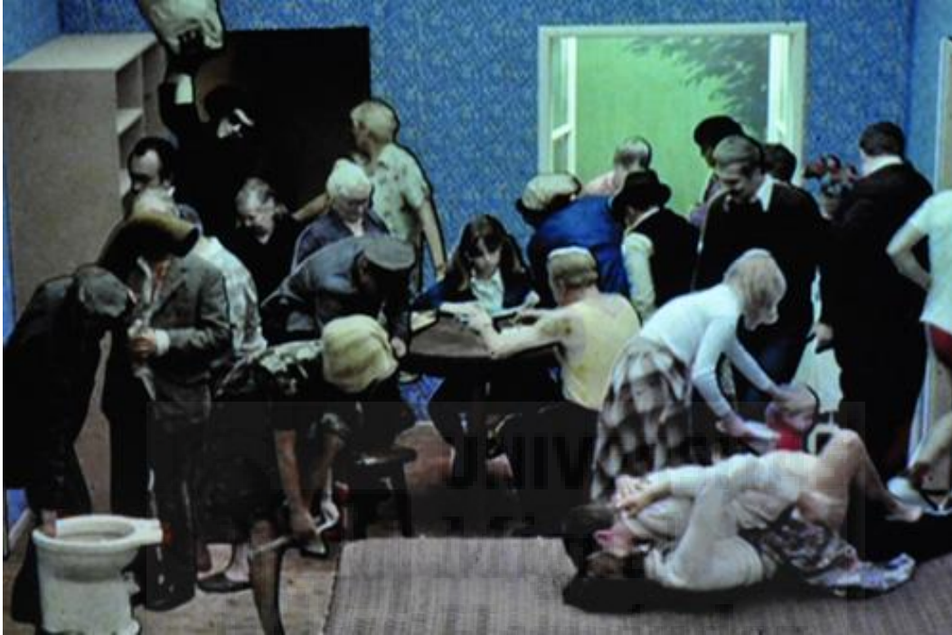
Fig.5. TANGO. Zbigniew Rybczyński. 1981.

Cortometraje que utiliza el tiempo y el espacio para simultanear múltiples situaciones y eventos en la misma habitación.