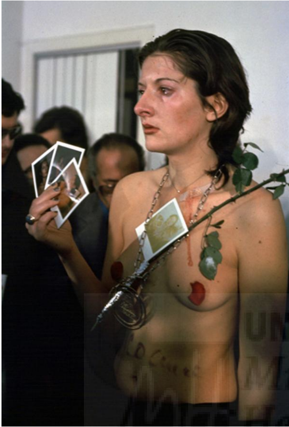
Fig.6. RYTHYM 0. Marina Abramovic. 1974.