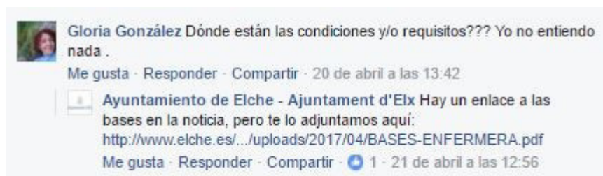
Imagen 7. Interacción entre la cuenta y un seguidor.

Ante este comentario el Ayuntamiento contesta al seguidor ofreciéndole datos sobre las bases como la condición no eliminatoria de la prueba en valenciano y su puntuación de 1 sobre 21 en la candidatura de acceso.