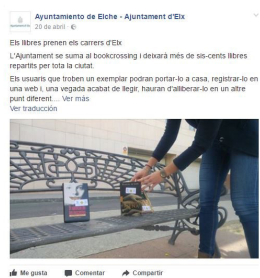
Imagen 10. Publicación de la cuenta el día 20 de abril de 2017.

Por último, la imagen 10 se corresponde con un post publicado el 20 de abril relacionado con una iniciativa llevada a cabo por la Concejalía de Cultura llamada bookcrossing, que consistió en el reparto de ejemplares de libros por toda la ciudad.