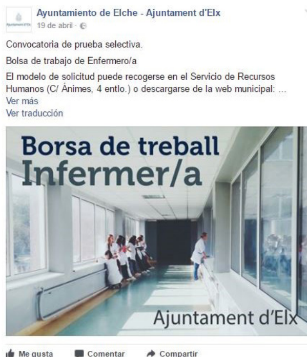
Imagen 5. Publicación de la cuenta con más actividad durante el periodo de estudio.

La imagen 5 muestra un post publicado por la cuenta el 19 de abril sobre la apertura de una bolsa de trabajo para enfermeros. Dicho contenido generó gran interacción y reacciones por parte de los usuarios, ya que por ejemplo, de los 141 comentarios recogidos a través de los 51 posts de la muestra, 85 de ellos se corresponden con la mencionada publicación, es decir, nada más y nada menos que un 60,28% del total de respuestas recibidas por la página objeto de estudio. Además, el post obtuvo un total de 555 compartidos y un total de 259 reacciones (251 “me gusta”, 4 “me encanta” y 4 “me enfada”).