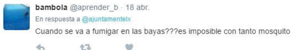
Imagen 2. Respuesta de un usuario a un tweet publicado el 18 de abril.

podemos observar que un 50% de las respuestas emitidas por los seguidores son peticiones de información en relación a noticias publicadas desde el Consistorio.