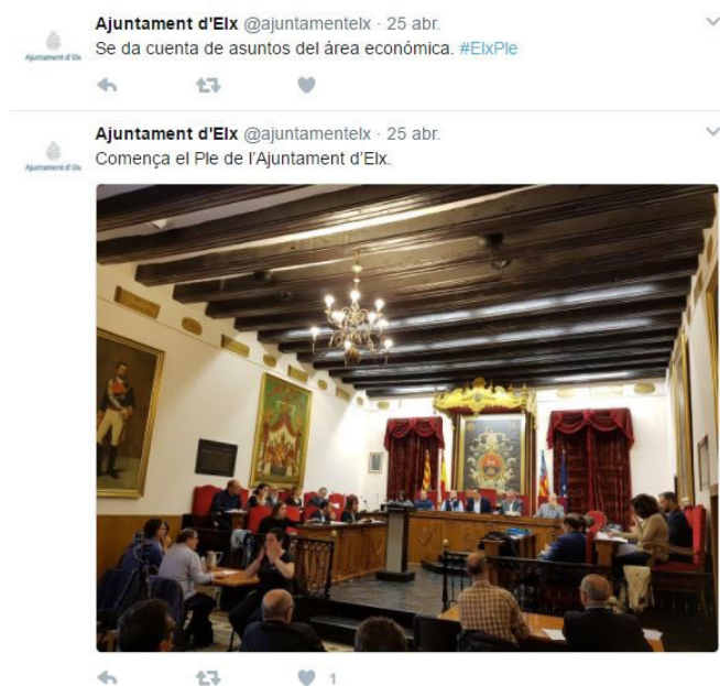
Imagen 1. Hashtag utilizado durante el pleno municipal celebrado en abril.

La imagen 1 corresponde a un tweet publicado durante la celebración del pleno mensual en el Ayuntamiento de Elche. Como se puede observar, para ese día el Community Manager de la institución pública utilizó el hashtag #ElxPle, pero esta etiqueta no registró ninguna respuesta por parte de los usuarios a pesar de que el pleno fue retransmitido por streaming a través del canal de Youtube del ente ilicitano.