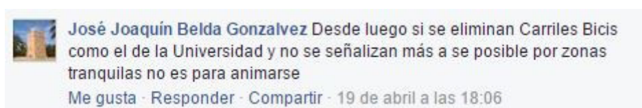
Imagen 12. Selección de comentarios negativos de otros posts del periodo de estudio.

Tal y como podemos observar en la imagen 11, el Ayuntamiento no reacciona ante los comentarios positivos de los usuarios, ya que no ofrece respuesta ni tampoco pulsa cualquiera de los botones que ofrece la red social Facebook.