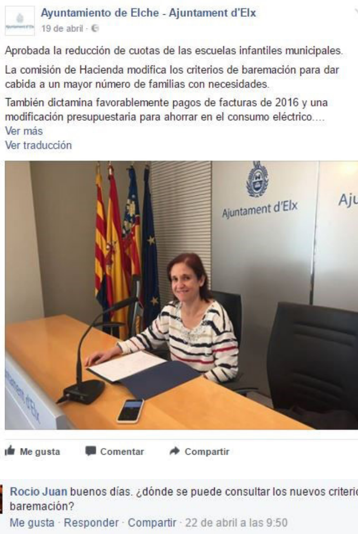
Imagen 9. Publicación de la cuenta y reacción de un usuario.

Como se puede observar en la imagen 9, un usuario que solicita información no la recibe por parte del Consistorio como sí ocurre en la publicación sobre la bolsa de empleo para enfermeros. Este es un patrón que se repite con frecuencia.