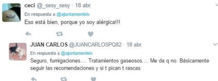
Imagen 3. Respuestas de los usuarios a un tweet del 18 de abril.

En la imagen 2 podemos ver la petición de información por parte de un usuario sobre una tema como la fumigación de una partida de Elche, las Bayas, debido a la proliferación de mosquitos en la zona. El perfil, ante dicha cuestión, no emite ninguna contestación y el seguidor observa que su duda no ha sido resuelta. Esta situación genera descontento en el público de la red, ya que recibe la percepción de un perfil que publica contenidos pero que no replica contestación alguna.