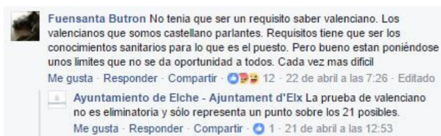
Imagen 6. Interacción entre la cuenta y un seguidor.

La imagen 5 muestra un post publicado por la cuenta el 19 de abril sobre la apertura de una bolsa de trabajo para enfermeros. Dicho contenido generó gran interacción y reacciones por parte de los usuarios, ya que por ejemplo, de los 141 comentarios recogidos a través de los 51 posts de la muestra, 85 de ellos se corresponden con la mencionada publicación, es decir, nada más y nada menos que un 60,28% del total de respuestas recibidas por la página objeto de estudio. Además, el post obtuvo un total de 555 compartidos y un total de 259 reacciones (251 “me gusta”, 4 “me encanta” y 4 “me enfada”).