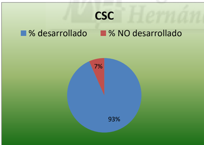
Ilustración 2: % desarrollo competencial