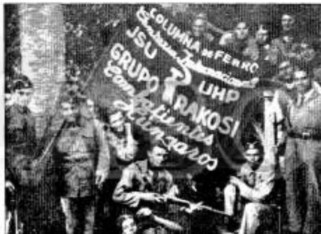
Combatientes húngaros de las Brigadas Internacionales

se decidió a apoyar a la República bajo la fórmula de una democracia parlamentaria, pero no de una revolución obrera. Pero este apoyo teórico no implicaba necesariamente una intervención militar. Los primeros pasos hacia la intervención sólo se tomaron a mediados de agosto, y los primeros grandes envíos de suministros no llegaron hasta finales de octubre.