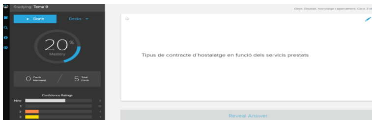
Imagen 2: Ejemplo anverso de carta (pregunta) en Brainscape para el grupo 2 (valenciano) del grado en Turismo