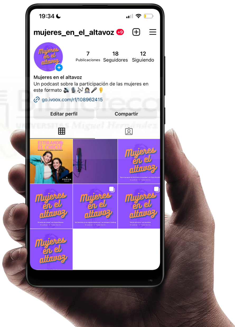
Captura de pantalla del feed del podcast en Instagram

He elegido esta plataforma porque considero que es una forma fácil de llegar a muchas personas con un rango de edad de entre 20-30 y que pueden estar interesadas en el contenido. Además, Instagram se enfoca en contenido visual, lo que puede ser una gran ventaja para un podcast, ya que se pueden crear imágenes o videos llamativos para promocionar el programa. También, pensando en el futuro, me gustaría que las entrevistas fueran en directo y creo que esta plataforma puede darme más visualizaciones en el caso de que sea así.