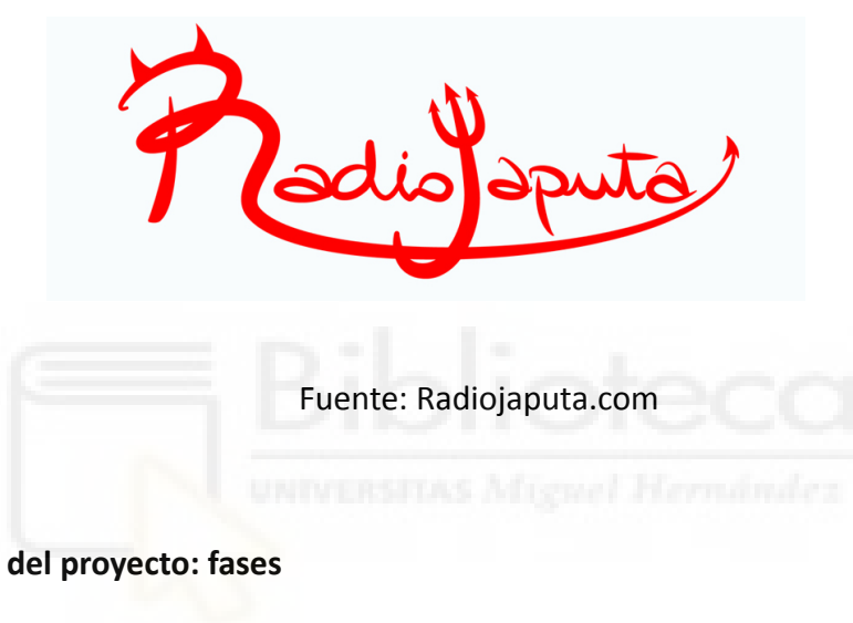
Figura 2: Señal de identidad de 'Radiojaputa'

"Nadie duerme" (2019): En esta obra, se nos presenta una historia cautivadora sobre los sueños y la vida en la ciudad. A través de personajes complejos y situaciones inesperadas, el autor o autora nos invita a reflexionar sobre la soledad, el amor, los sueños y la búsqueda de significado en un mundo frenético