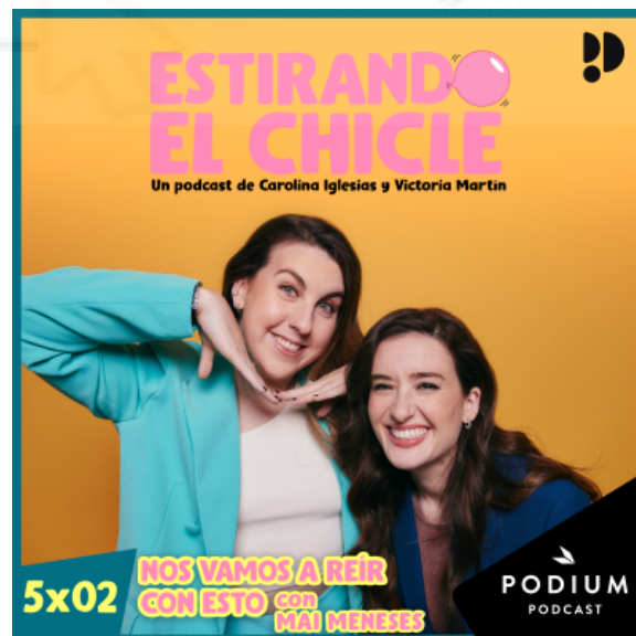
Figura 2: Carátula del podcast 'Estirando el chicle'

Actualmente emite los lunes en Podimo la quinta temporada del programa que, sin duda alguna, tiene mucho éxito.