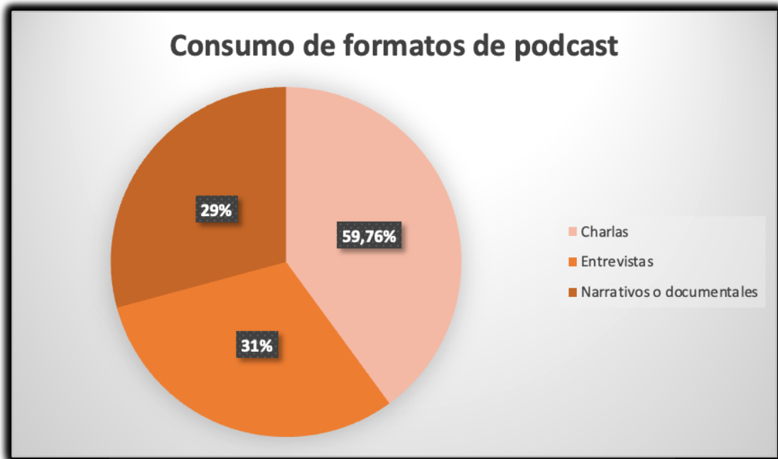
Figura 1. Contenidos de los podcast

Nota. Fuente datos informe anual de 2022 de iVoox [Gráfico], 2023.