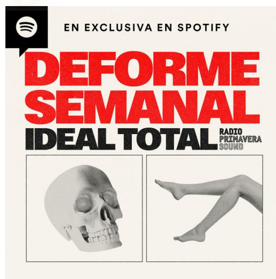
Figura 3: Carátula del podcast 'Deforme semanal ideal total'

Desde finales de 2021, han vuelto a alternar entre programas grabados en estudio y aquellos realizados en teatros con público. Esta adaptación les ha permitido seguir ofreciendo su contenido a su audiencia de manera dinámica y versátil. (Avendaño T. C., 2021)