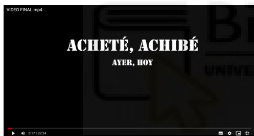
Fig 6. Andrea Rodríguez: Acheté, Achibé (Ayer, Hoy) (2023), video documental, 22'