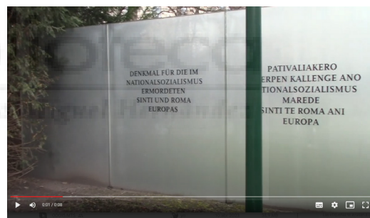
Fig 7. Andrea Rodríguez: Acheté, Achibé (Ayer, Hoy) (2023), video documental, 22'