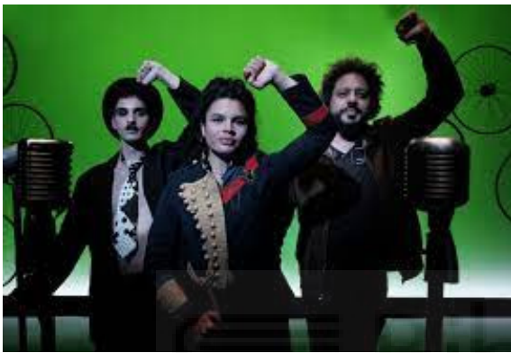
Fig 1. Pablo Vega: Proud Roma (2022), video arte, 9', 8"

Fue un video el que hizo que reconectara con mis orígenes, Proud Roma (2022), de Pablo Vega. Este es un remake de una escena de la película de Charles Chaplin El Dictador (1940). Se trata de un discurso, que insta a la lucha por la igualdad y el amor propio del pueblo gitano, y a la unión que deben tener para resistir la presión que la sociedad genera.