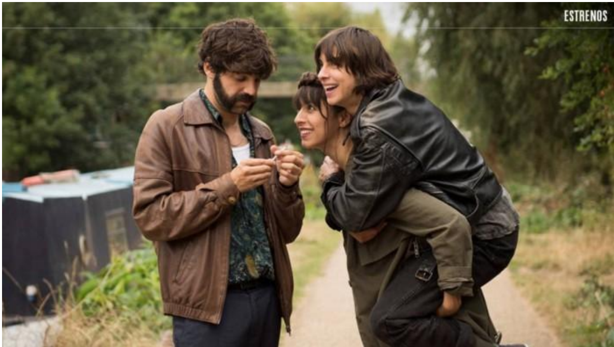
Personajes de la película Tierra firme, todos ellos con ropa de segunda mano