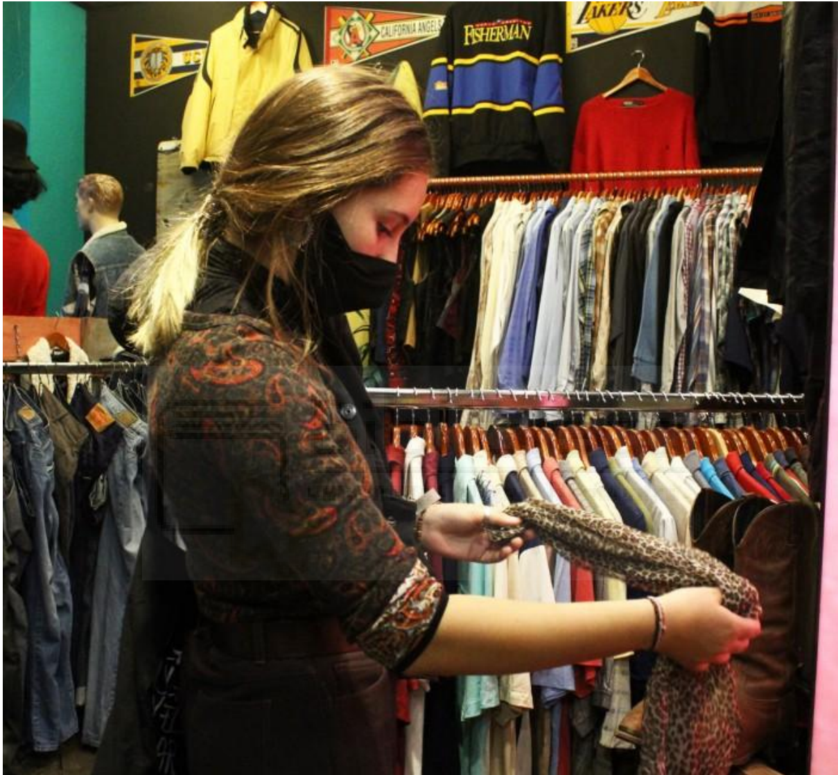
Nati visitando la tienda Flamingo Vintage en Valencia

hacerse con una, dos, o incluso decenas de prendas que serán desechadas al terminar la temporada. “Duele mucho ver todas las personas que consumen ropa que en muy poco tiempo va a terminar en vertederos”, señala la joven.