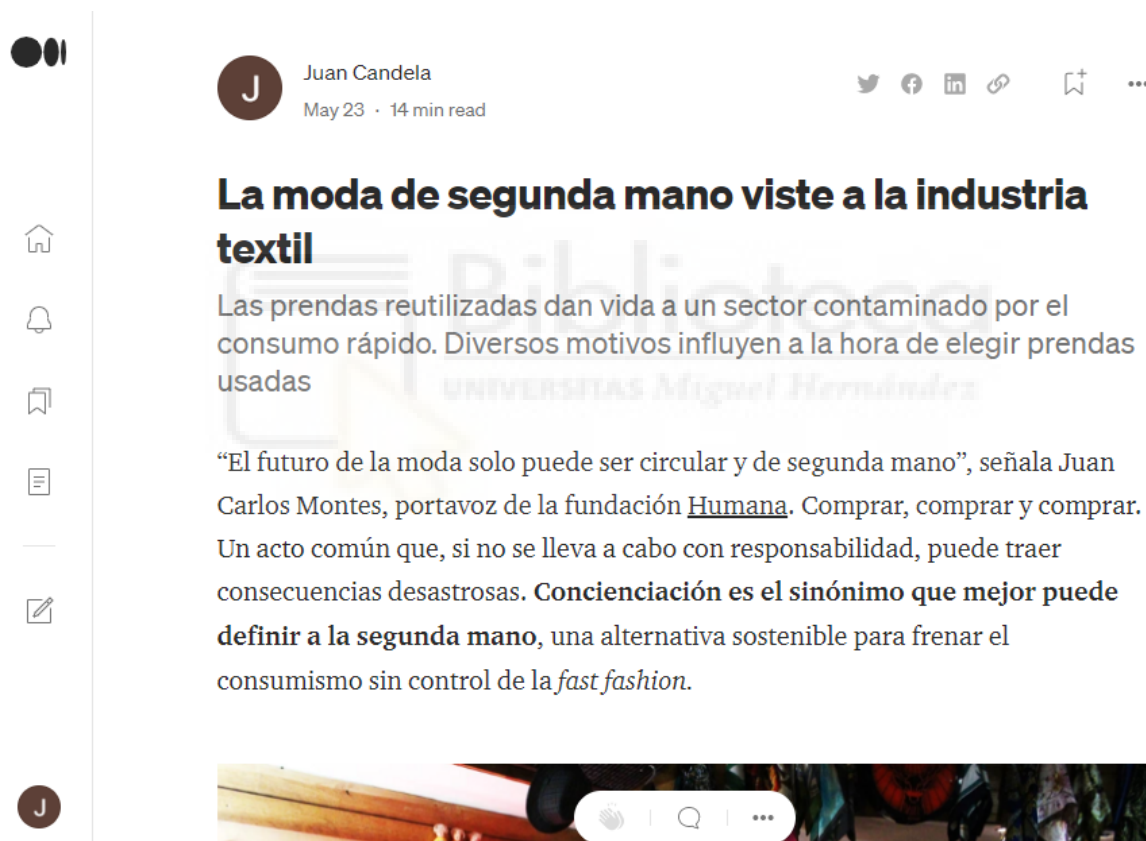
Captura del reportaje en Medium

El reportaje ha sido publicado por Medium, una de las plataformas gratuitas más importantes donde cualquier persona puede escribir artículos y publicarlos. Para este reportaje he escogido Medium debido a que durante toda la carrera universitaria he publicado mis artículos en dicha plataforma. Medium ofrece cantidad de alternativas para mejorar los textos, y, a la par, es muy sencilla y fácil de utilizar. Existe una gran comunidad de usuarios dentro de esta plataforma.