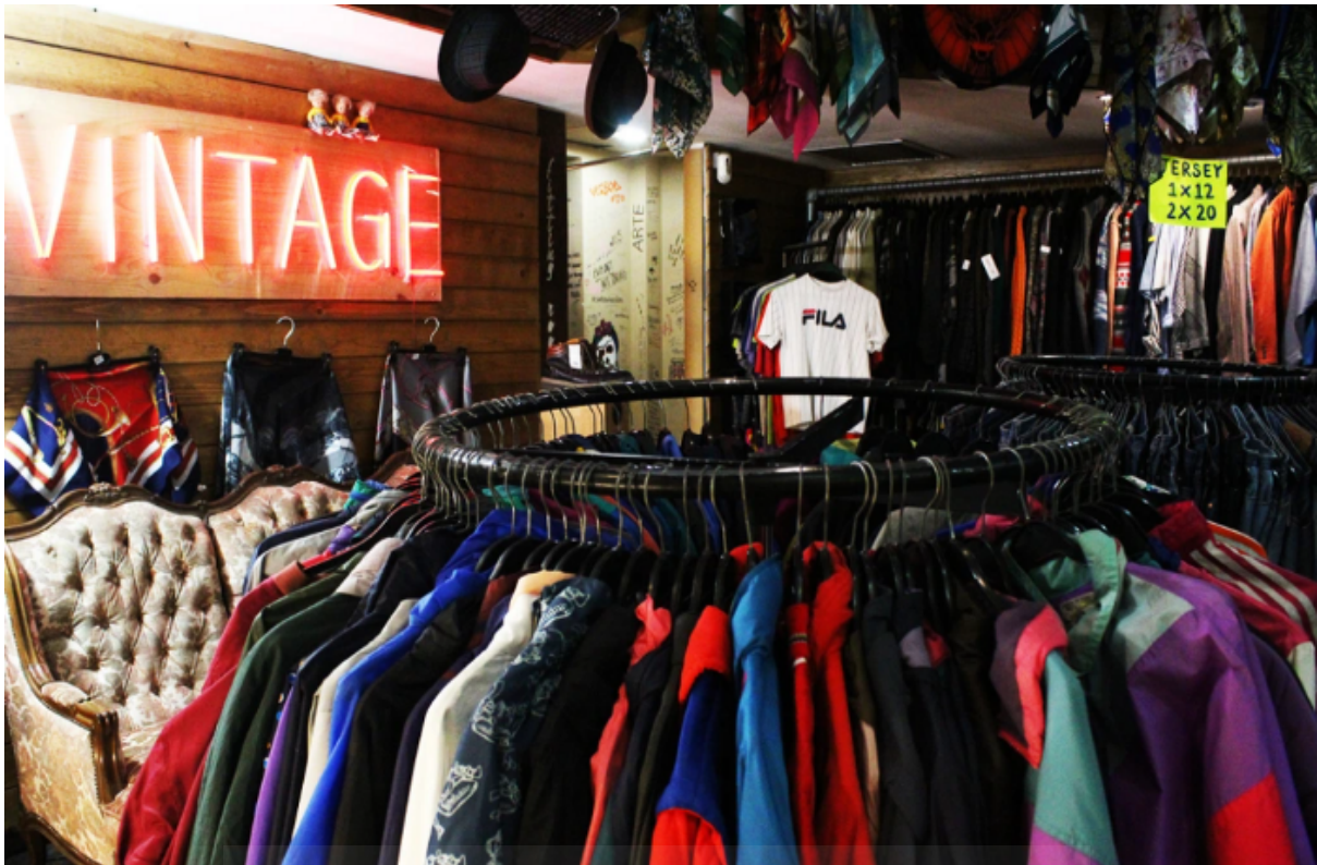
Interior de la tienda Vintage Love Valencia

Concienciación ecológica , prendas de calidad a precio económico y sentimiento de exclusividad son los tres pilares fundamentales que mantienen a la moda de segunda mano. Una tendencia en auge que busca combatir contra la fast fashion , un modelo productivo insostenible ambientalmente y con pronósticos negativos a largo plazo.