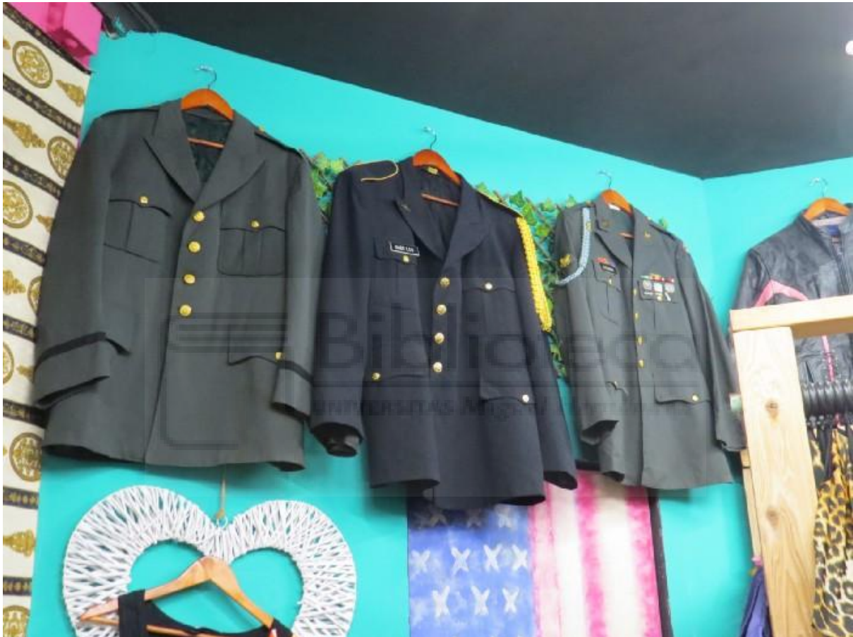
Chaquetas vintage del ejército con más de 20 años. Tienda Flamingo Vintage Kilo Valencia