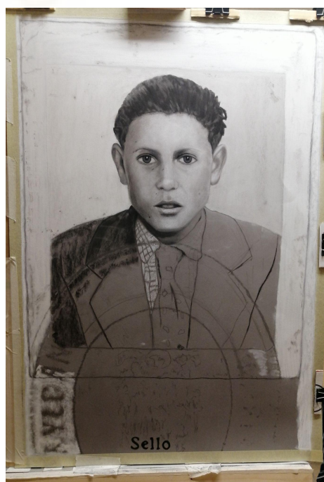
Fig.7 Fase del proceso de construcción de la tercera obra