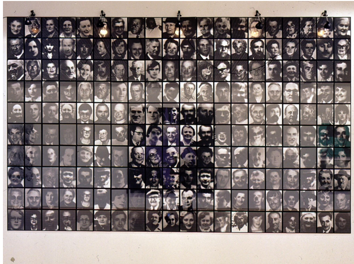
Fig.1 Christian Boltanski, La Réserve de Suisse Morts , 1990-1991

A continuación, la artista valenciana Carmen Calvo (1950), también representa el concepto de la memoria abordando temas como la familia, la guerra, la maternidad, etc. Las obras de la artista nos hacen recordar que, aunque el tiempo pasado ya ha transcurrido, los objetos de este pasado nos devuelven fragmentos de nuestra identidad, elementos que nos permiten aceptar la distancia de nuestro pasado y nuestros recuerdos, entre lo que somos ahora y lo que soñábamos ser. Al igual que Christian Boltanski, Carmen Calvo nos recuerda que el pasado no desaparece nunca, aunque quede olvidado en un cajón o en cualquier otro lugar. En su serie fotográfica "Quietud y vértigo" (1999-2017), la artista recurre a fotografías anónimas de los años 1940 a 1970 provenientes de álbumes familiares, manipulándolas, las interviene con colores, las araña, añade objetos y amplía de tamaño. En definitiva, Carmen Calvo modifica fotos antiguas de carácter familiar y gira la perspectiva desde la que vemos el mundo (Figura 2).