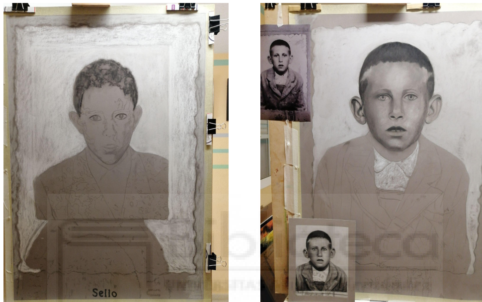
Fig. 5 y 6 Fase del proceso de construcción de la primera y segunda obra

Este trabajo está formado principalmente por dos partes. La primera consiste en una entrevista de audio cuya grabación tiene una duración de 00:58:34 y se ha realizado al único de los tres protagonistas del trabajo que se encuentra en la actualidad con vida. La segunda parte consta de tres obras pictóricas realizadas con la técnica del pastel sobre papel Pastelmat gris oscuro y con unas dimensiones de 100 x 70 cm cada uno que, como hemos apuntado, se trata de retratos familiares hechos a partir de fotografías tipo carnet.