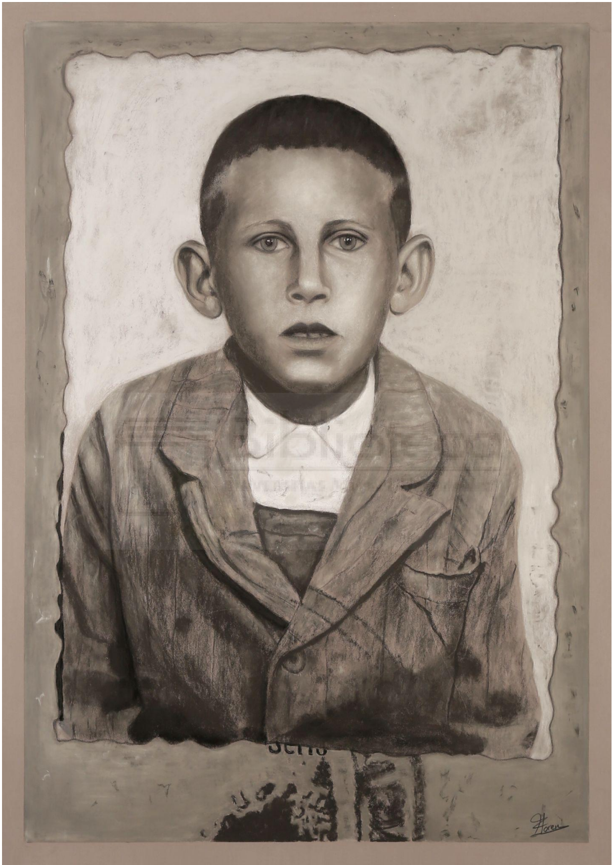
Fig.9 Papá (2022). Pastel sobre papel Pastelmat. 100 x 70 cm.