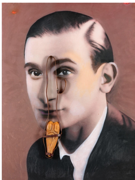
Fig.2 Carmen Calvo. Quietud y vértigo . 1999-2017

A continuación, la artista valenciana Carmen Calvo (1950), también representa el concepto de la memoria abordando temas como la familia, la guerra, la maternidad, etc. Las obras de la artista nos hacen recordar que, aunque el tiempo pasado ya ha transcurrido, los objetos de este pasado nos devuelven fragmentos de nuestra identidad, elementos que nos permiten aceptar la distancia de nuestro pasado y nuestros recuerdos, entre lo que somos ahora y lo que soñábamos ser. Al igual que Christian Boltanski, Carmen Calvo nos recuerda que el pasado no desaparece nunca, aunque quede olvidado en un cajón o en cualquier otro lugar. En su serie fotográfica "Quietud y vértigo" (1999-2017), la artista recurre a fotografías anónimas de los años 1940 a 1970 provenientes de álbumes familiares, manipulándolas, las interviene con colores, las araña, añade objetos y amplía de tamaño. En definitiva, Carmen Calvo modifica fotos antiguas de carácter familiar y gira la perspectiva desde la que vemos el mundo (Figura 2).