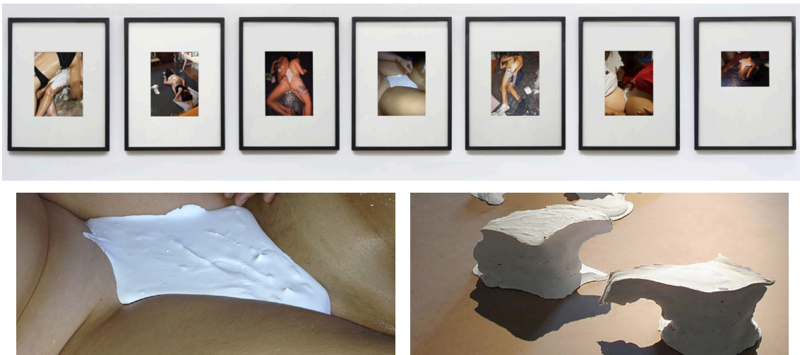
Fig. 2 El aire entre nosotrxs tiene forma de hueso (2020) / Impresión inkjet sobre papel fotografico / 44x33cm (a continuación detalle de una de ellas) El aire entre nosotrxs tiene forma de hueso (2017) / Esculturas de yeso piedra / medidas variables