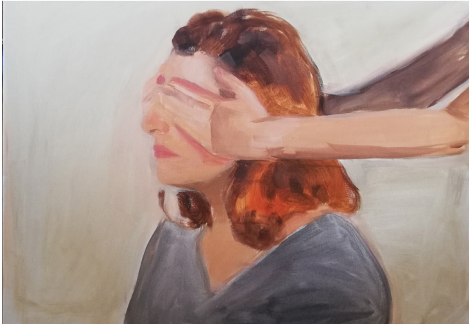
Fig. 5 Boceto en óleo sobre lienzo con medida 50x61cm.

A la hora de investigar este nuevo punto de partida, se barajaron los distintos materiales que se podían usar para representar el concepto, y se eligieron en un principio la porcelana, la tela tarlatana y la luz.