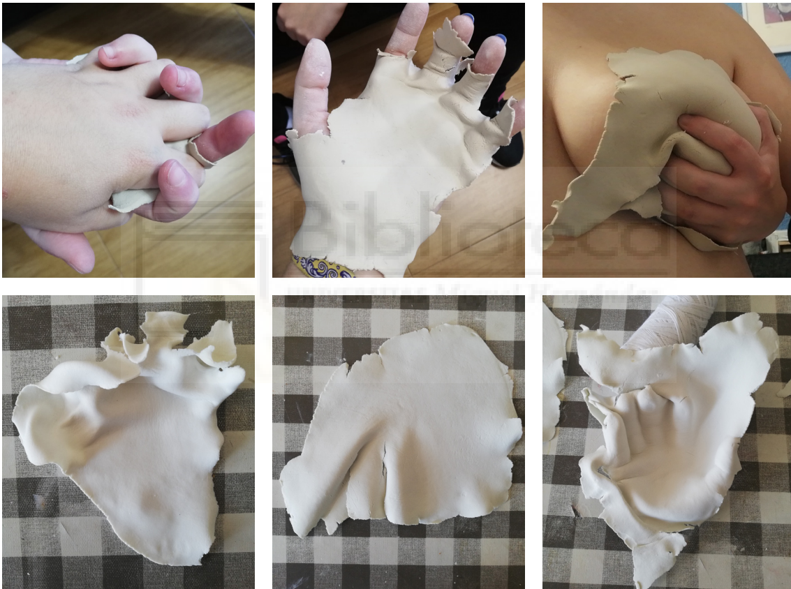
Fig. 9 Experimentaciones sobre el registro de acciones con los propios cuerpos, y la presión que se ejerce a la vez sobre la pasta. Piezas de dicha experimentación ya cocidas (abajo, de izq a dcha): coger de la mano, abrazarse, tocar un pecho.

Por último, el otro tipo de experimentación que se llevó a cabo fue el de usar la porcelana como medio para registrar acciones (fig. 9). A la hora de trabajarla con las manos, el registro de nuestra huella dactilar queda impreso, o al presionarla con los dedos para aplanarla, queda el hueco de la presión realizada. Partiendo de esta premisa, se buscaron distintas acciones a realizar entre dos personas para poder representar el concepto del proyecto: darse un abrazo, darse la mano, besarse, tocar distintas partes del cuerpo. La presión ocasionada por los dos cuerpos sobre la pasta, provoca que la textura de las pieles y la forma de vacío que se crea, quede plasmada en la forma de la porcelana. De igual manera, también se han hecho registros faciales, sobretodo de las formas de la nariz y boca, que son las más sugerentes y fáciles de plasmar por sus volúmenes.