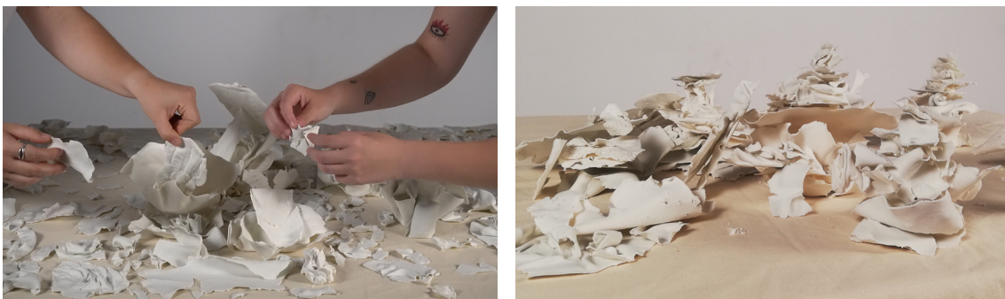
Fig. 11 Fotograma del vídeo y fotografía de las construcciones.

En dicho video se pueden ver cuatro manos que fueron creando los distintos montajes de encaje de piezas, en el que si no encajaba a la primera, se volvía a intentar hasta que todas las piezas se habían usado. Se realizaron fotografías una vez la acción terminó, como registro de las piezas finales que se desmontarían para volver a montarse en la instalación final.