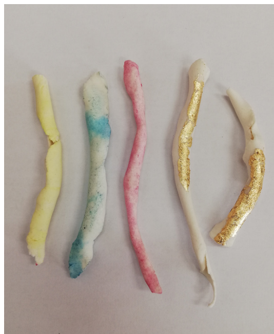
Fig. 7 Prueba de acuarela y pan de oro sobre piezas ya cocidas.

Otra de las experimentaciones realizadas fue la de hacer porcelana líquida, metiendo bloques en agua, para poder bañar distintos materiales en ella y comprobar qué sucedía en el horno. Lo que se consiguió fue que cualquier objeto que no aguantaba la temperatura, también desaparecía.