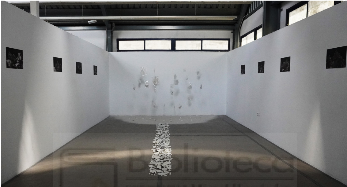
Fig. 12 Montaje final de la instalación.

La disposición de montaje final con las distintas piezas que se han realizado durante el transcurso de creación de este proyecto, ha variado en relación a la idea previa que se tenía antes de llevarlo a la sala para montar la instalación (pieza final). Aun así, gracias a segundas opiniones a la hora de aportar ideas para facilitar la comprensión de la obra, su distribución final en el espacio ha sido más que satisfactoria (fig. 12): cada una de las partes que componen la instalación artística mantiene una idea que se combina con las demás, mostrando así la historia que se pretendía contar al completo.