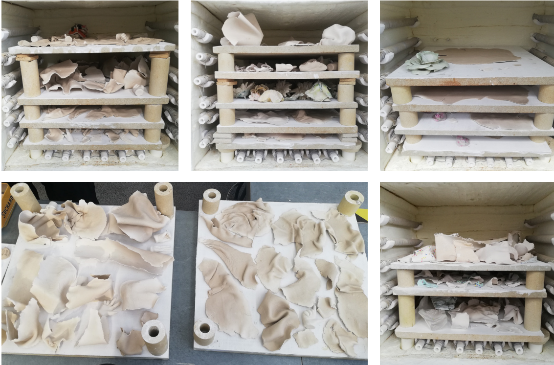
Fig. 10 Distintos hornos preparados con piezas para su cocción.

Durante toda la producción de las piezas, un detalle que no se pasó por alto fue el sonido que se podía escuchar al chocar o rozar entre sí piezas ya cocidas. Esto generó bastante interés, por la simbología que podía tener en el proyecto, por lo que se realizó un video con audio para llevar a cabo las construcciones que antes se mencionaban (fig 11).