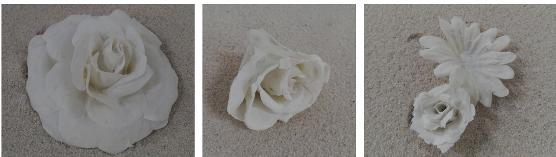
Fig. 15 Detalle de la arena con las flores.