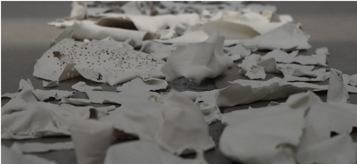
Fig. 14 Detalle de la porcelana colocada en el suelo.

En un principio, en la instalación final aparecerían todas las construcciones que también se grabaron en vídeo, pero a la hora de desarrollar el montaje, se decide dejar las piezas colocadas sobre el suelo, creándose así una diferencia sobre lo que realmente existe (esas construcciones como metáfora del paso del tiempo en la relación) y lo que se ve (momentos y vivencias sueltas que nadie sabe que tienen un proceso y construyen algo ) en la cruda realidad (potenciado por el suelo, duro y sin belleza) (fig. 14).