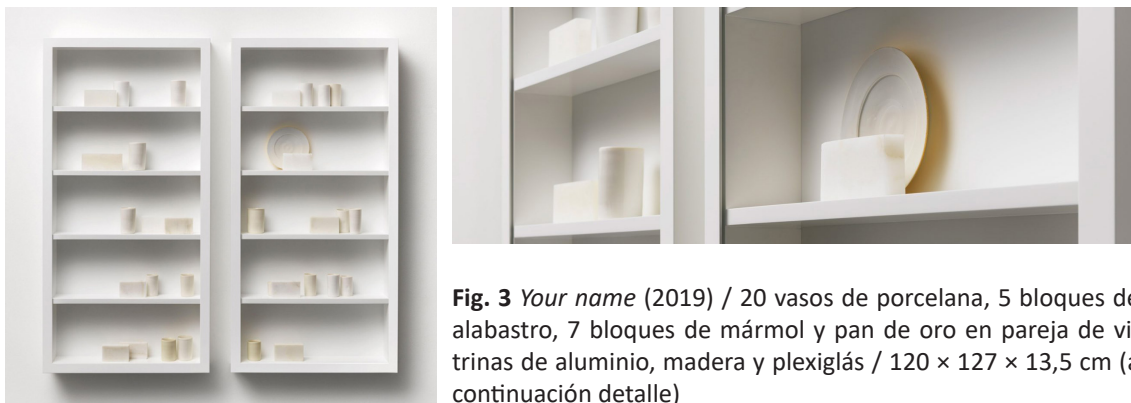
Fig. 3 Your name (2019) / 20 vasos de porcelana, 5 bloques de alabastro, 7 bloques de mármol y pan de oro en pareja de vitrinas de aluminio, madera y plexiglás / 120 × 127 × 13,5 cm (a continuación detalle)

Al ceramista inglés Edmund de Waal le apasiona el blanco puro de la porcelana, a la cual denomina “oro blanco”, y su capacidad de memorizar todo gesto que se le haga. Trabaja instalaciones con el blanco más extremo propio de la pasta, aunque juega también con los blancos, negros, grises o crema en todos sus matices, siempre con este material.