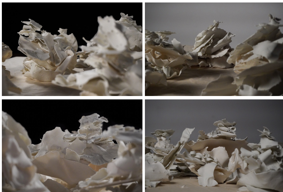
Fig. 13 Detalle de algunas de las fotografías de la instalación.

En un primer lugar, nos adentramos en una sala de paredes blancas y suelo gris, donde este puede ensuciar un poco la imagen de blancura que se buscaba. Nos encontramos con una instalación simétrica donde sobre el suelo vemos piezas de porcelana, las mismas que se usaron para la construcción del vídeo, pero separadas, formando un camino. Por los laterales, en las paredes se han puesto fotografías de esas construcciones previas (fig. 13).