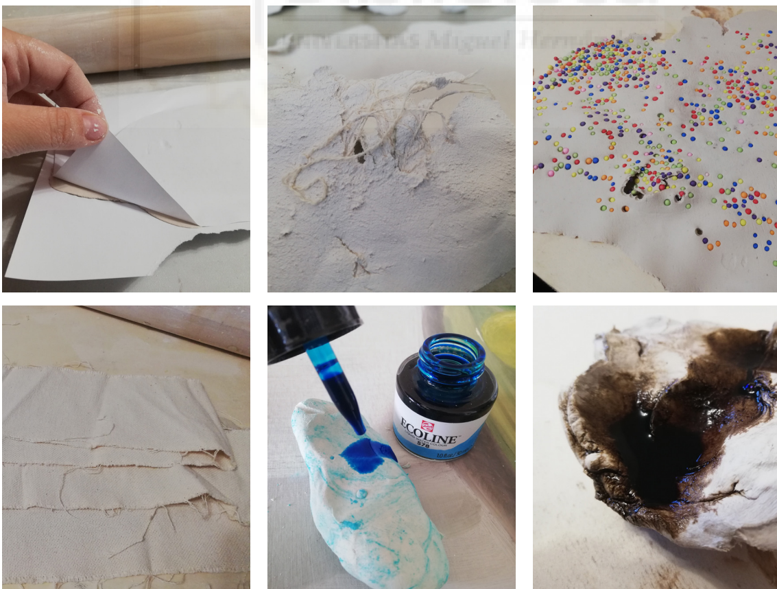
Fig. 6 Pruebas con distintos materiales incorporados a la pasta, o amasados con texturas para crear un registro después de hornear.

Por último, la luz, como símbolo de una relación oculta, en la que únicamente las personas implicadas son conscientes de todo lo que sucede entre ellas, las únicas que lo pueden ver.