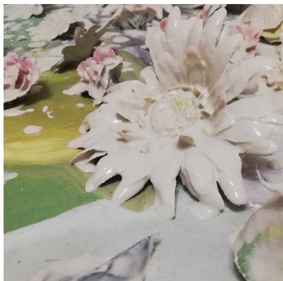
Fig. 8 Horno con flores preparadas para cocer, y detalle de una flor recién salida del baño de porcelana.