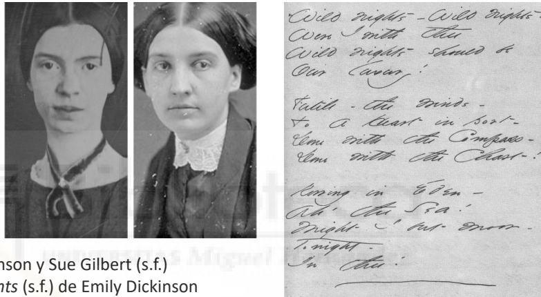
Fig. 1 Fotografías de Emily Dickinson y Sue Gilbert (s.f.) Manuscrito del poema Wild nights (s.f.) de Emily Dickinson

Es en esta última en la que me he visto reflejada, por expresar el amor por otra mujer pero sin poder gritarlo a los cuatro vientos. Aunque su amor por Susan se palpaba en cada palabra de cada poema o carta que le dedicaba, posteriormente trataron de lavar esa imagen para dar a entender que había un hombre para recibirlo, eliminando toda estela de Susan de su obra.