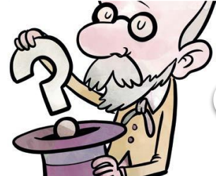
¿Quién puede ver sin la capaci...

from 'Una mente entrenada para el deporte | Revista UMH Sapiens no. 31 |