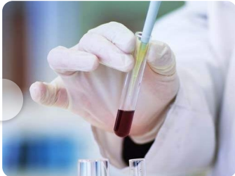
Ensayos clínicos en tiempos de...

from 'Una mente entrenada para el deporte | Revista UMH Sapiens no. 31 |