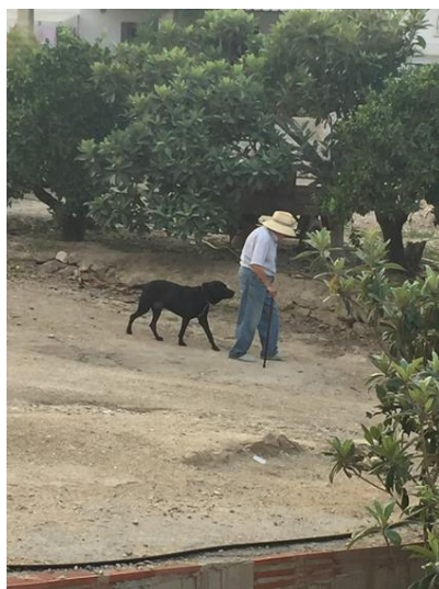
Setembre de 2019 (el meu iaïo amb 98 anys)