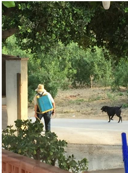
Juny de 2019 (el meu iaïo amb 98 anys)

guarden converses dels iaïos perquè com tots sabem, un dia, ells ja no estaran. Així que, sempre estaré molt agraït al professor Ors per proporcionar-me-n aquesta meravellosa idea. I, també, gràcies, iaïo per ensenyar-me tot allò que has après en la teua llarga i plena vida.