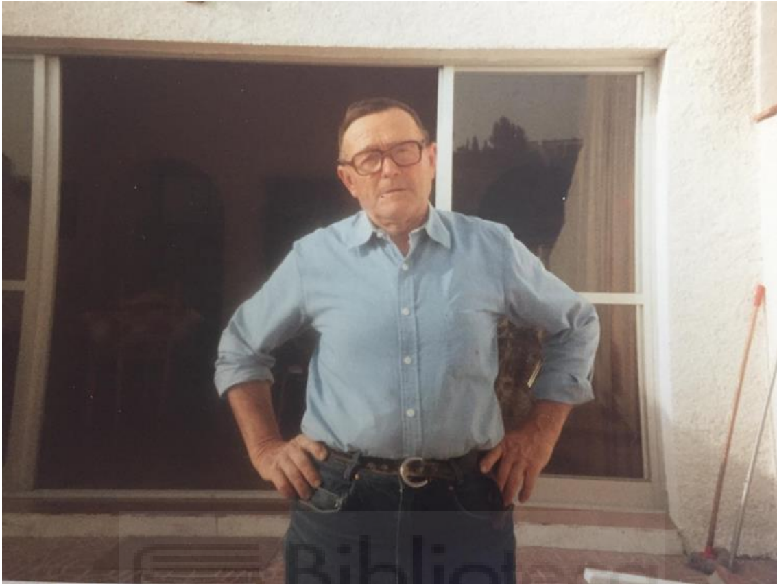
El meu iaio davant de la casa del amo de la finca (dècada dels 70)

De sobte, després de trencar el gel i iniciar la conversa, li vaig preguntar com era la vida en serveix.