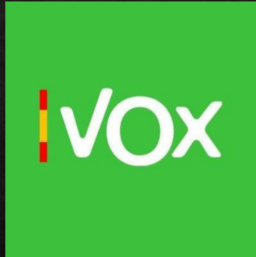
Capturas extraídas de las cuentas oficiales de los líderes de VOX en Twitter