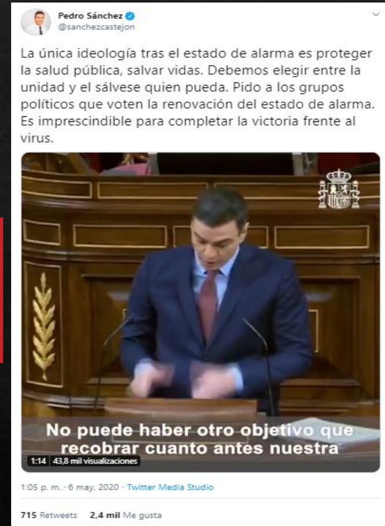
Capturas extraídas de la cuenta oficial de Twitter de Pedro Sánchez, líder del PSOE y Presidente del Gobierno