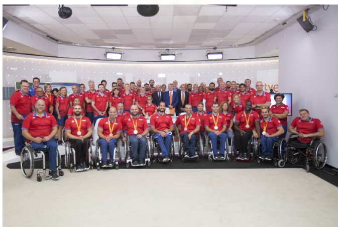
Ilustración 7 / El equipo paralímpico español acude a los estudios de RTVE tras los Juegos de Río 2016

Una de las vertientes fundamentales del Plan ADOP son los patrocinadores que apoyan a los deportistas paralímpicos. Son empresas que invierten su dinero para fomentar la práctica del deporte adaptado y apoyar a los atletas para que no desistan y puedan dedicarse en cuerpo y alma al deporte. Radio Televisión Española (RTVE), Loterías y Apuestas del Estado, Telefónica, CaixaBank, AXA, Iberdrola, LaLigaSports, Sanitas o Iberia son algunas de las empresas más importantes pertenecientes al Plan ADOP, que apuestan por los deportistas paralímpicos y les otorgan mayores posibilidades gracias a sus ayudas y su visibilidad.