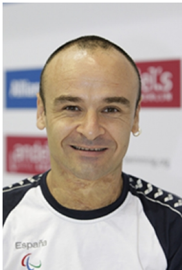
Fig. 1 / Fotografía de Ricardo Ten publicada en su perfil de la web oficial del Comité Paralímpico Español (paralimpicos.es)

hablar con conocimiento de causa. Tras establecer varios contactos, las fuentes propias seleccionadas para este reportaje han sido: