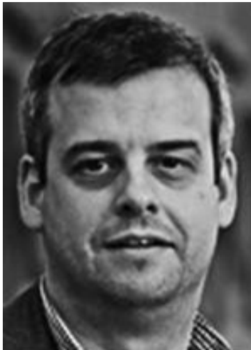
Fig. 2 / Fotografía de Luis Leardy publicada en su perfil de la web oficial del Comité Paralímpico Español (paralimpicos.es)