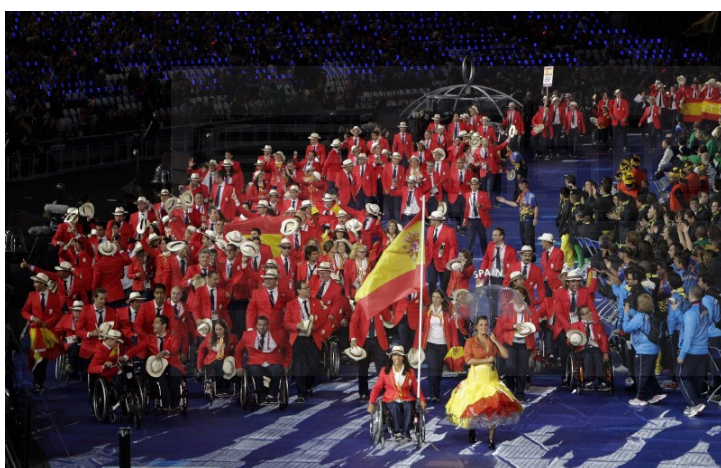
Ilustración 2 / El equipo paralímpico español durante la Ceremonia de Apertura de los Juegos Paralímpicos de Londres 2012

En los últimos años, el deporte adaptado está viviendo un proceso de crecimiento de popularidad, sobre todo desde los históricos Juegos Paralímpicos de Londres 2012. El seguimiento de aquellos juegos se ve reflejado en algunos datos ofrecidos por la página oficial del Comité Paralímpico Internacional (IPC). En redes sociales e internet, más de 5,8 millones de personas se descargaron la aplicación oficial de los Juegos Paralímpicos de Londres 2012 y se escribieron alrededor de 1,3 millones de tweets en la red social Twitter que contenían la palabra Paralímpico, según un artículo dedicado a los Juegos de Londres 2012 realizado por el Comité Paralímpico Internacional.