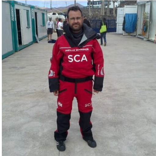
Fig. 3 / Fotografía de Ramón Chamorro de su perfil oficial de Twitter (@rchamorroep)