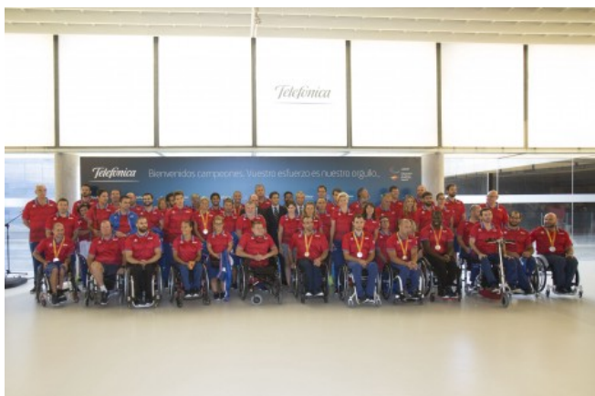
Ilustración 6 / Visita del equipo paralímpico español a la sede de Telefónica tras los Juegos de Río 2016

Una de las vertientes fundamentales del Plan ADOP son los patrocinadores que apoyan a los deportistas paralímpicos. Son empresas que invierten su dinero para fomentar la práctica del deporte adaptado y apoyar a los atletas para que no desistan y puedan dedicarse en cuerpo y alma al deporte. Radio Televisión Española (RTVE), Loterías y Apuestas del Estado, Telefónica, CaixaBank, AXA, Iberdrola, LaLigaSports, Sanitas o Iberia son algunas de las empresas más importantes pertenecientes al Plan ADOP, que apuestan por los deportistas paralímpicos y les otorgan mayores posibilidades gracias a sus ayudas y su visibilidad.