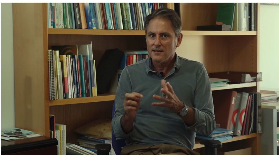
Figura 2: Detalle del plano 2.