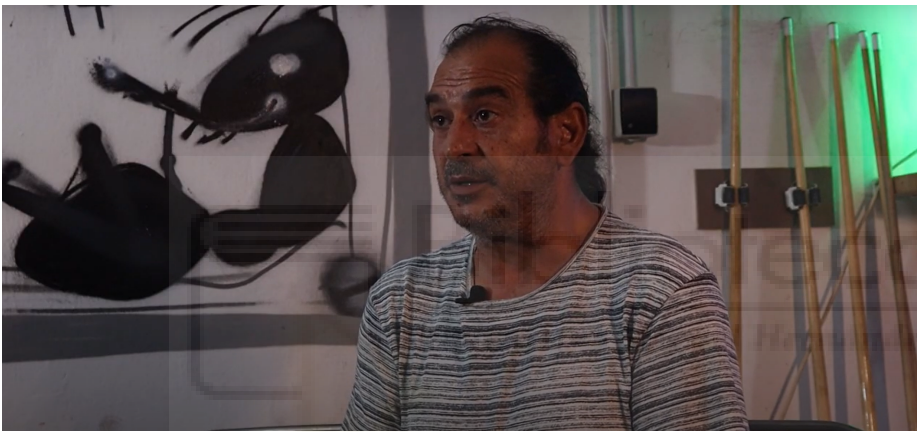
Figura 4: Detalle del plano sin etalonar.

En segundo lugar se realizo un etalonaje global para todo el documental, bajando el contraste y añadiendo un tono más verdoso a la imagen.