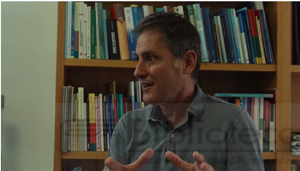
Figura 1: Detalle del plano 1.

Su entrevista fue realizada en El Parque del Oeste de Novelda, debido a esto, hubieron algunos problemas lumínicos ya que era un día nublado y el sol iba y venía con irregularidad cambiando la luz constantemente, además del viento que en algunos momentos nos hacía parar la entrevista ya que afectaba al micro.