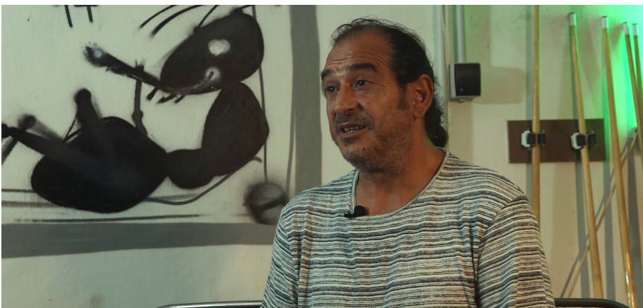
Figura 5: Detalle del plano con etalonaje.