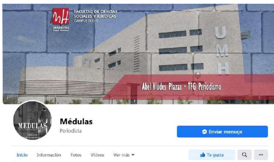
Página de Facebook creada para compartir el TFG

La red social Facebook es la que registra mayor movimiento de difusión del reportaje. Para ello se ha creado una página exclusiva y desde ahí se comparte el contenido tanto en perfiles personales como en páginas de diferentes organismos y asociaciones. Al poco de ser creada cuenta con cerca de 200 “me gusta”. Los comentarios recibidos hasta la fecha han sido positivos, en especial los de personas que han sufrido o están sufriendo la enfermedad.