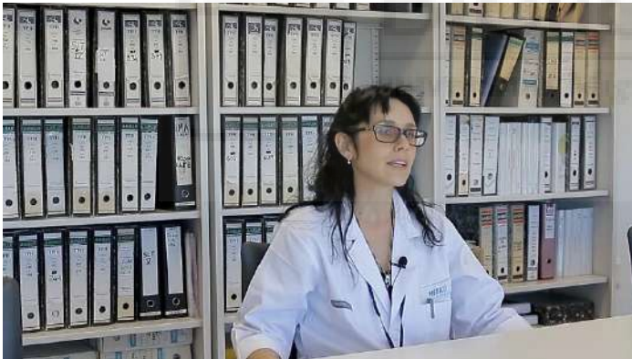
Fotograma plano 12

mieloide aguda y estuvo muy cerca de morir. Sin embargo, ha logrado superar los múltiples infortunios que ha ido encontrando en el camino y nunca ha perdido la fe.