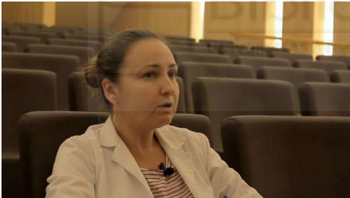
Fotograma plano 28

acerca de la delegación de tareas y de proporcionar información sobre las prestaciones económicas a las que pueden optar, a causa de la invalidez que sufren.