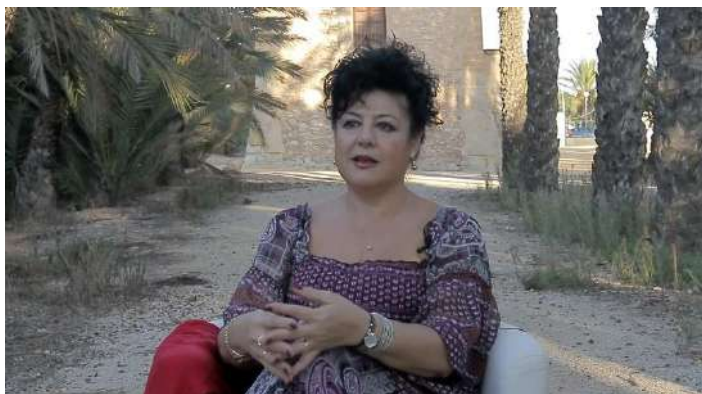
Fotograma plano 40

Presentación de las fuentes propias del reportaje en orden de aparición respecto a la pieza audiovisual: