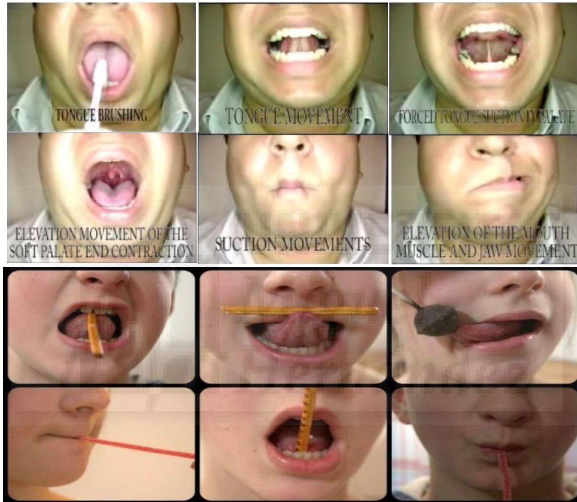
Figura 2: Ejercicios orofaríngeos (Terapia miofuncional): ejercicios de elevación y descenso de la lengua, hacia a un lado y al otro, succión y oclusión de los labios. Sin estímulo (arriba) y con estímulo (abajo).