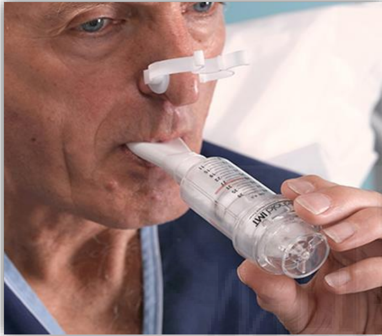
Figura 3: Entrenamiento muscular inspiratorio. Dispositivo Thershold.