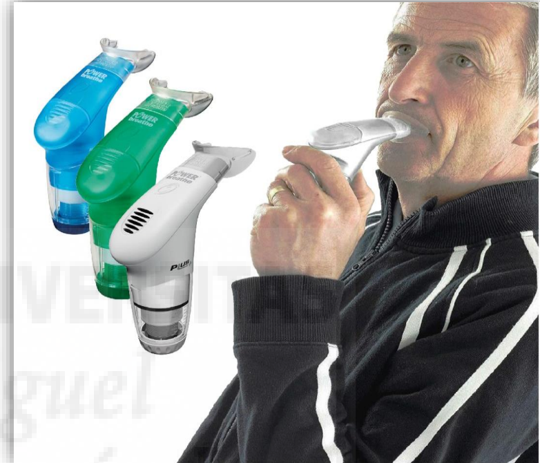
Figura 4: Entrenamiento muscular inspiratorio y expiratorio. Dispositivo PowerBreath.