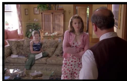
Figura 10. Kat, Bianca y el señor Stratford.

Al estar el film ambientado en los años noventa, el vestuario es el característico para las adolescentes de la década. Se puede observar una gran diferencia entre la forma de vestir de las hermanas Stratford: por un lado, Kat se viste generalmente con pantalones, camisetas y chanclas, un outfit