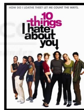
Figura 8. 10 Razones para odiarte .

Esta versión cinematográfica de La fierecilla domada es la adaptación más moderna, dirigida a un público adolescente. 10 Razones para odiarte (Figura 8) es una adaptación para las nuevas generaciones de finales del siglo XX, que presenta diferencias en cuanto a sus predecesoras, ya que traslada la historia a un instituto estadounidense y con personajes que presentan comportamientos de la época y no del Renacimiento.