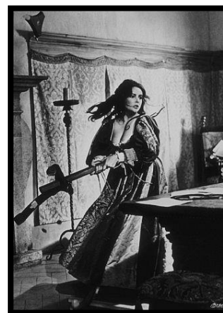
Figura 5. Elisabeth Taylor en el papel de Katherine.

Tanto el personaje de Bianca como el de Katherine se presentan, de la misma manera que en las dos obras anteriormente nombradas, como una mujer angelical y una mujer rebelde, respectivamente. Bianca sigue representando al ideal de mujer que la sociedad consideraba el correcto y Katherine, el papel de una mujer rebelde (Figura 5), difícil de domar que, por su gran temperamento, no lograría formar una familia. Por ello, se considera como una mujer apartada de lo común y que ningún hombre desea, a pesar de su belleza.