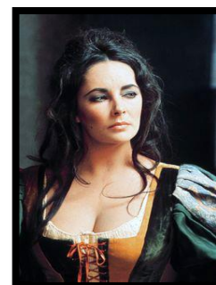
Figura 6. Katherine.

En esta adaptación el cortejo conlleva a Kate a rehuir de su futuro prometido. Durante todo el film, y concretamente en esta escena, Kate se muestra como una figura sexualizada, suponiendo un rasgo distinto a las dos obras anteriores. Existen varios planos donde los pechos de la protagonista