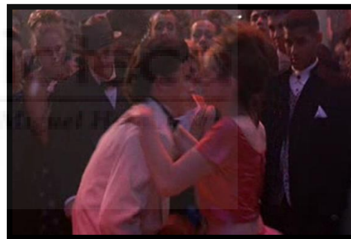
Figura 12. Fotograma 10 Razones para odiarte.

El señor Stratford termina ofreciendo más libertades a sus hijas, aunque esto significa que no deje de preocuparse por ellas. El personaje de Bianca es el que más evolución presenta, iniciándose como el modelo de mujer perfecto bajo los ojos del hombre, de apariencia “virginal”, delicada y femenina, tanto con sus actos como con su lenguaje. Al final de la cinta, Bianca se caracteriza más por asemejarse a una mujer moderna capaz de valerse por sí misma (Figura 12).