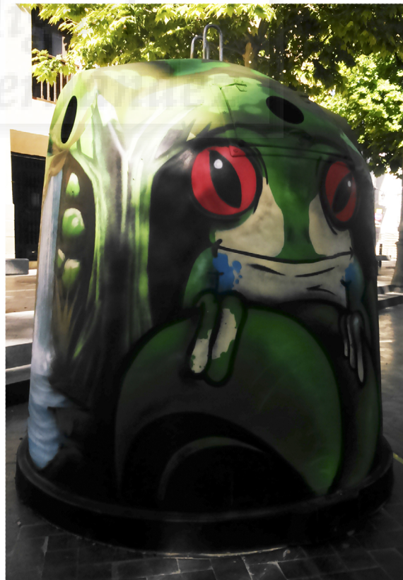
Fig.5.7. José Antonio López Zamora/Jesús Torraldo. Container/6 (2015), aerosol sobre contenedor de vidrio, 1,85 x 5,55 m aprox.