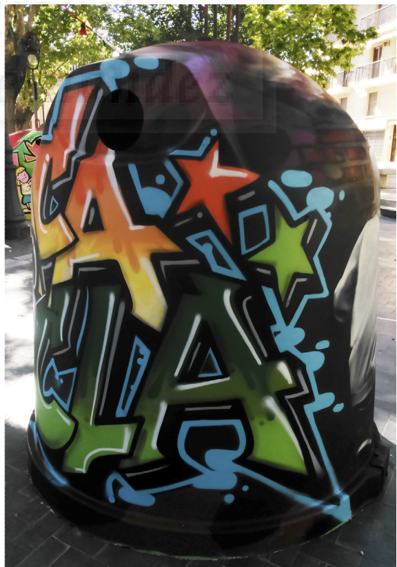
Fig.5.8. José Antonio López Zamora/Jesús Torraldo. Container/7 (2015), aerosol sobre contenedor de vidrio, 1,85 x 5,55 m aprox.