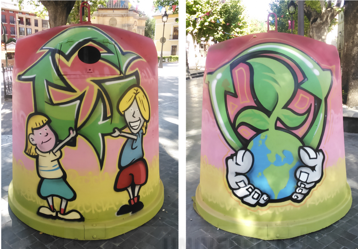
Fig.5.9. Jesús Torraldo. Container/8 (2015), aerosol sobre contenedor de vidrio, 1,85 x 5,55 m aprox.