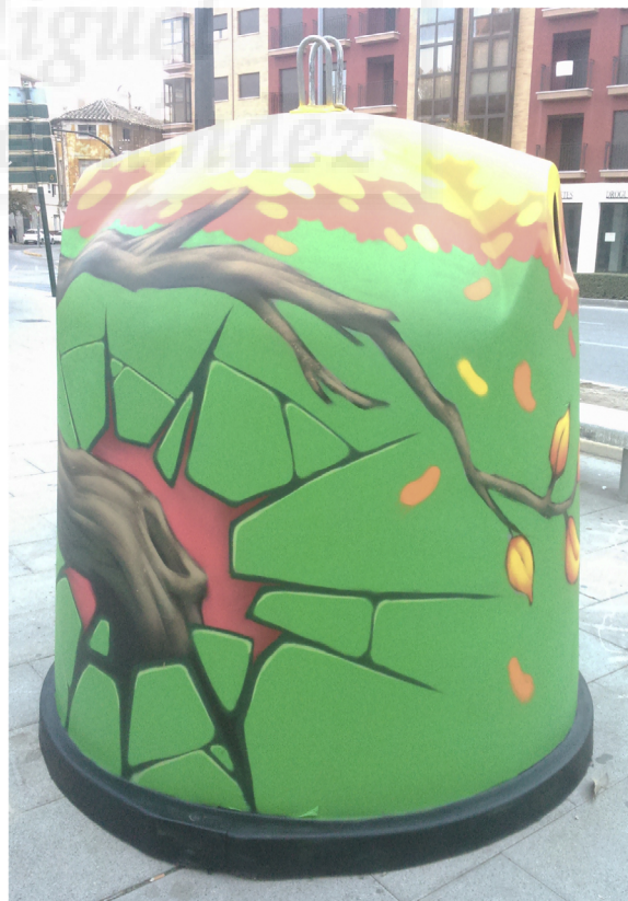
Fig.5.5. Antonio Rizo Moreno. Container/4 (2014), aerosol sobre contenedor de vidrio, 1,85 x 5,55 m aprox.