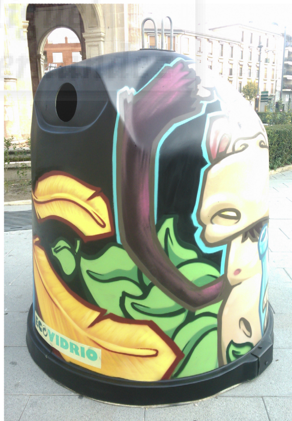
Fig.5.4. Antonio Rizo. Container/3 (2014), aerosol sobre contenedor de vidrio, 1,85 x 5,55 m aprox.