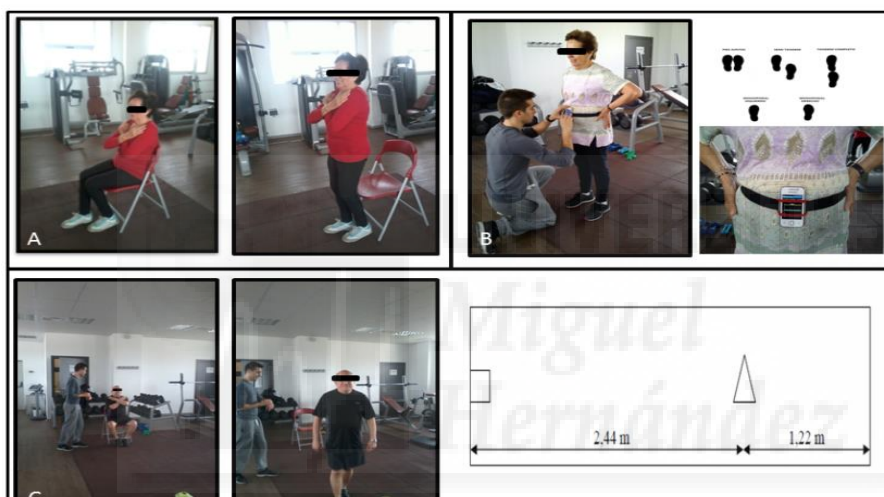
A) 30 Seconds Chair Stand Test; B) Balance Test; C) Up and Go Test